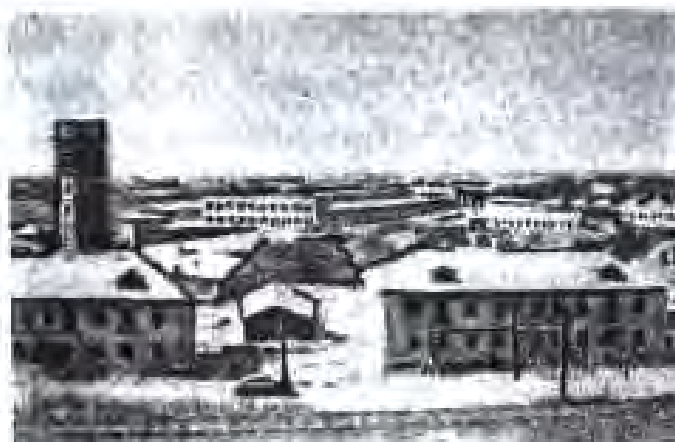
Намуди умумии комбинати бофандагии Душанбе. (с.1939)

Умумиттифоқ аз пешравихон иқтисодӣ, сиёсӣ ва мадани Тоҷикистон ҳамчун ҷумҳурии таъмоман мустақил будани он ва талабу дархостҳои мардуми Хучанду Бухорон Шарқӣ сабаб шуданд, ки ҳукумати Ўзбекистон дар бораи баргардонидани округи Хучанд ба Тоҷикистон розигии худро диҳад.