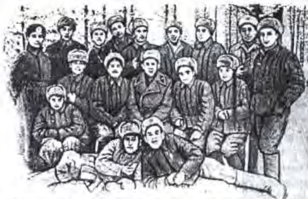
Бригадаи ҳунарпешагони Тоҷикистон дар Сталинград (с.1942)

Ин мактубро, ки 390000 аҳолии Тоҷикистон имзо карда буд, 20 марти соли 1943 рӯзномаи "Правда" ҷоп карда буд. Ин мактуб рӯҳияи ҷангии ҷанговарони Тоҷикистонро бардошта буд. Аҳоли ба "Фонди ҷанг" 147 млн. сӯм, 45207 ҳазор сӯмина қоғазҳои бурднок, 532 х. ли-