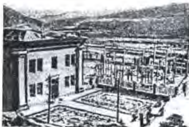
Пойгоҳи барқи оби (ПБО) Варзоб (Варзоб ГЭС) с.1937.

13 июли соли 1929 КИМ ҚШС Ўзбекистон қарори аз ҳайати