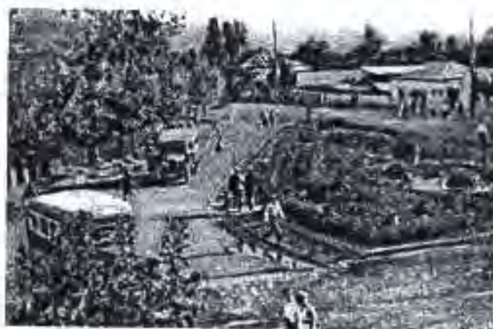
Кӯчаи ба номи Ленин (ҳоло Рӯдакӣ) с.1937 Майдони истоҳи Роҳи Оҳан

гирифт. Солҳои 1921-1924 дар вазифаҳои масъулиятнок: мутасаддӣ таъминӣ озукан Аскарони Сурх дар водии Фарм, раиси Кумитаи инқилобии вилоят, раиси Кумитаи фавқуллодаи диктатории ҶХШБ дар Бухорои Шарқӣ, раиси Кумитаи Марказии Иҷроияи Бухорои Шарқӣ ва пас аз таъсиси Ҷумҳурии Мухтори Шӯравии Сотсиалистии Тоҷикистон