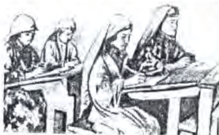
Дарс дар мактаби нави деҳаи Қизилмазор (1930)

Маорифи халқи Тоҷикистон маҳсули давраи сотсиализм буда, ташаккули он ба солҳои 20-ум рост меояд. Маорифи халқи шӯравӣ дар асоси централизи демократӣ ташаккул ёфта муттамарказ гардида буд. Органҳои идораи он Вазорати маориф ва шӯъбаҳои маорифи кумитронҳои вилоятӣ, шаҳрӣ ва ноҳиявӣ буданд. Дар