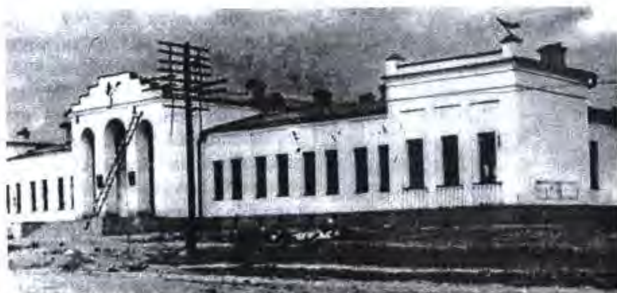
Бинои КИМ ҶШС Тоҷикистон (с.1936)

намедошт. Боғдориро бо нуриҳо ва доруҳои даркорӣ таъмин мекард. Боғдорӣ ба як шохани махсуси истеҳсолоти маҳсулоти хӯрокворӣ ва саноатӣ умуман табдил ёфта буд. Дахҳо заводҳои шаробкашию шарбатбарорӣ сохта шуда буданд.