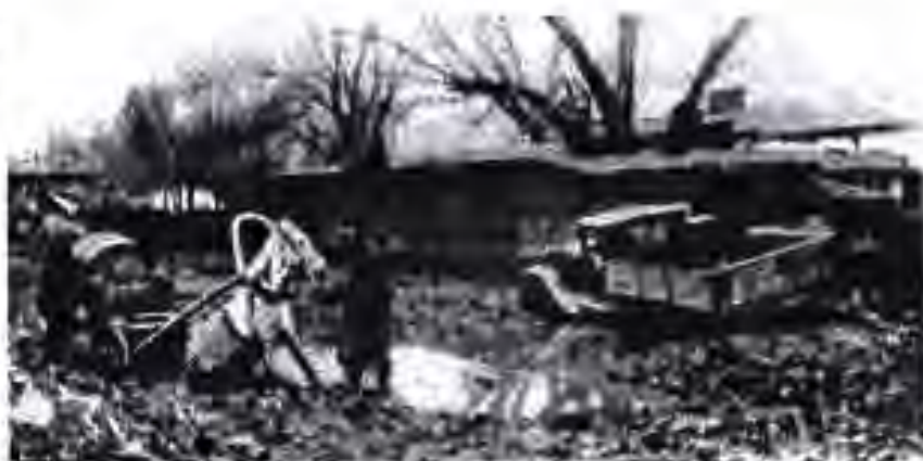
Кучаи ҳавзонии шаҳри Душанбе. (с.1929)

бии ҷумҳуриро ҲК(б) Тоҷикистон ва Комитети вилояти хизбро - КМ ҲК(б) Тоҷикистон номидан қабул кард. Дар 1 январи соли 1930 ҲК(б) Тоҷикистон аз 7 ташкилоти ҳавзавӣ (округӣ) (Фарм, Душанбе,