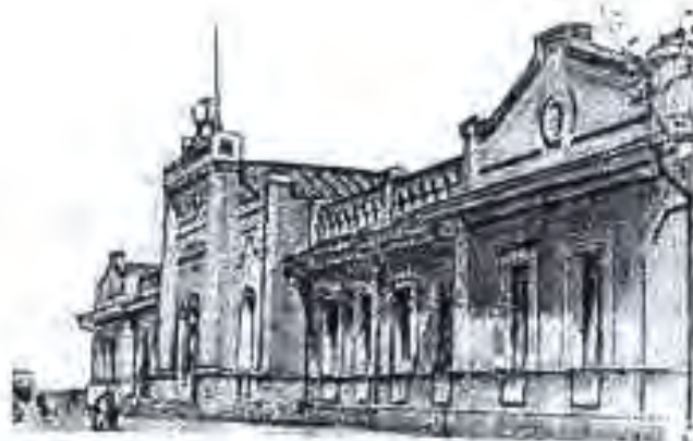
Бинои Президиуми Шӯрои Олии ҶШС Тоҷикистон (с. 1939)

сар карда воситаи асосии тақсими даромад рӯзи меҳнат ва нормани иҷрокарда гардид. Иштирокдар корҳои саҳроӣ ба тариқи бригадавӣ сурат мегирифт. Устави намунавии тозҳо ва артелҳои хоҷагии қишлоқ ҳам таҳия шуда буданд. Принципи музди меҳнатро рӯзи корӣ ва ҳаҷми корӣ муайян карда буд. Дар як рӯз чанд нормае, ки иҷро мешуд ҳамон қадар