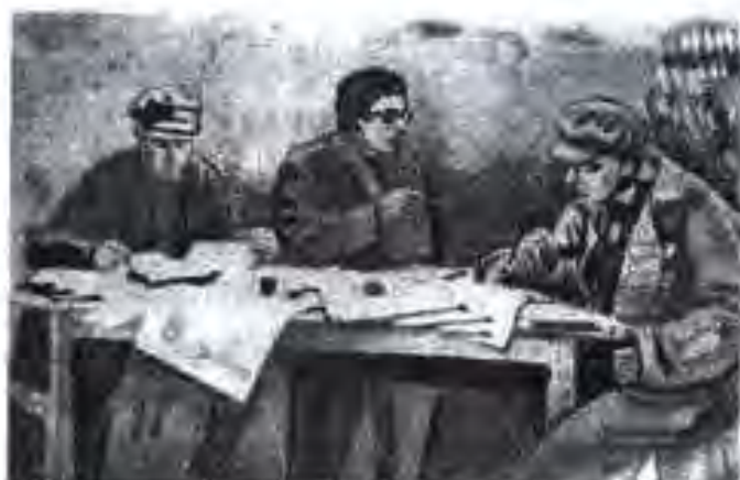
Аъзоёни таҳририяти рӯзномаи «По босмачу» (с. 1925).

Ҳаёти маданияи ҷумҳурӣ дар асоси нақшаи дурнамои сохтмони ҷомеаи сотсиалистӣ инкишоф меёфт, ки он ҳамчун нақшаи ленинии инқилоби маданӣ ном дошта, дар ибтидо бештар характери умумибашарӣ дошт. Дар солҳои 1924-1929 ин нақша ва сиёсат акнун ҷанбаҳои миллӣ умумихалқӣ ва