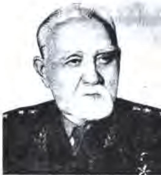
Е.Н.Павловский - яке аз асосгузори муассисаҳои илмӣ дар Тоҷикистон. Сарвари шӯъбаи Тоҷикистони АУ ИҶШС.

техника ва транспорти ПМТ-ҳо иқтисодӣ ва техникаи онҳо паст фаромад. Пахтакорӣ кам шуду галлакорӣ, боғдорӣ, кирмакпарварӣ ва чорводорӣ зиёд гардид. Аз нарасидани техникадасти корӣ, нуриҳо ҳосили намудҳои зироат паст фаромад. Ба ҳаман ин душвориҳо ва тағйиротҳо нигоҳ накарда, Тоҷикистон мебоист худро ба галла таъмин мекард ва ба фронт ёрӣ ҳам меод. Деҳотро зани тоҷик, мӯйсафедон, наврасон ба шефӣ гирифтанд. Занҳо касбҳои мардона-тракторчӣ, ронанда, чуфтрониро азбар намуданд. Агарчи истеҳсоли пахта аз 172, ҳ.т. соли 1940 ба 58 ҳ.т. дар соли 1943 фаромада бошад ҳам, меҳнати пахтакорони ҷумҳуриро ҳукумати умуминиғтифок ҳамчун галабаи меҳнатӣ эътироф карда буд. Деҳоти Тоҷикистон талаботи минималии худро бо галла таъмин мекардагӣ шуд.