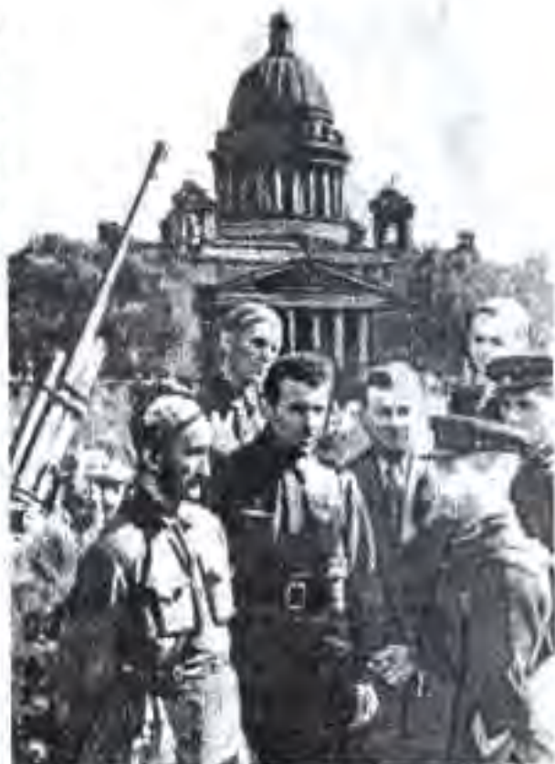
Вакилони меҳнаткашони Тоҷикистон дар назди муҳофизони Ленинград (с.1943)

ёда аз 1 млн. 200 х, ленинградиро аз хунукиву гуруснагӣ фавтидаанд. Фақат аз ноябри соли 1941 то октябри соли 1942 аз гуруснагӣ қариб 642 х. нафар аҳолии шаҳри Ленинград фавтидааст. Аз ноябри соли 1941 сар карда дар рӯи яхи кӯли Ладога роҳи автомобилгард сохта шуд, ки "Роҳи ҳаёт" ном гирифта, Ленинградро бо мамлакат мепайваст. Ба воситаи ин роҳ зиёда аз 550 ҳаз. одам аз муҳосира баровардаю 361 ҳаз. тонна бор кашонда шуда буд.