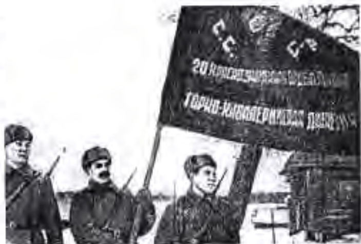
Байрақи ҷангии дивизияи 20-уми Саворагарди кӯҳӣ.

Дар ҳайати ин лашкар кӯшунҳои Венгрия, Италия, Руминия ва Финландия ҳам буданд. Дар як вақт Германияи фашистӣ дар тӯли зиёда аз 3000 км сарҳадро вайрон карда, ба хоки ИҶШС 5,5 млн. аскар, 3712 танк, 4950 самолётҳои ҷангӣ, 47260 тӯп ва миномётҳоро ба қор даровард. Германияи фашистӣ ҷанги барқосоро гузаронида ва дар муддати