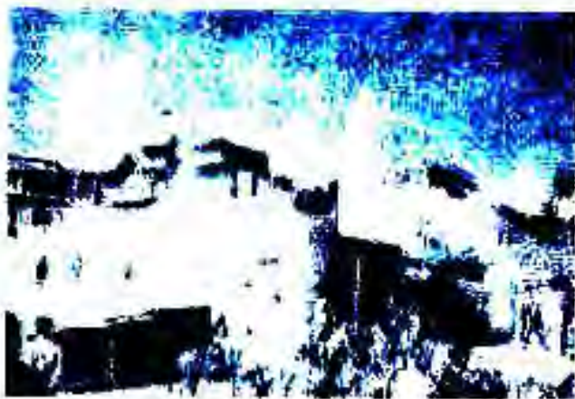
Расми 78. Дар яке аз кӯчаҳои Харар (Ҳабашистон)

Соли 1970 Ҳабашистон дар қарорҳои сиёсӣ иқтисодӣ қарор дошт, яъне алқол роҳи пешрафти худро ба қисми муайян нақарда буд. Чӣ тавре ки мушоҳида кардем, ҳукумат аввал роҳи сармоядориро интихоб кард. Вале дар нимаи дуҷуми солҳои 60-ум муваффақиятро дар рушди иқтисодӣ ва хоҷагии нақшаи мекофӣ. Сарфи назар аз ин, Ҳабашистон дар рушди иқтисодӣ ба иқтисодӣ дастовардҳои кам дошт.