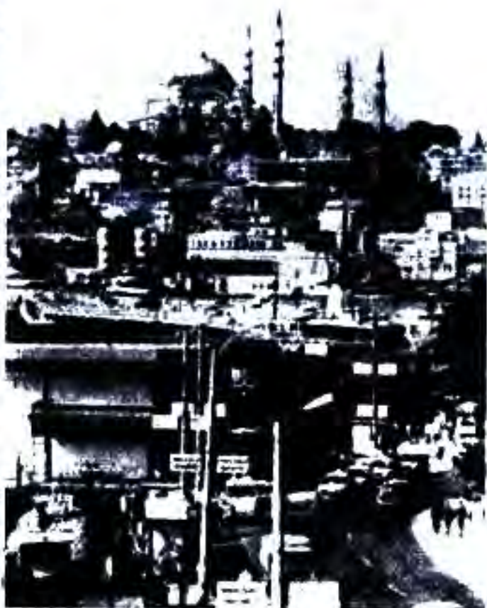
Расми 60. Яке аз маҳаллаҳои шаҳри Истамбул.

Кабинети Мендерес дар сиёсати хориҷии худ мавқеи рӯ ба Амрикоро пеш гирифта, бо ҳамин нуфузи иқтисодии сиёсии ин мамлакатро дар Туркия пурзӯр гардонид. Дар ин бора ҷанл нуктаро ба тавачҷӯи шумо пешкаш менамоем.