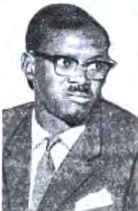
Расми 80. Патрис Лумумба.

Соли 1963 дар баъзе минтақаҳои Конго ҳаракати фидоӣҳо оғоз ёфт. Ҷавобан ба ин бо сардории М. Чомбе ҳукумат ташкил карда шуд. Ба ӯ муяссар шуд, ки ба интиқоли ҳаракати