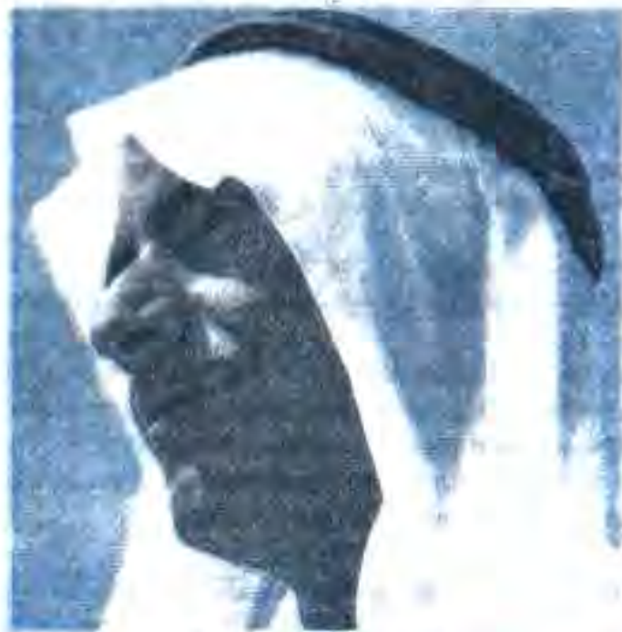
Расми 70. Суриягӣ.

Моҳи март соли 1948 Сурия ба ҷанги Фаластин дохил шуд. Зӯроварӣ бар зидди