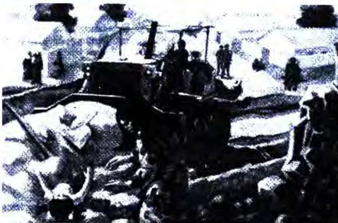
Расми 63. Овоки кӯдакии арабҳои Фаластин дар қаламрави ишғолшуда

ҶАНГИ ДУЮМИ АРАБУ ИСРОИЛ. Баъди Ҷанги якуми Арабу Исроил, ки дар он Исроил ғолиб баромад, доираҳои ҳукумронии Ғарб ҷонибдорӣ ба Исроил ҷиҳатан намерасониданд. Ин лафз дар таҷовузи зидди Миср Англия ва Фаронса ба Исроил ҳамроҳ буданд. Сарфи назар аз ин, ҳалқи Миср ба ҳифзи истиқлолияти худ бархост.