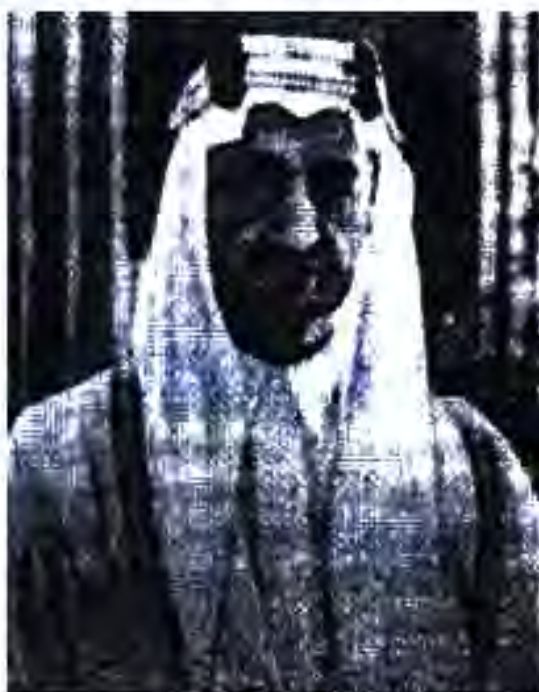
Расми 67. Шоҳи Арабистони Саудӣ Файсал ибни Абдулазиз ас-Сабоҳ (1906-1975).

Соли 1958 дар мамлакат муборизаи нави зиддимпериалистӣ оғоз ёфт, ки ба он Ҷабҳаи Ислоҳоти Миллӣ роҳбарӣ мекард. Ватандӯстон демократикунони ҷомеаи Арабистони Саудӣ, барҳам додани пойгоҳи ҳарбии Амриқоро дар Даҳран, безътибор эълон кардани созишномаҳои ҳарбӣ бо ИМА, манъи ба қорҳои дохилии Арабистони Саудӣ даҳлат кардани АРАМКО ва истифодаи боигариҳои табииро ба нафъи халқ талаб карданд. Ҳамин вақт дар натиҷаи ғош шудани иштироки шох Сауд дар сӯиқасди зидди Ҷумҳурии Муттаҳиди Араб ва президент Ҷамол Абдулносир низоъи қалон сар зад. Ин хабар дар Арабистони Саудӣ қаҳру қазаби қалонро ба вуҷуд овард, чунки дар он ҷо Ҷамол Абдулносир соҳиби обрӯи қалон буд. Аз ин истифода бурда, бародарони Сауд аз ӯ талаб карданд, ки ҳокимиятро пурра ба Файсал бидиҳад, мушовирини шох Юсуф Ясин ва Ҷамол Ҳусейнро, ки дар сӯиқасди иштирок доштанд, аз ҳамаи мансабҳо сабукдӯш қунад, аз мамлакат илҳомбахшии табaddулот-сафири ИМА-ро пеш қунад, ҳуқуқҳои бародарони шохро бо шохзодагон баробар эълон намояд ва ҳазинаи давлатиро аз дуздон наҷот диҳад. Вале Сауд ин талабҳоро рад карда, барои ёрӣ ба сафири Амрико муроҷиат намуд. Сафир ба Сауд маслиҳат дод, ки ҳокимиятро ба Файсал супорад. Сауд маҷбур шуд, ки ин маслиҳатро қабул қунад.