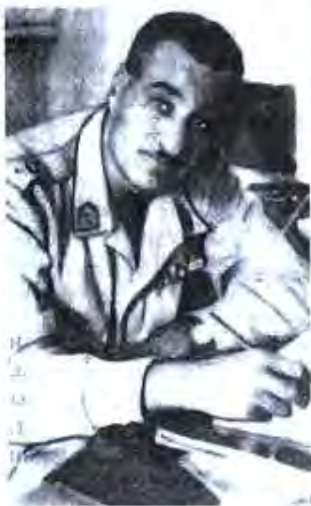
Расми 72. Ҷамол Абдулносир (1918-1970).

Ҳукумат нияти пахши ҳаракати миллию озодиҳоиро амалӣ карданӣ буд, вале аз ӯҳдаи ин кор баромада натавониста, ба истеъфо рафт. Ба ҳукумати нав шахси иртиҷопеша Исмоил Сидкипошо роҳбарӣ кард.