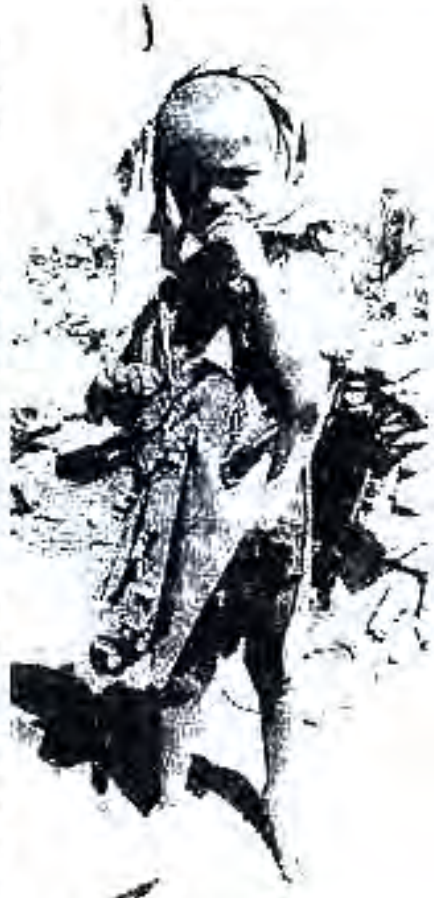
Расми 71. Хушксолию ғуруснагӣ дар Ҳабашистон.

Ҷанг дар шуури африқоӣҳо ғавсири чуқур гузошт, маҳсусан, дар шуури онҳое, ки бевосита дар амалиётҳои ҷангӣ ширкат варзидаанд, ё дар қонҳо ва қорхонаҳои саноатӣ меҳнат кардаанд. Бояд гуфт, ки африқоӣҳо дар ғалабаи иттифокчиён бар фашизм саҳми сазовор гузоштаанд. Ин омил бо африқоӣҳо имконият дод бифаҳманд, ки онҳо дорон қашом қувва мебошанд. Ишғирок дар Ҷанги дуюми ҷаҳонӣ мардуми Африқоро ба мубориза барои истиқлолият рӯҳбаланд кард.