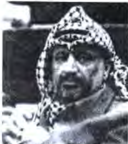
Расми 65. Раиси Ташкилоти Озодибашии Фаластин Ёсир Арафот .

меҳост, ки давлати соҳибистиклоли худро таъшиқ бидиҳад. СММ ва ҷомеаи ҷаҳонӣ бо сабабҳои пуштибон доштани Исроил масъалаи Шарқи Наздиқро ба таври ҷиддӣ ва катъӣ мавриди ҳал қарор надод. Арабҳои Фаластин бошанд, хотирҷамъ нанишаста, бар зидди истилогарони яхудӣ мубориза бурданд. Ҳар кадоми ин дастахоро ягон давлати араб дастгирӣ мекард. Дар аввал онҳо амалиёти худро бар зидди Исроил ба таври муштарак ба амал намебароварданд. Ба ин муҳолифатҳои дохилии онҳо ҳалал мерасониданд. Аввали солҳои 60-ум дастаҳои парокандаи фаластиниҳо муҳолифатҳои байни худро бартараф карда, муттаҳид шудан гирифтанд.