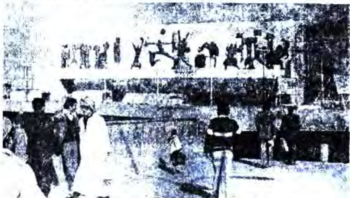
Расми 69. Лавҳаи (нақши муқарнаси) «Озодӣ» дар яке аз майдонҳои марказии ш. Бағдод.

Сарфи назар аз ин, дар роҳбарияти мамлакат ҷонагӣ вуҷуд надошт. Дар масъалаҳои муҳимтарини рушди сиёсӣ ва иқтисодӣ иҷтимоии мамлакат фикрҳо гуногун буданд. Президенти Ироқ Абдусалом Ориф натавоност ҳолати инқилобии нерӯҳои сиёсӣ ва Ғарбӣ миллиро дар ҳаёти худ нигоҳ дорад. Нерӯҳое, ки ба ғояҳои инқилобӣ содиқ буданд, охишта-охишта аз ӯ дур шуданд. Дар мамлакат куштори мардуми бегуноҳ ва аъзонҳои ақсоби тамоили демократишуда қатъ нагардид. Ба ин мушкилот то ҳол ҳал нашудани масъалаи курдҳо ва тезу тунд шудани муносибатҳо бо мамлакатҳои дигари араб зам шуданд. Аз ин вазъият истифода бурда 18 ноябри соли 1963 гурӯҳбанди ҳарбӣ Абдусалом Ориф табаддулоти нави давлатӣ ба амал бароварда, тамоми ҷонибдорҳои Ҳизби БААС-ро аз ҳукумат нест кард.