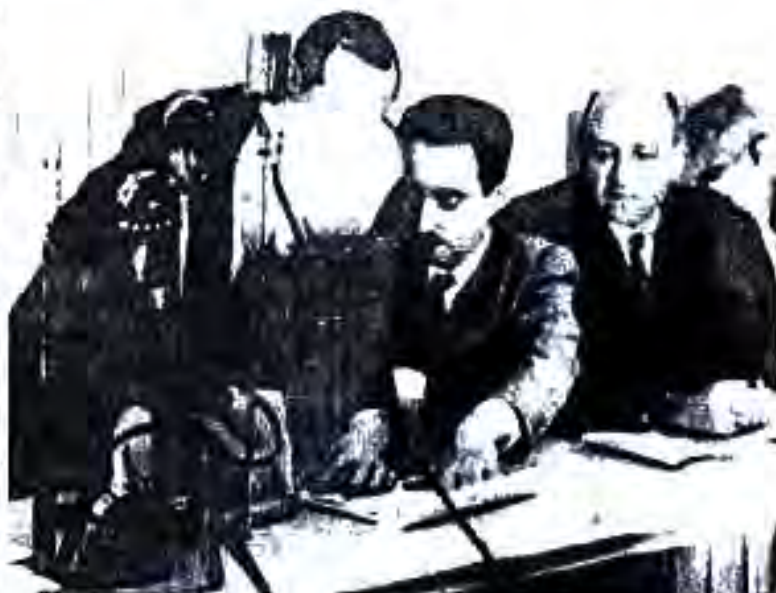
Расми 61. Намояндаи яҳудиҳо Довид Бен Гурион дар қарордод оид ба таъсиси давлати Исроил имзо мегузорад.

Тибқи Қарори Маҷлиси Қулли СММ, ки моҳи ноябри соли 1947 қабул карда шудааст, бояд дар ҳудудҳои муайяни қаламрави Фаластин ду давлат - давлати арабӣ ва давлати яҳудӣ ташкил карда ва ба Байтулмуқаддас мақоми байналхалқӣ дода мешуд. Дар баробари ин дар қарор омада буд, ки ин ду давлат нисбати ҳамдигар бояд сиёсати сулҳҷӯна бурда, ҳуқуқҳои ақалиятҳои миллии қаламрави худро риоя кунанд. Вале яҳудгароён ба қарори СММ итоат накарда, таъсис