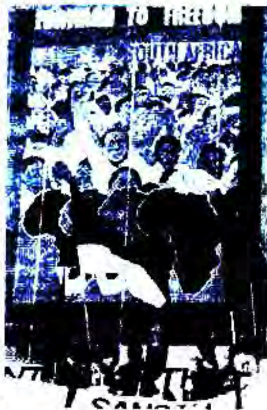
Рисми 81. Ҷонибдорони истиқлолияти Намибия дар ҶАҶ ғирдиҳамой ташкил намуданд.

Роҳбари Ҳизби Миллатгаро Д.Малан апартеидро сиёсати расмӣи ҳукумати ҶАҶ қарор дод. Ӯ ин назарияро бо гоյҳои ағомфиребона "асоснок" менамуд. Масалан, идеологҳои "Брудербонд" чунин гоёро талқин мекарданд, ки гӯё африканерҳо "халқи хона" буда, онҳоро ҳадо интиҳоб кардааст. Мувофиқи ақидаи "Брудербонд" ва Ҳизби Миллатгарои Малана тамоми аҳолии мамлакатро чун аҳроме тасаввур кардан мумкин аст, ки дар қудлаи он африканерҳо, дар поёни онҳо -- сафедпӯстон, яъне англисҳо, немисҳо, аз онҳо поёнтар - яҳудиҳо, баъди онҳо дурағҳо ва ҳиндуҳо истодаанд. Дар поёни онҳо бошад, миллионҳо африкоисҳо ҷой гирифтаанд. Брудербонд дар ҳамин асос ҶАҶ-ро аз тобеияти Британияи Кабир бароварда, соҳибистиклол карданро ба гоё ва талаби асосии худ таъдил дод. Он вақт тамоми қонуғзори Ҷумҳурии Африқои Ҷанубӣ дар асоси апартеид ба роҳ монда шуд.