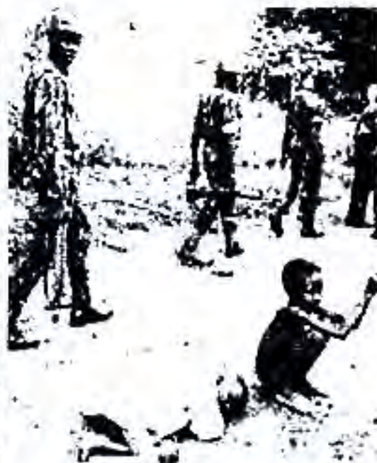
Расми 76. Қурбонии ҷанги шаҳрвандӣ дар Нигерия

Ҳукуматдорони Британияи Кабир маҷбур шуданд, ки Конституцияи Нигерияро аз нав дида бароянд. Барои ҳамин онҳо онд ба ин конституция конференсияи доир намуданд. Дар таҳрири нави Конституцияи Нигерия тоҷи миғтакавӣ афзалият пайдо намуд, тоҷи таққили