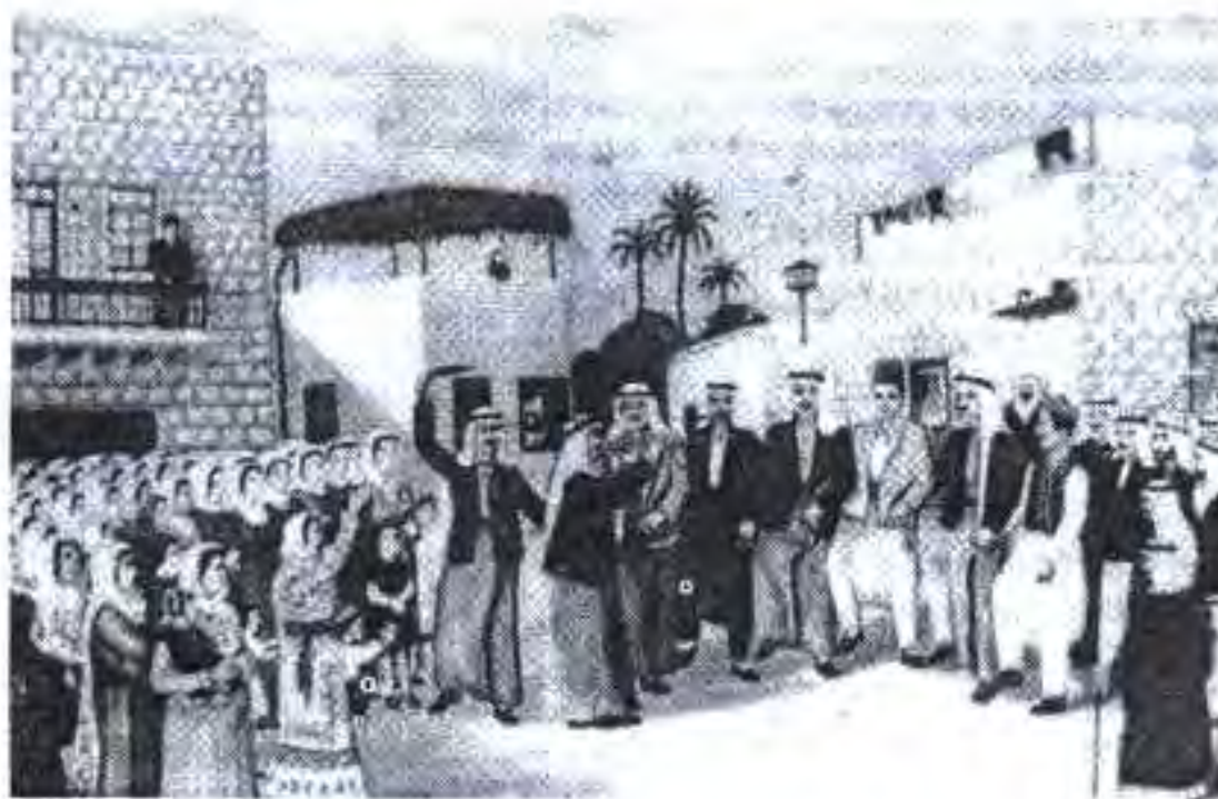
Расми 62. Фаластиниҳои дар гурбатбуда.

Ин ҷанг солҳои 1948-1949 ба амал омадааст. Дар натиҷаи ёрии васеъи сиёсӣ, дипломатӣ, молиявӣ ва иқтисодӣ ИМА ва давлатҳои дигари империалистӣ, инчунин дастгирии ҳаматарафаи яҳудгароёни байналхалқӣ Исроил тавонист қисмати зиёди Фаластинро, ки бо қарори Маҷлиси Кулли СММ бояд ба ҳайати давлати Араби Фаластин дохил мешуд, забт намуд. Аз тарафи сионгароёни яҳудӣ садҳо деҳаҳо гузарҳо ва шаҳрҳои Фаластин ба ҳокимон карда, ҳазорон арабҳо аз ватани аҷлодиашон пеш карда шуданд. Аксарияти арабҳои Фаластин ба гуреза табдил ёфтанд. Моҳи декабри соли 1949 СММ маҷбур шуд, ки барои ёрӣ ба фаластиниҳои гуреза махсус агентӣ таъсис намояд.