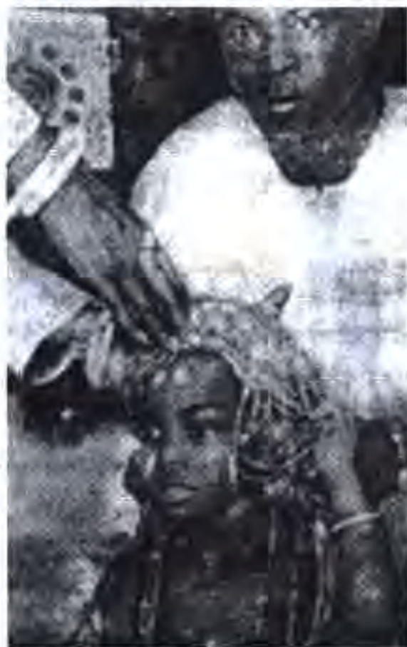
Расми 77. Тоҷаузории «аба»-и ҷавонтарин дар Нигерия.

Баҳисобгирин аҳоли, ки дар он бо мақсадҳои сиёсӣ ба изофанависӣ роҳ дода шуд, торумори роҳбарони Гурӯҳи Амал, соли 1963 ва ба суд кашидани онҳо