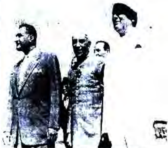
Расми 73. Ҷамал Абдулносир дар байни вакилони Конференсияи кишварҳои ҳамроҳношуда. Белград, соли 1961.

Баъди ин воқеаҳо ЧМА ном, парчам ва суруди миллии худро нигоҳ дошт. Он танҳо соли 1972 Ҷумҳурии Мисри Араб ном гирифт.