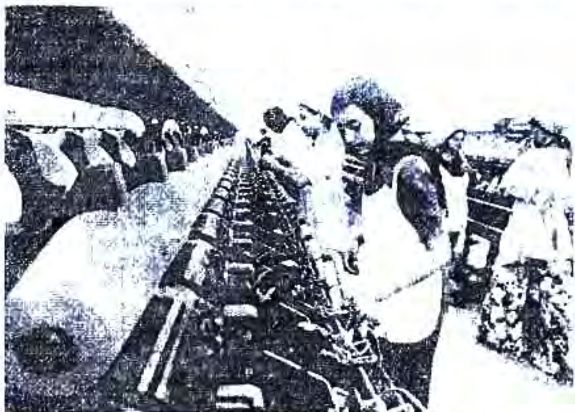
Расми 68. Дар фабрикаи расмонресии шаҳри Адэн.

Аҳмад ибни Яҳё дар аввали худро ҷонибдори истохоти либерали венамуд карда бошад ҳам, дар ин самт ягон қоне накард. Ӯ дар амал бо роҳи падараш рафт.