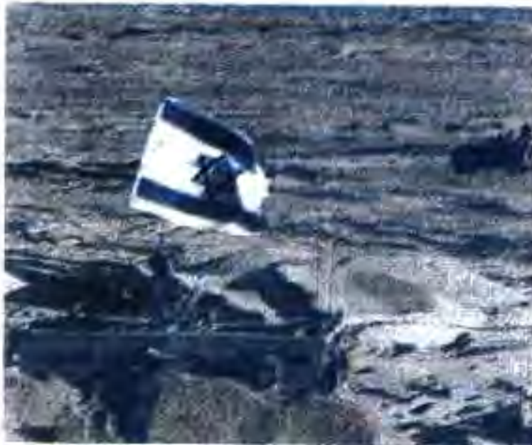
Расми 64. Пашкари Исроил машғули истилогарӣ дар нимҷазираи Сино.

Баъди Ҷанги дуҷоми Арабу Исроил дар Шарқи Наздик вазъи сиёсӣ то як дараҷа тағйир ёфт. Ҳаракати озодихонаи зиддиимпериалистии халқҳои араб муваффақияти калон ба даст овард. Дар Ироқ ва Яман режимҳои рӯй ба ҷониби мамлакатҳои империалистӣ барҳам дода шуда, арбобони миллии ватанпарвар ба сари қудрат омаданд. Вале баъди соли 1956 ҳам силоҳи асосии давлатҳои империалистӣ дар муқобили арабҳо Исроил мондан гирифт. Идеологҳои сионгаро даъво доштанд, ки қаламрави "Исроили Бузург