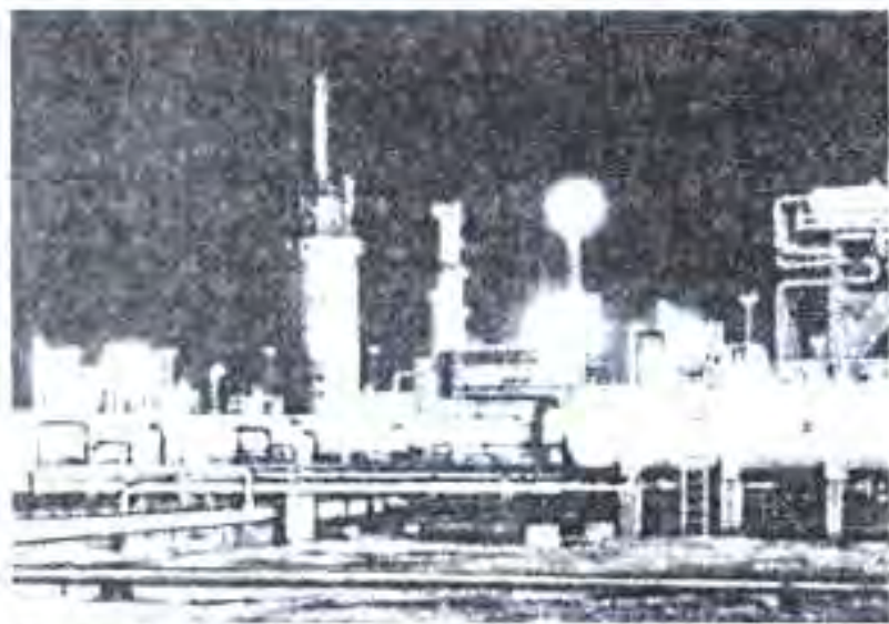
Расми 75. Дар қони нафти Хосси Массвуд (Алҷазоир).

Моҳи августи соли 1962 ҳаколатҳои Ҳукумати Муваққатии Алҷазоирро Бюрои Сиёсии "Ҷабҳаи Озодибахши Миллӣ" (ҶОМ) гирифт. Бо ҳамин сабаб низоъ ба амал омад. Бюрои Сиёсии ҶОМ муҳолифони худро таваассути артиш торумор кард. Баъди ин муҳлати интиҳобот ба Маҷлиси Муассисон муқаррар карда шуд. Дар ин интиҳобот мардум танҳо ба номзадҳо аз нерӯҳои ҶОМ овоз доданд, чунки аз тарафи нерӯҳои дигар