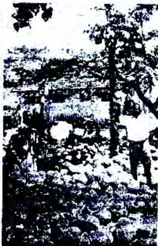
Расми 79. Бозори назди роҳ дар Танзания.

9 декабри соли 1961 Танганика соҳибистиқлол эълон карда шуд.