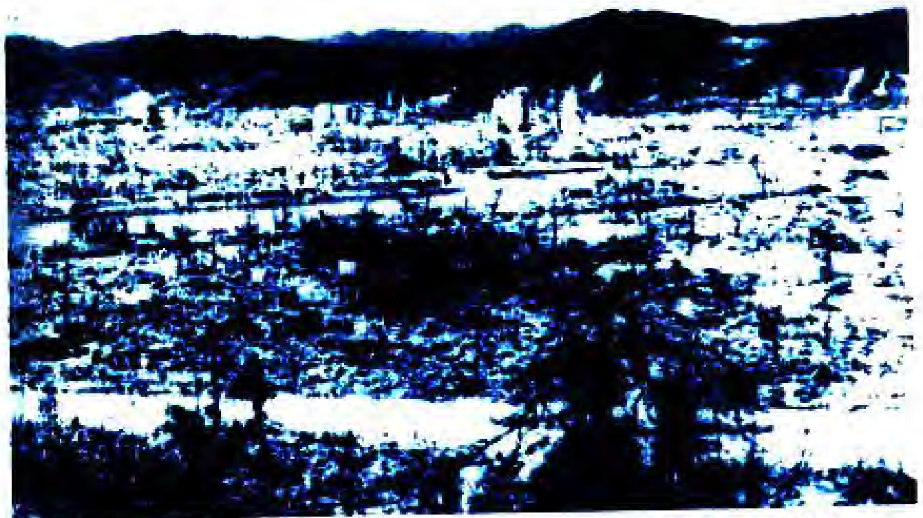
Расми 43. Хиросима баъди бо силоҳи ҳастаӣ гулӯлаборонкунии ИМА.

ҶОПОН БАЪДИ ТАСЛИМШАВИ. Баъди таслим шудани Ҷопон аз ҷониби ИМА онро ишғол намуд. Ҷопон дар гули солҳои 1945-1952 дар ҳолати ишғоли Амрико монд.