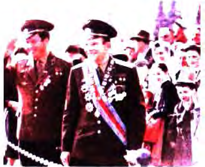
Расми 33. Кайҳоннаварди нахустин, шаҳрванди Иттиҳоди Шӯравӣ Юрий Алексеевич Гагарин.