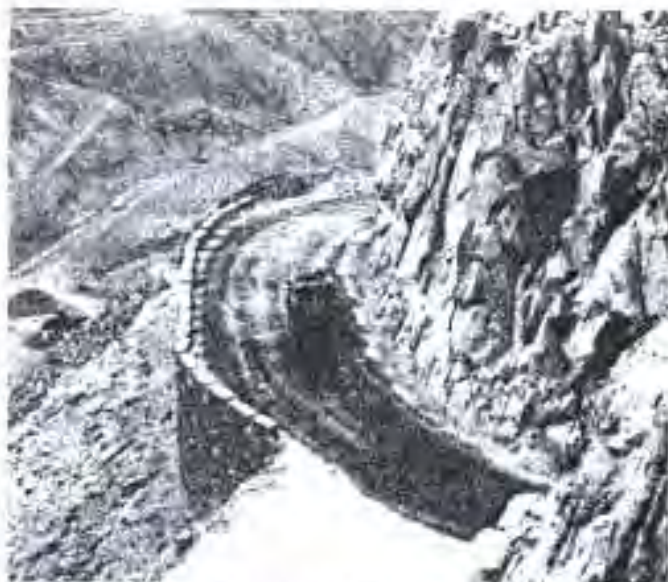
Расми 57. Нақби нақлиётӣ дар вабаи Селанг

Довуд рохбар таъйин шуд. ӯ роҳи нав - бо ёрии давлат ба рушди иқтисодии мамлакат муваффақшавиро пеш гирифт.