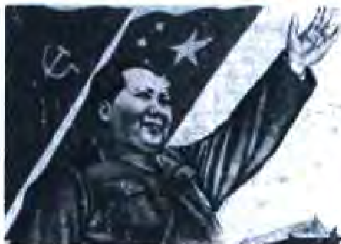
Расми 35. Мао Тсзе-дун

Ба Ҳизби Коммунистии Чин муяссар шуд, ки аксарияти оммаро тавассути шиорҳои ба мардум маъқул ба тарафи худ кашад. ҲКЧ барои мустаҳкам кардани мавқеъ ва ҳокимияти худ чораҳои мушаххас меандешид. Дар ин кор ба ҲКЧ АОХ ёрдамчин бозғитимод буд.