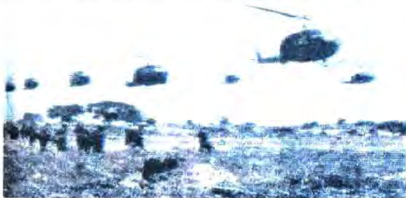
Расми 40. Вусъати тачовузи ҳарбии ИМА дар Вьетнам. (соли 1966)

Ин "дигаргунсозӣ"-и Амрико дар Вьетнам Ҷанубӣ дар рафти ҷанги тачовузкоронаи ИМА бар зидди халқи Вьетнам ба амал бароварда шуданд. Ҳукумати Амрико ҳанӯз соли 1965 онқоро бар зидди ҚДВ ҷанг оғоз кард. Аз баҳори ҳамон сол сар карда ҷузъу томҳои артиши ҳушкитарди Амрико ба Вьетнам Ҷанубӣ дароварда шуданд. Тирамоҳи ҳамон сол перухон экспедиционерии Амрико дар ин ҷо ба 184 ҳаз. нафар ва то баҳори соли 1968 ба 516 ҳазор нафар расонида шуданд. Ба амалиётҳои ҳарбии зидди НҲОМ Вьетнам Ҷанубӣ