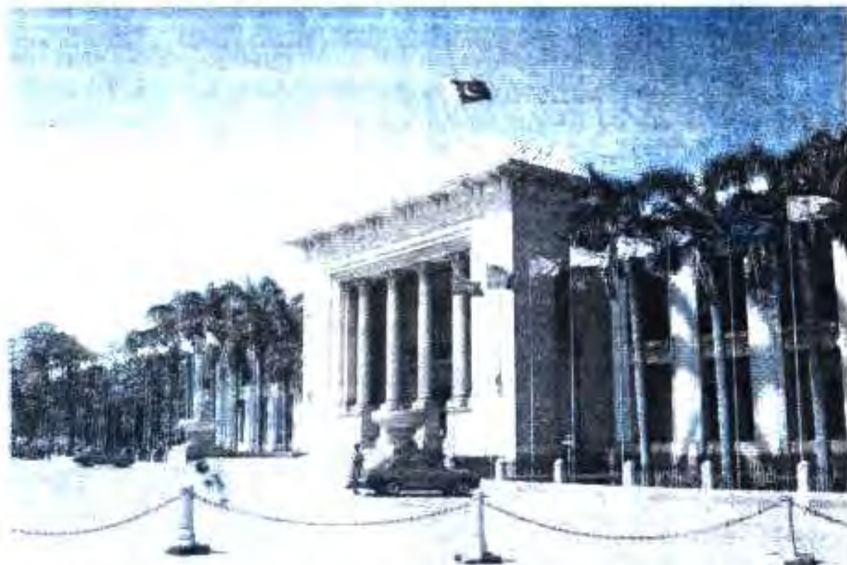
Расми 54. Қасри Асамблеяи Халқӣ дар Лоҳур (музофоти Панҷоб).

4. Музофотҳо, қаламравҳои хурд ва шаҳрҳои қалъистарини Покистонро аз хариҷа нишон диҳед?