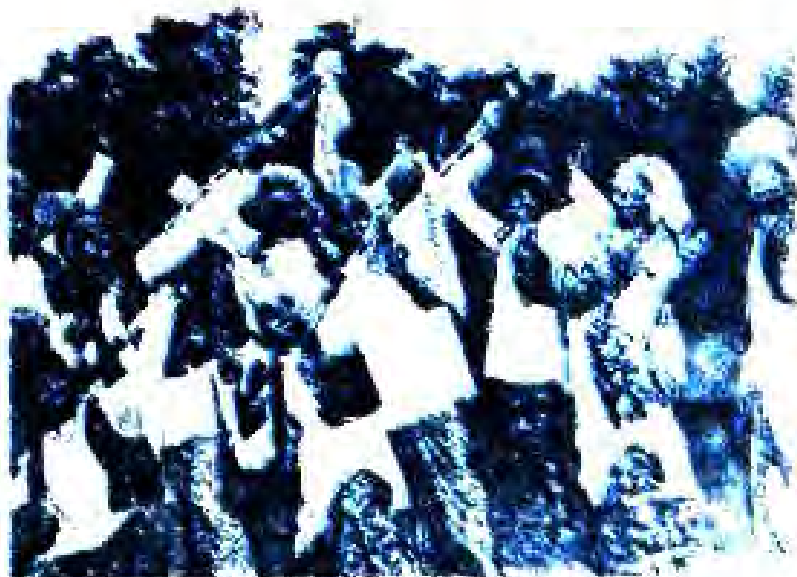
Расми 41. Ҳиндустониҳо

Ду ҷанги ҷаҳонӣ бӯҳрони ниҷоми мустамликадоронро нуриҷур кард ва дар солҳои 1945-1960 ва баъди аз ҷониби Созмони Миллати Муттаҳид қабул карда шудани Эълония дар бораи ба давлатҳои мустамлика ва тобел додани истиқлолият ҷарасеби аз зери тобениге мустамликаҳои ниҷоми вақолат оғоз шудани ин мамлакатҳо нустиқ ёфт.