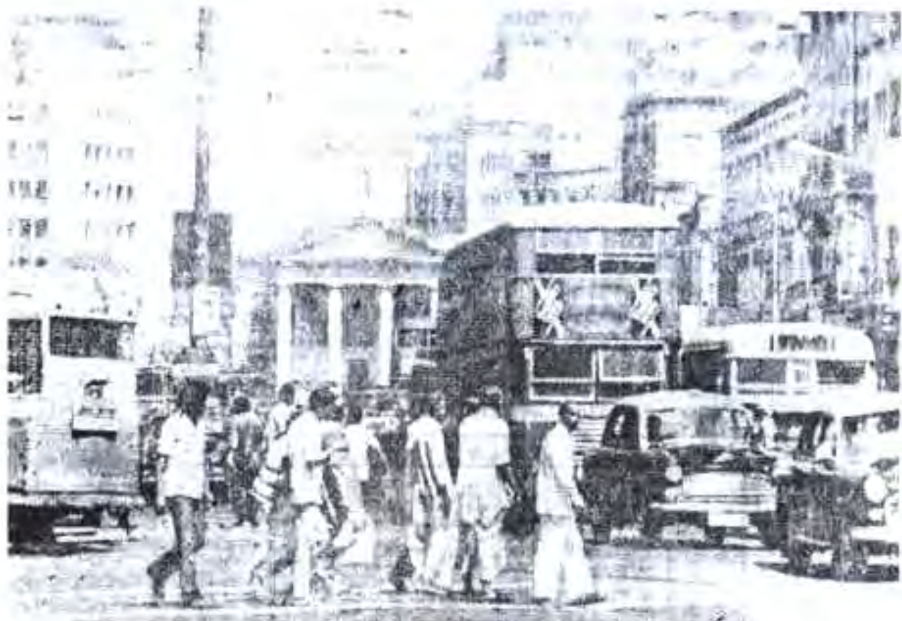
Расми 52. Намуди яке аз кӯчаҳои шаҳри Калкутта.

ки иёлати нави алоҳидаи Андхара ташкил карда шавад. Сабаби ин иқдом он буд, ки дар минтақаи Телингени Хайдаробод кавми талугу сукунат дошт. Дар князин Траванкур ва Кочин ҳаракат барои ҳамаи каламрави сукунати кавми маҷаялро дар иёлати ягонаи Керала муттаҳид кардан ба амал омад. Дар Махараштра, яъне дар каламрави Бомбай, ки маратхҳо сокин буданд, ҳанӯз соли 1945