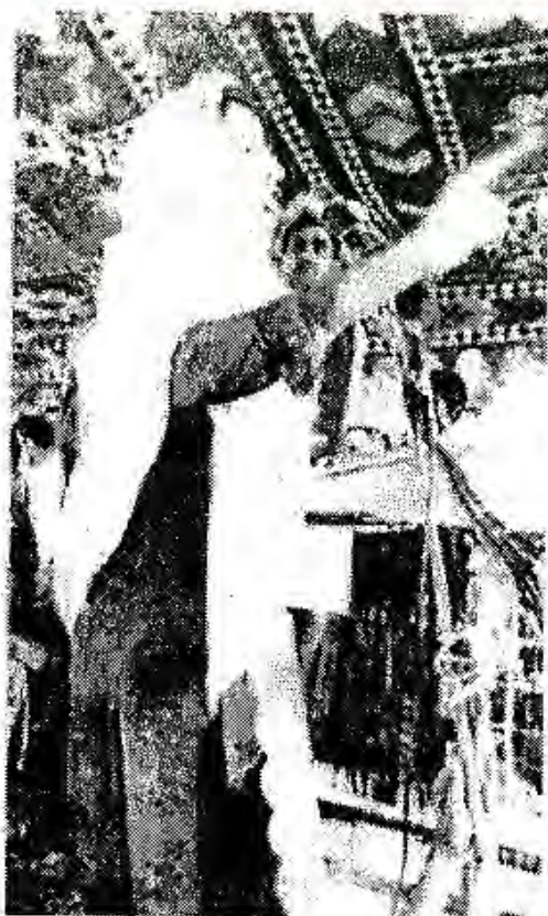
Расми 56. Нахуствазири ояндаи Покистон Беназир Бхутто дар гирдиҳамаи баромад мекунад.

ВАЗЪИ ПОКИСТОН ДАР СОЛҲОИ 60-УМ. Муҳаммад Аюбхон 8 июни соли 1962 дар мамлакат вазъи ҳарбиро бекор карда, Конститутсияи нави Покистонро