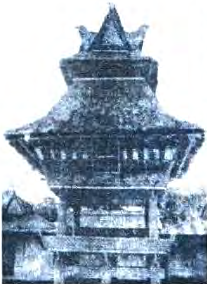
Расми 48 Биноҳои ҷамовии Индонезия ба ҳамин гуна меъмории хоси худ фарқ мекунанд

роҳбарӣ кард. Ин ҳукумат муносибатҳои иттифоқиро бо Ғолландия барҳам дод. Аз дохилнавиши Индонезия ба СЕАТО даст кашид. Бо мамлакатҳои зиёди сотсиалистӣ, аз он ҷумла, бо ИЧШС алоқа барқарор кард. Индонезия яке аз ташаббускорони даъвати Конференсияи якуми мамлакатҳои Осиё ва Африқои моҳи апрели соли 1955 дар Бандунг баргузоргардида мебошад. Сиддати ҳоричии мустақиллона-обрӯдо эътибори Ҷумҳурии Индонезияро дар арси байналхалқӣ зиёд кард.