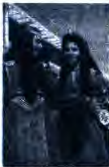
Расми 58. Муаллимаҳои бӯхотӣ аз Ҷалолобод.

Навгони дигаре, ки баъди қабули Конститутсияи Афғонистон дар ҳаёти ҷамъиятию сиёсии мамлакат ба миён омад, ин аз тарафи ҳукуматдорон қӯшиши ташкили аҳзоби сиёсӣ буд, ҳизбҳос, ки барномаашон ба барномаи ҳокимияти расмӣ мувофиқат кунад. Дар ҷараёни таъсиси чунин ҳизбҳо дар доираҳои ҳукмрони Афғонистон зиддиятҳо ба амал омаданд. Ҳукумат аз фаъол шудани афкори ҷамъиятӣ ба ташвиш афтод. Барои ҳамин қисмати мухолифкор (консервативӣ)-и ҳукумат бар он ақида буд, ки бояд ба усулҳои қаблӣ идораи давлатӣ баргашт. Аз ин рӯ, онҳо тақозо карданд, ки аз вазъаҳои конститутсионӣ даст кашада шаванд. Чунин сиёсат ҳукуматро беобрӯй кард. Бо ҳамин сабаб моҳи октябри соли 1967 нахуствазир Муҳаммад Ҳоким Майвандвол ба истеъфо рафт.