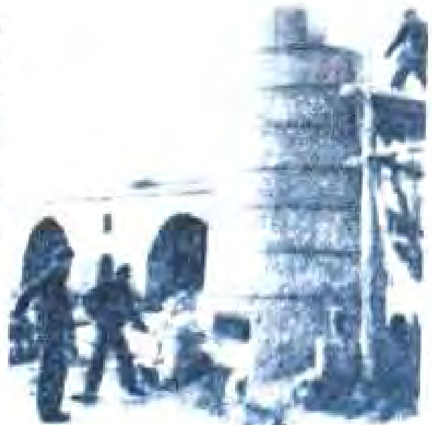
Расми 36. «Ҷаҳиши бузург» дар деҳаи Чин.

Ба ҳаракати «хунвэйбинҳо» лонниҷӯёни макотиби олий ва таълимгоҳҳои дигар ҷалб карда шуданд. Дар таълимгоҳҳои дареҳо катъ гартаиданд. Аз рӯи дастурҳои «Ҷане Мао» ҳазорон нафар роҳбарони ХКЧ, давлатӣ, арбобони машхури илму фарҳанг ва ашхоси каторӣ ба таъкиботи шидди «хунвэйбинҳо» гирифттар шуданд. Аз моҳи декабри соли 1966 ба «хунвэйбинҳо» дастаҳои «тезофанҳо» («неён арон») низ ҳамроҳ шуданд, ки ҳафат ва усули фаъолияти онҳо низ ба «хунвэйбинҳо» монанд буд. Дар амал бедолгариҳои «хунвэйбинҳо» ва «тезо-фанҳо», ки «инкилоби мадани» ном гирифтааст, табақдулоҳои сиёсӣ ир-тиҷой буд. Он ба иқтисод, фарҳанг ва кадрҳои ҳизбию давлатии Чин талафоти қалон дод. Халқи заҳматқанди низ маврили таъкибот ва террор қарер гирифт.