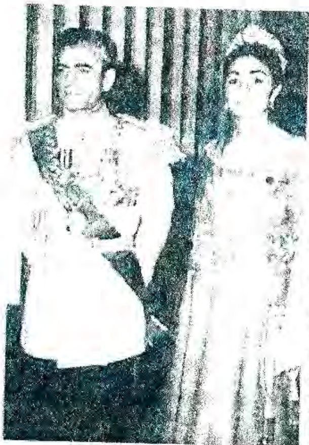
Расми 59. Шоҳи Эрон Муҳаммад Ризо Паҳлавӣ бо ҳамроҳии малика.

ҲАРАКАТИ ИҚТИМОИЮ СИЁСӢ. Чӣ тавре ки шумо аз таърихи умумӣ дар синфи 9 сабақ бардоштед, дар Конференсия байналхалқии Техрон (соли 1943) сардорони се давлати иттифоқӣ Ф. Рузвелт, И. Сталин ва У. Черчилл "Эълумияи се давлат дар бораи Эрон"-ро қабул карда буданд, ки иҷрои нишондодҳои он