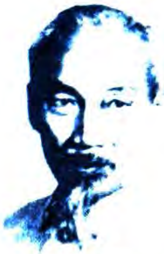
Расми 39. Хо Ши Мин (1890-1969), Раиси Ҳукумати Муваққатии ҶДВ

26 апрели соли 1954, бо ташаббуси ИҶШС, дар Женев, Маҷлиси манъаратии вазирони қорҳои қоричии ИҶШС, ҶНҶ, Британияи Кабир ва ИМА