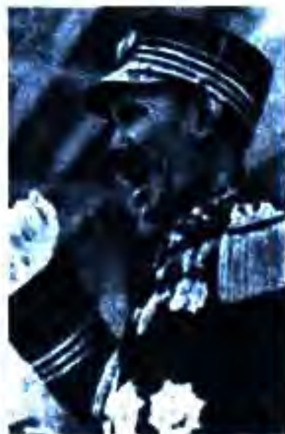
Расми 34. Сарвари «Гоминдан» Чан Кай-ши (1887-1979)

Дар аввали ҷанги дохилӣ ин ду нерӯ тавассути миёнравии ИМА майли муҳолифатро ба маҷрои оштии ва мусолиҳа даровардан доштанд. Бо ин мақсад музокироти онҳо 28 августи соли 1945 дар Чунсин оғоз ёфта, он бо қабули изҳороти муштаракӣ тарафҳои даргир чамъбаст карда шуд. Дар изҳороти мазкур дар бораи таъҷилан даъват карда шудани Маҷлиси машваратии нерӯҳои сиёсӣи Чин эҳду паймон карда шуд. Дар Маҷлиси машваратии вазирони корҳои хориҷии се давлат - ИМА, Англия ва ИҶШС, ки моҳи декабри соли 1945 дар шаҳри Маскав баргузор гардид, низ роҳи осоиштаи катъи ҷанги дохилии Чин дастгирӣ карда шуд. Моҳи январи соли 1946 Конфронси машваратии сиёсӣи намоёнлагони ҳаман хизбҳои сиёсӣ ва арбобони беҳизбии Чин баргузор гардид. Гарчанде ки онҳо дар ин конфронс нақшаи роҳи осоиштаи муттаҳидкунии Чинро кашиданд, вале он иҷро нашуд. Амалиётҳои ҷангӣ ҳатто дар тӯли кори конфронс ҳам катъ нагардиданд. Гузашта аз ин, баъди конфронс дар Чин ҷанги дохилӣ бо қувваи дахчанд суръат гирифт.