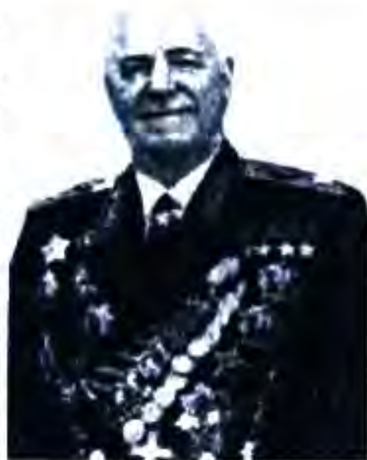
Расми 31. Георгий Константинович Жуков (1896-1974)

Таъқиботи Сталин соҳаҳои алоҳидаи ҳизбро низ дар бар гирифт. Масалан, қариб тамоми соҳаҳои ҳизби Ленинград ҳабс карда шуд. Аз рӯи "парвандаи Ленинград" наздики 2000 нафар ба ҷавобгарии ҷиноятии қашиданд, аз он ҷумла, Раиси Шӯрои Вазирони Русия А. Родионов, узви Бюрои Сиёсӣ ва Раиси Госплани ИҶШС И. Вознесенский, Қотиби КМ ВКП (б) А. Кузнецов. Аз рӯи "парвандаи табибон" соли 1953 гурӯҳи қалони табибон гӯё барои нодуруст таъобат қардани роҳбарони