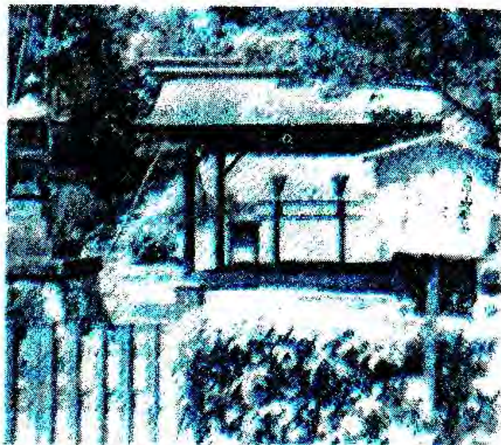
Расми 46. Тсузияма Фудзи, яке аз муқаддасоти Аябэ (Чопон).

Бо шартҳои мазкур ба имзо расидани созишномаи сулҳи Сан-Франсиско дар байни роҳбарияти Ҳизби Сотсиалистии Чопон муҳолифатро ба вуҷуд овард. Дар натиҷа ин ҳизб ба ду ҳизби мустакил тақсим шуд. Онҳо ба иттифокҳои касабавӣ сернуфузтарини Чопон - Соҳиё таъя мекарданд. Соҳиё талаб кард, ки қарордодҳо ва созишномаҳои ҳарбии бо ИМА ба имзорасида аз эътибор соқит карда ва пойгоҳҳои ҳарбии Амрико дар Чопон барҳам дода шаванд.