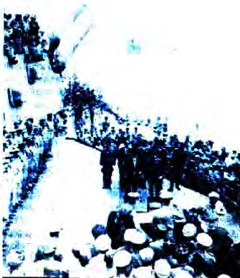
Рисми 44 Имзои эълония дар бораи таслимшавии Чопон дар сахми киштии қарбии «Миссури» (2 сентябри соли 1945).

Дар шароити ишғоли ва аз ҳукумати Носиди норозӣ будани мардум мохи апрели соли 1947 дар Чопон интихоботи парлумонӣ доир гардид, ки дар он Ҳизби Сотсиалистӣ ғалибӣ кард. Ҳукумати энтитофиян яқчанд хизби дар интихобот иштироккарда бо сардории Катаяма Тэсу ташкил карда шуд. Ин ҳукумат вазъи иқтисодиро иҷтимоии Чопонро беҳтар карда натавоиест. Бинобар ҳамин сабаб ба истеъфо рафт. Бо қои он бо сардории роҳбари Ҳизби Демократӣ Носиди ҳукумати явни энтитофиян ташкил ёфт. Аз рӯи нишондодди ҳокимияти ишғоли ИМА Носиди корпартии коргарону хизматчиёни корхонаҳои давлатиро мамнӯъ эълон кард.