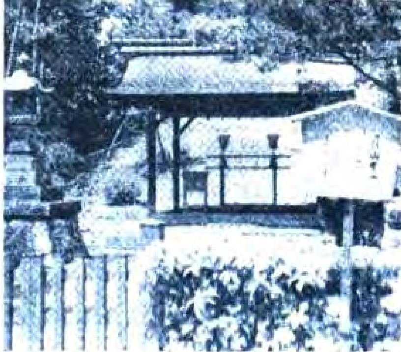
Расми 46. Тсузинма Фудзи, яке аз муқаддасоти Ляо (Ҷопон)

Бе шартҳои мазкур ба имзо расидани созишномаи сулҳи Сан-Франсиско дар байни роҳбарияти Хизби Сотсиаллестини Ҷопон муҳалифатро ба вуҷуд овард. Дар натиҷа ин ҳизб ба ҳукумати мустиқил тақсим шуд. Онҳо ба интифокҳои касабии сернуфузирини Ҷопон – Соҳиё таъсия мекарданд. Соҳиё талаб кард, ки Ҷопонро ҳамакҷа созишномаҳои ҳарбии бо ИМА ба имзорасида аз ҷиҳати сикоти карда ва ҷойгоҳҳои ҳарбии Амрико дар Ҷопон барҳам дода шаванд.