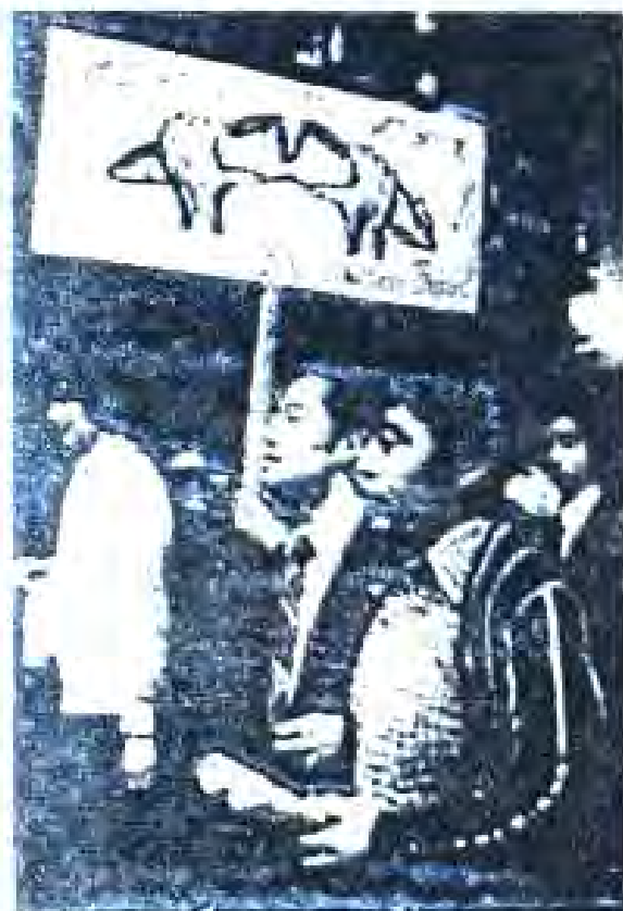
Рисми 45. Ҷопониро муқобили ҷанг будани худро иброз медоранд.

Амрико буданд. Ислохоти маъ-кур бо назардошти 3 омида ба амал баровардан мешуд.