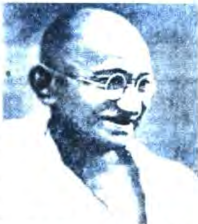
Расми 49. Муҳандас Карамчанд Ганди (1869-1948).

Дар баробари ин, дар Ҳиндустон нерӯҳои камнуморе ҳам арзи аҷуд доштанд, ки ҷонибдори дар ҳолати мустамликавӣ мондани Ҳиндустон буданд. Дар байни онҳо заминдорони қалон, баъзе ашрофони ва як қисми буржуазияи қоморидор