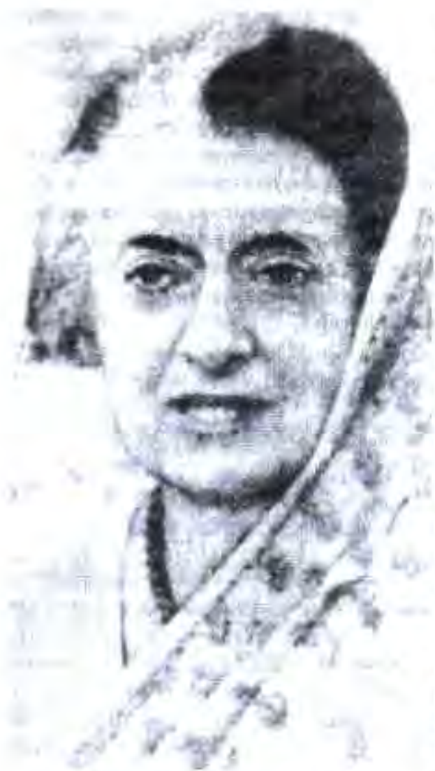
Расми 53. Индира Ганди.

иктисод ва иҷтимоӣ Ҳиндустон қабул карда шуд, ки дар он ба кишоварзӣ ва сохтмони инфраструктураи обёрно энергетикӣ диққати калон дода шуда буд. Иҷрои ин барнома иқтисоди Ҳиндустонро то як дараҷа пеш бурд. Соли 1966 парламони Ҳиндустон барномаи 5-солаи дуюми рушди иқтисодию иҷтимоии Ҳиндустонро қабул кард. Дар он вазифаи аввалиндараҷа сохтани корхонаҳои давлатии саноати вазнин дар назар дошта шуда буд. Дар натиҷаи иҷрои нишондиҳандаҳои барномаи ин 5-сола роҳҳои охани нав сохта шуданд, хатҳои сайри хавопаймоҳо зиёд шуд, саноати ҳарбӣ, ҳастай, мошинсозии вазнин, электроэнергетика, саноати ангишт ва нафт ба сектори давлатӣ дохил карда шуданд. Ҳукумат ниҳат дошт, ки давлат дар бунёди саноати арзиз, себобҳои коркарди маъдан, истеҳсоли катрон, коғаз, нақлиёти автомобилӣ ва баҳрӣ, истеҳсоли ашёи хоми кимиёвӣ бештар саҳм бигирад. Соҳаҳои дигари саноати Ҳиндустон, ки дар ихтиёри сектори хусусӣ буданд, фаъолияти худро дар зери назорати давлат пеш мебуданд.