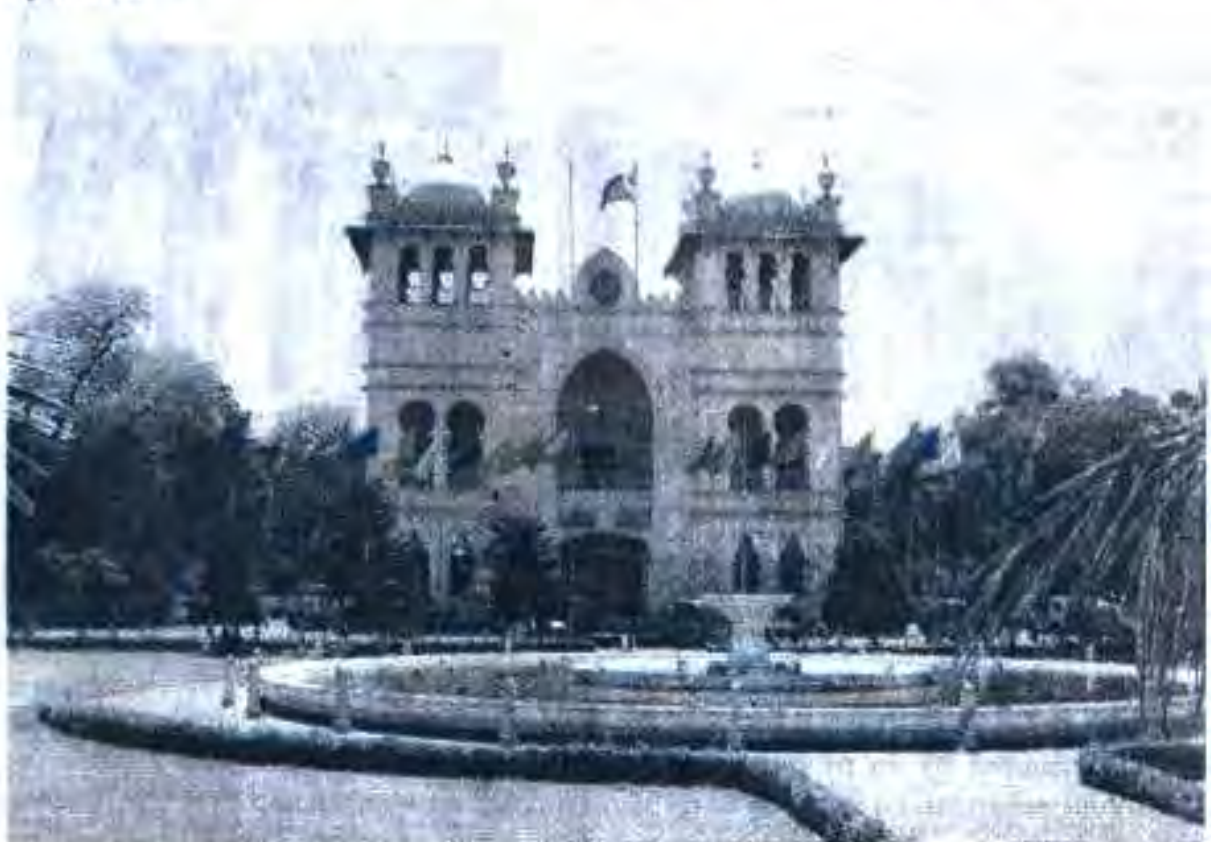
Расми 55. Осорхонаи ба номи Муҳаммадали Чиноҳ дар Лоҳур (музофоти Панҷоб).

Ҳуллаас, иқтисоди Покистон дар ҳолати заифӣ қарор дошт. Ҳукумат ҷидду ҷаҳд ба харҷ медод, ки онро рушд бахшад, ва манфиатҳои миллӣ мувофиқ кунонад.