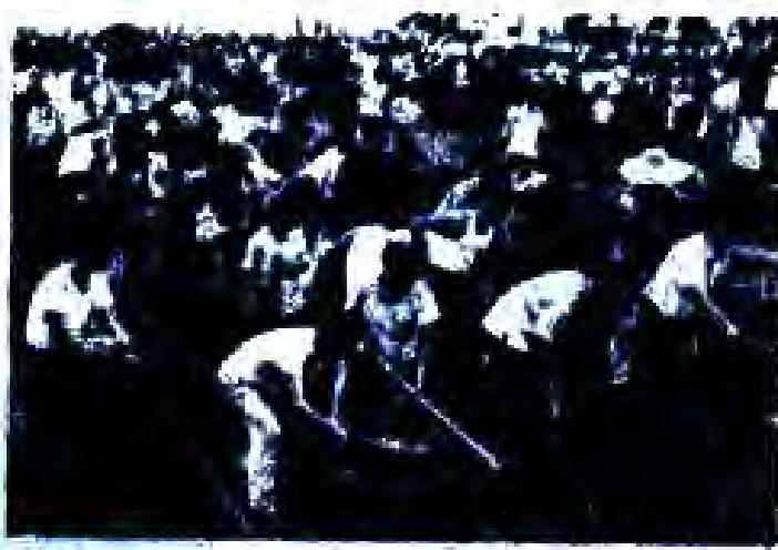
Рисми 38. Чавонсоне, ки дар натиҷаи «Инқилоби маданӣ» аз шахр ба деҳа барои тарбия фиристониде шудаанд.

Ҳамин тарих, ба Мао Тзе-дун мунссар гардид, ки рақибони сиёсӣ ва ҳаман онҳоеро, ки гуё ба ақидаи ӯ ба сохтмони сотсиализми модели нави пешниҳодкардааш ҳақил мерасониданд, маҳв кунад. "Хунвэйбинҳо" ва "тезаофанҳо" миллионҳо нафар роҳбарони знахон гуногуни роҳбарии хизбию давлатӣ ва арбобони илму фарҳангро барои "тарбия" ба деҳот фиристониданд. Теъдоди хеле зиёди ин одамон қатл карда шуданд. Дар "инқилоби маданӣ" қариб 20 миллион нафар чиниҳо ҳалок гардидаанд.