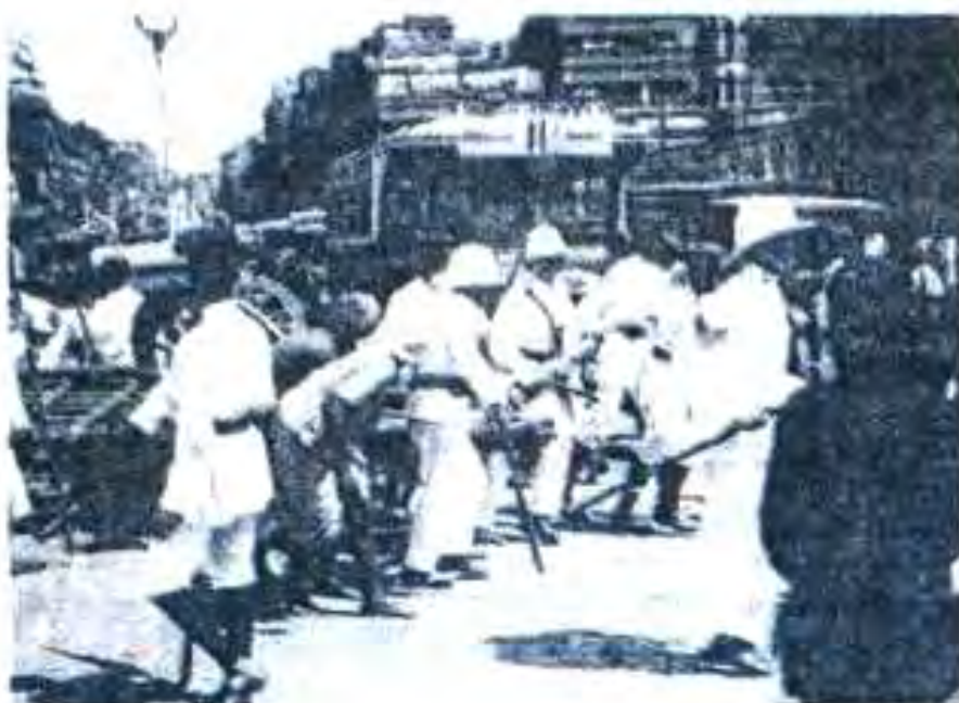
Расми 51. Ватандӯстони Ҳиндустон ба мустамликадорон муқовимат мекунанд

• 30 январӣ соли 1948 М.К. Ганди 70-сола аз тарафи ҷамоаи динию миллатгаро ба қатл расонид шуд.