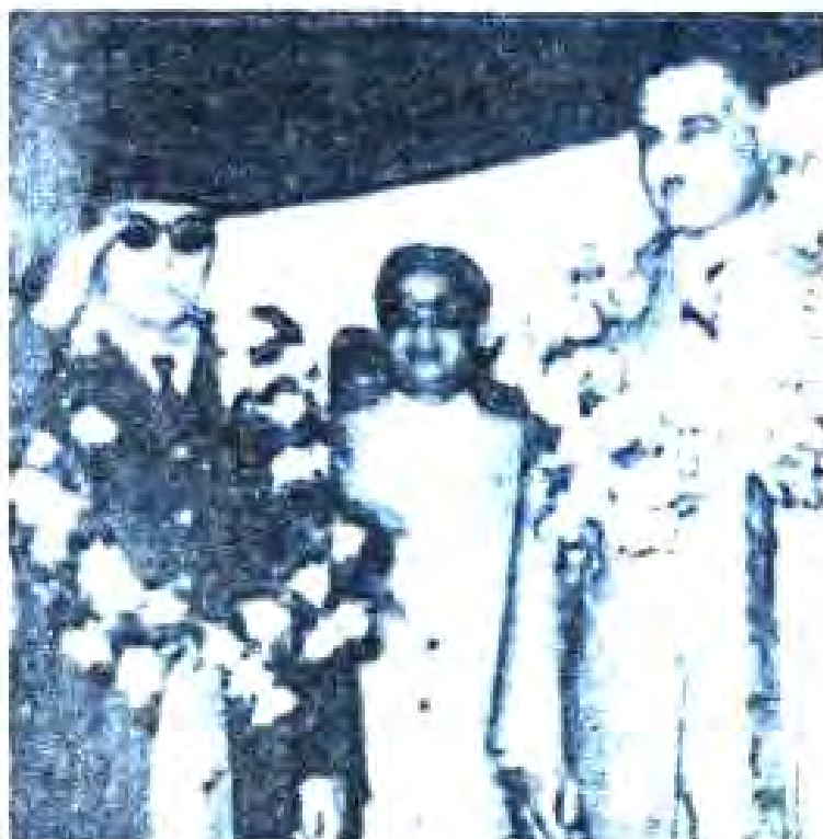
Расми 47 Президенти Индонезия Сукарно ва президенти Миср Ҷамол Абдулносир.

Муборизаи ҳалли Индонезия аз ғарафи номеди тарикқиҳои ҷаҳон дастгирӣ карда шуд. Тачовузи ҳарбии Англияю Ғолландия ба Индонезия дар СММ маърифи баррасӣ қарор гирифт. Аз ин рӯ, Англия моҳи ноябри соли 1946 маҷбур шуд, ки артиши худро аз Индонезия бароранд. Ғолландиҳо инч маҷбур шуданд, ки бо намоишгоҳи Индонезия шев мизи мутоварот нишонанд. Дар маҳаллаи Линчаот байни Ғолландия ва Индонезия созишнома ба имзо расид. Мувофиқи шартҳои созишномаи байни Ғолландия ва Индонезия бастаншуд. Ғолландия ҳокимияти Ҷумҳурии Индо-незияро дар Ява, Суматра ва Мадуро эътироф намуд. Индонезия маҷбур шуд, ки ҳақшоназирии ҳуқуқ ба моликияти хориҷӣро дар Индонезия эътироф намояд. Созишномаи Линчаот шартҳои вазнин дошта бонад ҳам, ба Ҷумҳурии Индонезия фурсати дамириӣ медод. Мустантикадорон созишномани мазкурро ҳамоқун роҳ ба сӯи поракунии Индонезия медонистанд. Оқо дар Индонезияи Шарқӣ, Калимантана, Суматра ва Мадуро давлатҳои хурд-хурдзаткил шимуданд. Мустантикадорон дар Индонезия шумораи артиши худро ифозин дод, ба 120 ҳазор нафар расониданд. Дар ихтиёри артиши Ғолландия ҳавонаймҳо, танкҳо ва елҳои ӯганифинион мавҷуд буданд. Бо мақсади танқизи бархӯрдҳои нави ҳарбӣ голландиҳо таъаб карданд, ки шумораи голландиро барои нигоҳдорани тартибот ба Индонезия дароранд. Ҳукумати Индонезия ин талаби голландиҳоро қатъан рад кард.