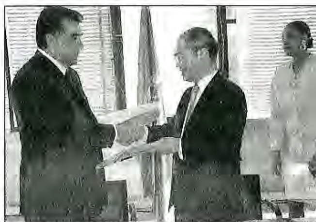
Дабири Кулли ЮНЕСКО Коичиро Матсуура ба Президент Э.Ш. Раҳмонов медали тиллоӣ супурда истодааст. Париж, октябри 2005с.

Соли 2005-ум санъаткорони ҷумҳурӣ дар Россия, Япония ва хусусан дар Париж ба муносибати Рӯзи Тоҷикистон дар ЮНЕСКО хунарнамоӣ карда, ҳамаро мафтун гардониданд. Ҷумҳурии соҳибистиклоли Тоҷикистон тасмим гирифтааст мунтазам дар ҷорабиниҳои фарҳангии байналхалқӣ иштирок намуда, саҳми арзандаи худро дар минбаъд мустақкам шудани дӯстии байни халқҳо ва пойдории сулҳ дар рӯи замин гузорад.