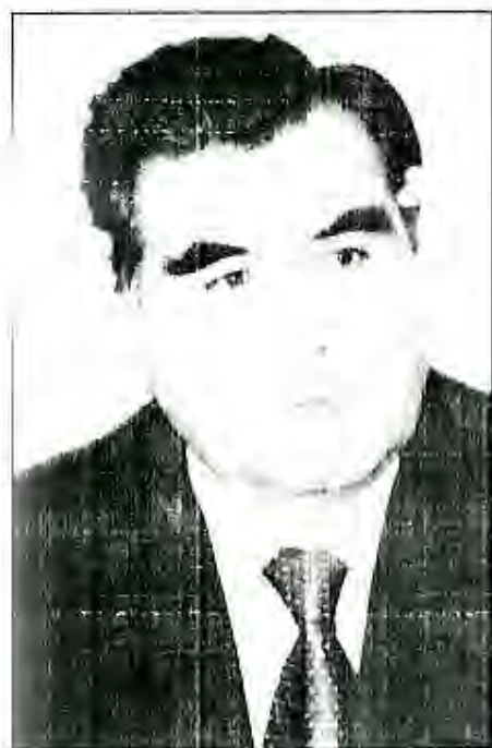
Қаҳрамони Тоҷикистон, Президенти Ҷумҳурии Эмомалӣ Раҳмонов