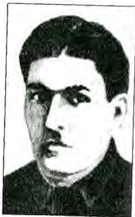
Қаҳрамони Тоҷикистон, Шириншоҳ Шохтемур

Бо Фармони Президенти Ҷумҳурии Тоҷикистон Э.Ш.Раҳмонов аз 27 юни соли 2006 Шириншоҳ Шохтемур фарзанди барӯманди халқи тоҷик барои фаъолияти бунёдкоронаи давлатдорӣ ва хизматҳои бузург дар поягузориҳои истиқлолияти давлатии Ҷумҳурии Тоҷикистон бо унвони оли «Қаҳрамони Тоҷикистон» сарфароз гардид.