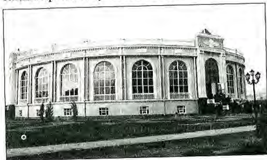
Бинои амфитеатр дар Душанбе

Идораҳои фарҳангиву муассисаҳои театрию концертӣ озмунҳои умумиҷумҳуриявӣ муқрибони эстрадӣ, шашмақомхонон, фалаксароёнро гузаронида дар тарбияи эстетикӣ насли наврас сахми босазо гузошта истодаанд. Ҷашнгирии маърақаҳои солинавӣ, Наврӯз, Иди занон, Артиши миллӣ, рӯзи Ваҳдати миллӣ, ҷашни Ғалаба, иди Истиқлолият ва ғайра пурмазmun ва дар дараҷаи баланди бадеӣ гузаронида мешаванд. Хусусан, дар сатҳи баланд гузаронидани Фестивал – озмуни театрҳои касбӣ ва студияҳои драматикӣ «Парасту» дар тарбияи шаҳрвандонамон сахми арзанда гузошта истодаанд.