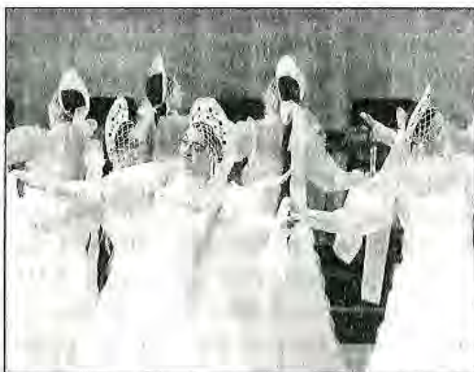
Ансамбли «Зебо». Рӯзи Тоҷикистон дар ЮНЕСКО, Париж, октябри 2005с.

Солҳои соҳибистиклолӣ ҳунарпешагони касбӣ ва фолклорию этнографии Тоҷикистон низ санъати волои худро дар кишварҳои ҷаҳон намоиш додаанд. Ансамбли «Лола» ҳунари хешро дар сатҳи баланд ба тамошоби-