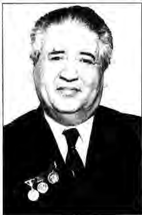
Қаҳрамони Тоҷикистон, академик, Шоири халқии Тоҷикистон Мирзо Турсунзода

Мирзо Турсунзода 2 майи соли 1911 дар деҳаи Қаратоғ таваллуд ёфта, 24 сентябри соли 1977 вафот кардааст. Ӯ пас аз хатми дорулмуаллимини Тошканд (с. 1930) дар вазифаҳои гуногун: рӯзноманигор, мутасаддӣ соҳаи адабиёту санъати ҷумҳурӣ ва солҳои тӯлонӣ раиси Правлениаи Иттифоқи нависандагони Тоҷикистонро ба ӯҳда дошт.