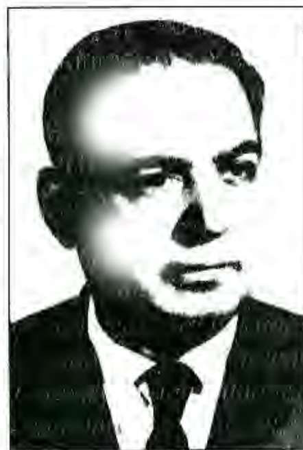
Қаҳрамони Тоҷикистон, академик Бобоҷон Ғафуров

Ғаъолияти илмӣ-эҷодии Б. Ғафуров дар шароите оғоз гардид, ки дар афкори ҷамъиятӣ бояд исбот карда мешуд, ки халқи тоҷик бо меҳнати шоёнаш дар тамаддун аз давраҳои қадим маълум ва машҳур аст. Бинобар он академик Б. Ғафуров чун фарзанди фарзонаи миллат, дар назди худ вазифа гузошт, ки дар асоси сарчашмаҳои инқорнашаванда маҳкем халқи хешро дар