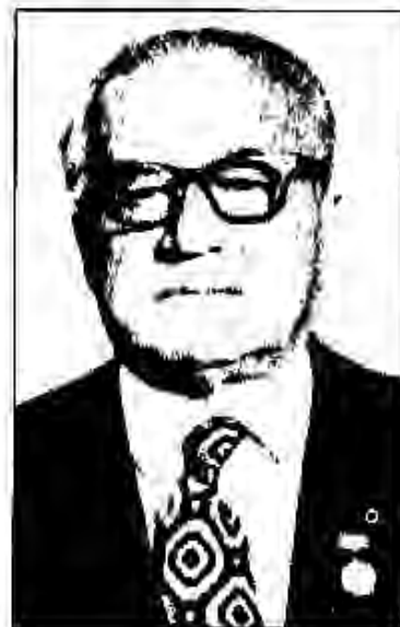
Аввалин ректори Донишгоҳи давлатии миллии Тоҷикистон, академик З.Ш. Рачабов

Санъаткорони ҷумҳурӣ низ кори пурсамари эҷодӣ намуда, табиӣ мардумро шод гардонида, сатҳи эстетикӣ шаҳрвандонамонро хело баланд бардоштанд. Театри опера ва балет соли 1947 балети С. Баласанян «Лайлӣ ва Мачнун»-ро ба сахна