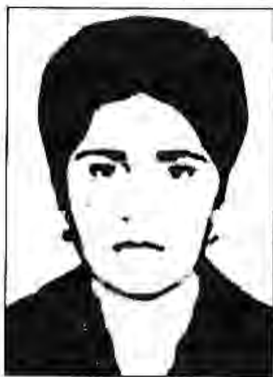
Механизатор, Қаҳрамони Меҳнати Сотсиалистӣ Гавҳар Пиракова

Барои васеъ ва ҳаматарафа ба кори механизаторӣ ҷалб намудани духтарон комсомоли Тоҷикистон мукофоти ба номи Зайнаб-биби қаҳрамонро, ки ҷонашро барои барпо кардани Ҳокимияти Шуравӣ дар ҷумхурӣ нисор кардааст, таъсис намуд. Бо ин мукофот духтарон-ғолибони мусобиқаи байни механик-ронандагон, ки дар ҷамъоварии пахта натиҷаҳои аз ҳама хуб ба даст овардаанд, мукофотонида шуданд.