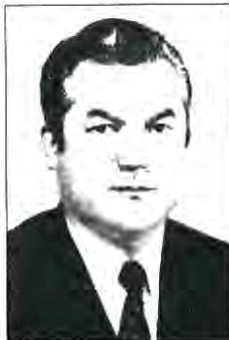
Ходими давлатию ҷамъиятӣ Раҳмон Набиев

Ҳарчанд ба вазифаи Раиси Шӯрои Олии Раҳмон Набиев интихоб шуда 2 , баҳри аз байн нарафтани Ҷумҳурии соҳибистиклол роҳи мусолиҳаро пеш гирифта бошад ҳам, аммо гирдиҳамоиҳои ғайриқонунӣ авзои мамлакатро то рафт ноором мегардонданд. Вазъият чунон мураккаб гардид, ки Р. Набиев маҷбур шуд дар арафаи интихоботи президентӣ ваколатҳои Раиси Шӯрои Олиро боз дорад. Ва ниҳоят 24 ноябри соли 1991 ба таври умумихалқӣ Р. Набиев президенти мамлакат интихоб шуд. Аммо дар ҷумҳурӣ, хусусан дар сохтори болои, дар Парлумон ва Ҳукумат се гурӯҳи гуногун ташаккул ёфта буд. Гурӯҳи аввал – онҳое, ки адои вазифа доштанд, гурӯҳи дуюм – тақия ба умеду дастгирии қувваҳои беруна ва самаранок истифода бурдани тарзи зӯрварӣ мекарданд; гурӯҳи сеюм – онҳое, ки мавқеи бетарафиро пеш гирифта, интизори ғолиб гаштани қувваҳои му-