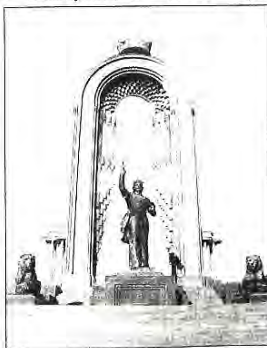
Муҷассамаи Исмоили Сомонӣ дар ш. Душанбе

Сониян, ҳаёти сиёсӣ ва маънавии ҷумхури низ хеле муташанҷ гардид. Пеш аз ҳама мубориза барои ҳокимият, мансаб, ки дар байни ҳизбу созмонҳо ва шахсиятҳои алоҳида ханӯз аз замони бозсозӣ оғоз ёфта, баъд аз воқеаҳои нохуши моҳи феврари соли 1990 хеле тезу тунд гардид. Аз як тараф бай-