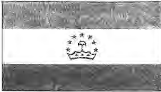
Парчами Давлатии Тоҷикистон

Парчами давлатии Тоҷикистон рамзи истиқлолияти давлатии Ҷумҳурии Тоҷикистон, иттиҳоди вайроннашавандаи коргару деҳқон ва зиёиён, дӯстиву бародарии ҳамаи миллатҳои сокини ҷумҳурӣ мебошад.