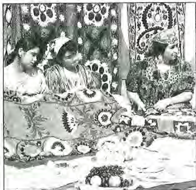
Духтарон ҳангоми сӯзанидӯзӣ

Бо тӯфайли соҳибистиклолгардидани Ҷумҳурии Тоҷикистон торафт саноати маҳаллӣ, хусусан ҳунароҳои халқӣ инкишоф ёфта истодааст. Дар намоишгоҳҳои ҷумҳурӣ ва байналхалқӣ шаҳрвандонамон маҳсулоти истеҳсол кардашон: сӯзанӣ, бозичаҳои аз гил сохташуда, кулоҳҳои тоҷикӣ, ҷуробҳои пашмин, матоҳҳои атлас, кандакорӣ ва ғайраро пешниҳод намуда, бо ҷоизаҳо мушарраф мегарданд.