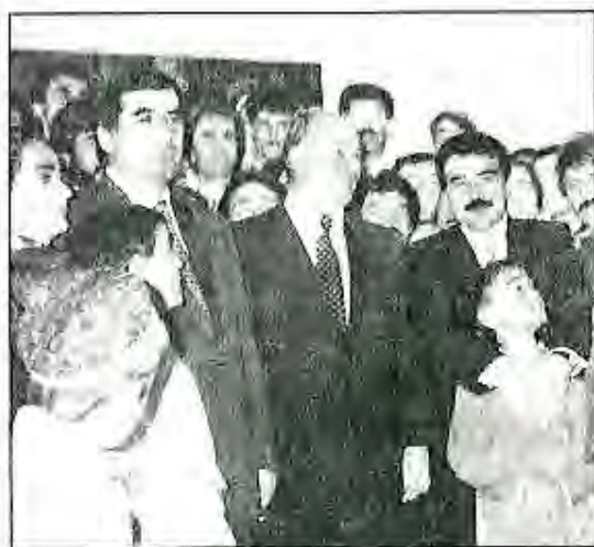
Президент Э.Ш. Раҳмонов бо Аълоҳазрат Ҳизиримом Огоҳони IV

Дар навбати худ Тоҷикистон барои пешрафти саноати металҳои ранга, кимё (алюминий, сурб, рух, симоб) ва бофандагии Россия кӯмаки амалӣ мерасонад. Аз Россия бошад Тоҷикистон барои комплекси агросаноатии худ мошинаҳо, трансформаторҳои пуриктидор, таҷҳизоти технологӣ гирифта истодааст.