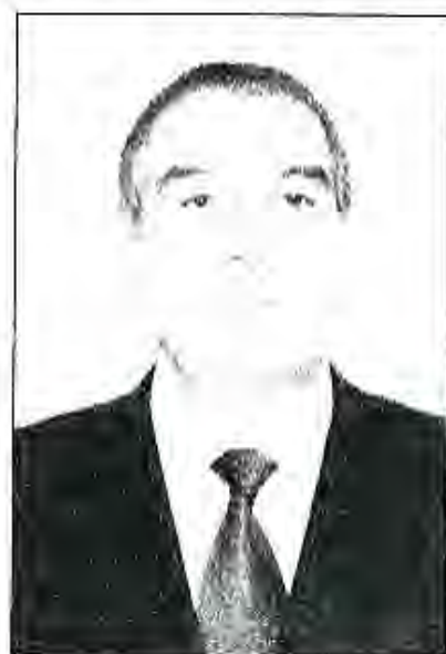
Раиси Маҷлиси намояндагони Маҷлиси Олии Ҷумҳурии Тоҷикистон Сайдулло Хайруллоев

Мувофиқи Конститутсия ва қонуни фармонҳои қабул гардида, дар мамлакат