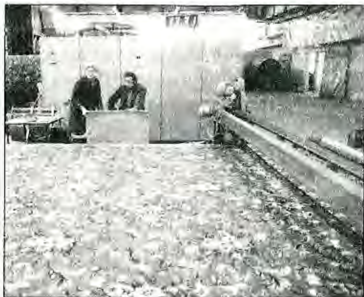
Комбинати қолнибофии Қайроққум

Азбаски ханӯз саноати ҷумхурӣ талаботи аҳолиро бо маҳсулоти гуногуни балансеифат таъмин карда наметавонад, бинобар он воридоти молҳои саноати сабук ва хӯрокворӣ ба Ҷумҳурии Тоҷикистон зиёд шуда истодааст. Агар ҳаҷми умумии воридот дар соли 1991 – 63,2 миллион долларро ташкил диҳад, пас соли 2004 вай ба 1 миллиарду 191,3 миллион доллар расид.