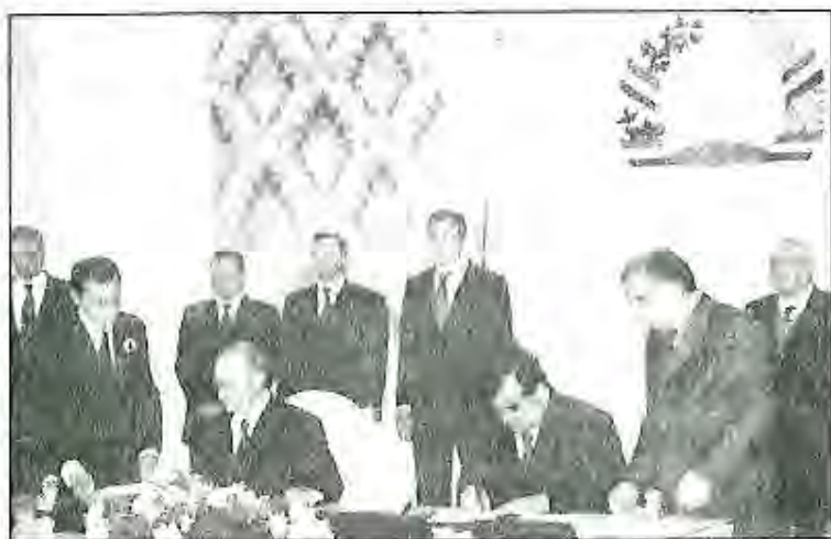
Президенти Ҷумҳурии Тоҷикистон Эмомалӣ Раҳмонов ва Президенти Федератсияи Россия Владимир Путин дар маросими расмӣ имзои созишномаҳои дучониба

Барои инкишофи саноати калон Ҷумҳурии Тоҷикистон ба сармоягузорию инвестицияҳои хориҷӣ мӯҳтоҷ аст. Соли 2005 захираи умумии сармоягузорию амалкунандаи хориҷӣ, ки дар Тоҷикистон азхуд карда мешавад, 1 миллиарду 400 миллион сомониро ташкил дод. Дар натиҷаи пеш гирифтани сиёсати дурусти хориҷӣ Тоҷикистон имконият пайдо карда истодааст, ки саноат, алалхусус корҳои сохтмониро ривоч диҳад. Дар айни ҳол Россия барои корхонаҳои калон, аз ҷумла сохтмони ГЭС-ҳои Роғун, Сангтӯда, заводи алюминий дар водии Вахш ва дигар объектҳои саноатӣ: кимё, металлургия, мошинсозии Тоҷикистон маблағҳои калон ҷудо карда, аз соли 2006-ум сар карда, суръати корро афзун хоҳад кард.