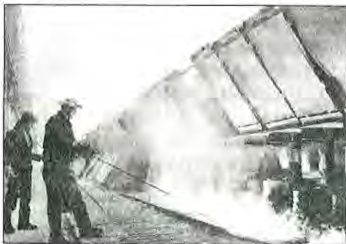
Заводи алюминии шаҳри Турсунзода. Сехи электролизӣ

Ба кор даромадани чандин корхонаҳои муштараки саноатӣ, аз ҷумла «Абрешим» бо Италия, «Кабоол-Тоҷиктекстайл» бо Корея, «ВТ-Силк» бо Вьетнам ва ғайра, ки маҳсулоти ба талабо-