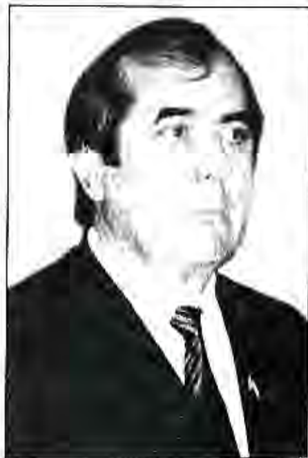
Раиси Маҷлиси миллии Маҷлиси Олии Ҷумҳурии Тоҷикистон Маҳмадсаид Убайдуллоев

Аз рӯзҳои аввали таъсисёбии Маҷлиси миллий Маҷлиси Олӣ вай ба яке аз рухҳои бозғайимии мақоми қонунгузори мамлакатамон табдил ёфтааст. Танҳо дар байни солҳои 2000 – 2005-ум чандин қонунҳои муҳимро қабул намудааст. Аз ҷумла: Қонуни Ҷумҳурии Тоҷикистон «Дар бораи тибқи халқӣ», «Дар бораи истифодаи энергияи атомӣ», «Дар бораи ворид