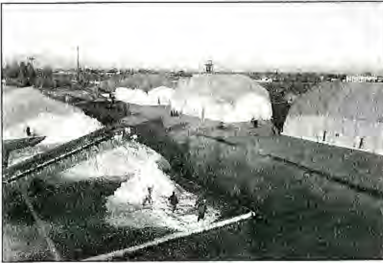
Тойҳои пахта дар вилояти Хатлон 9

хоҷагидорӣ сол аз сол зиёд шуда, ҳавасмандии деҳқонро таъмин карда истодааст.