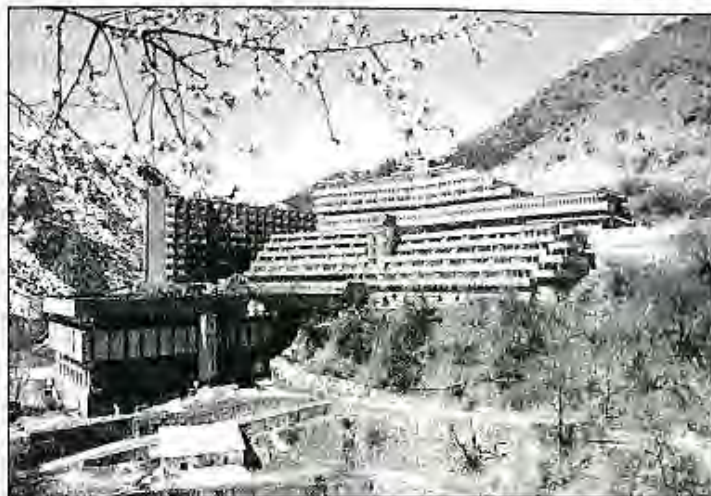
Истироҳатгоҳи Хоҷа-Оби гарм

Дар моддаи 38 Конститутсияи ҷумҳурӣ чунин омадааст: «Ҳар як шахс ҳуқуқи ҳифзи саломатӣ дорад. Шахс дар доираи муқаррарнамудаи қонун аз ёрии тиббии роӣгон дар муассисаҳои ниғаҳдории тандурустии давлатӣ истифода менамояд. Давлат барои солимгардонии муҳити зист, инкишофи омавии варзиш, тарбияи ҷисмонӣ ва туризм тадбирҳо меандешад.