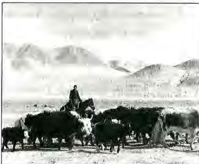
Ғаллаи кутосҳо дар ҷароғоҳи Мурғоб

Барои пешрафти кишоварзӣ дар ҷумҳурӣ рӯз аз рӯз тадбирҳои судманд андешида мешаванд. Бо туфайли пеш гирифтани сиёсати хирадмандона Ҳукумати Тоҷикистон тавонист инвеститсияҳои мамлакатҳои хориҷии дуру наздикро ба эҳё ва инкишофи кишоварзӣ ҷалб намояд. Дар ин бора инкишофи фаъолияти хоҷагиҳои деҳқонии (фермерии) ноҳияҳои кӯҳистони ҷумҳуриҳои ҳамон шаҳодат медиҳад. Масалан, Агроаксияи Германия кишоварзии водии Зарафшонро ба шефӣ гирифта, дар ноҳияи Кӯҳистони Мастҷоҳ истеҳсоли картошка, ғаллаи