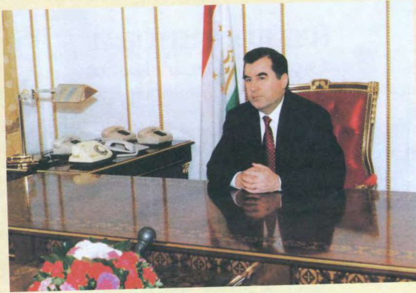
ПРЕЗИДЕНТИ ҶУМҲУРИИ ТОҶИКИСТОН ЭМОМАЛӢ РАҲМОҶОНОВ