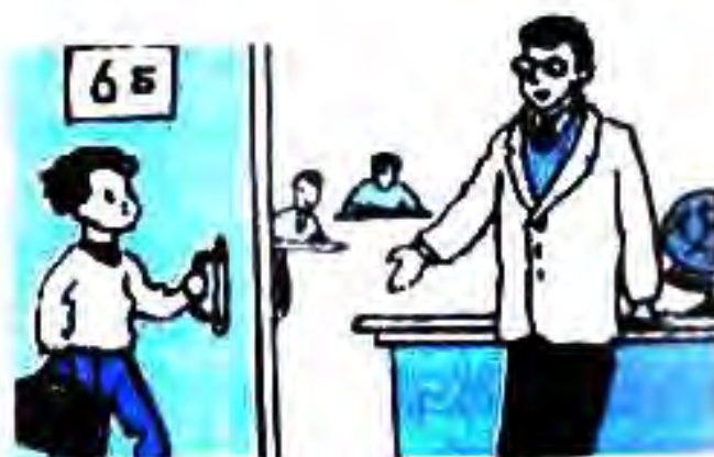
Коля вошёл в класс и взял книгу.