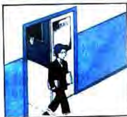
Учитель вышел из класса.