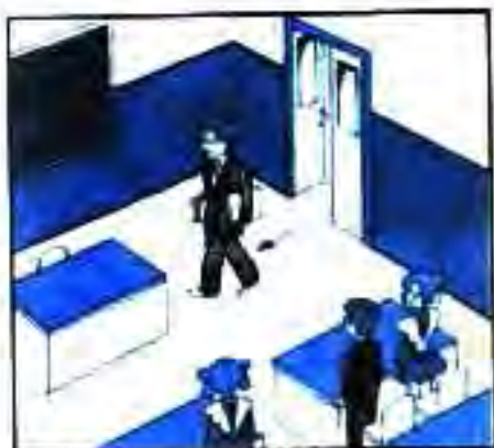
Учитель вошёл в класс.