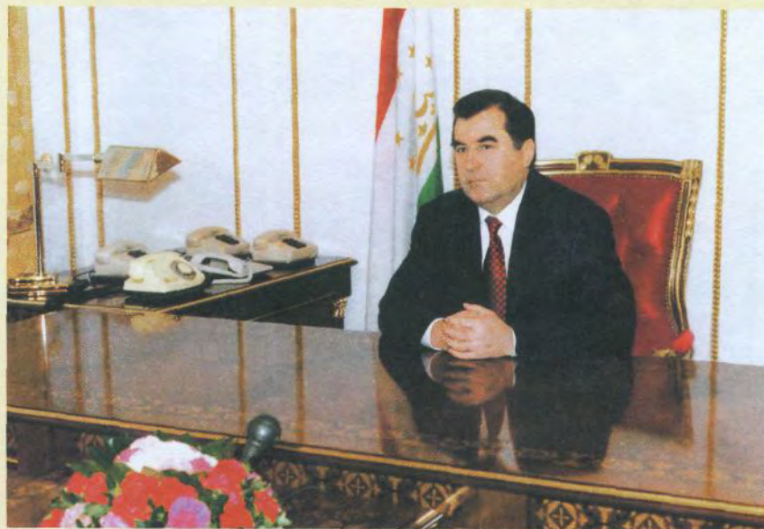
ПРЕЗИДЕНТИ ҶУМҲУРИИ ТОҶИКИСТОН ЭМОМАЛӢ РАҲМОҶОВ