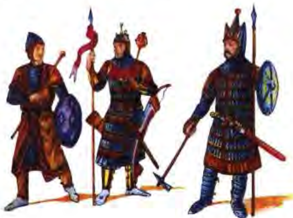
Расми 8. Сару либоси сарбозони суғдиҳои асрҳои VI-VIII.

ДУ ТАҚСИМ ШУДАНИ ҲОҚОНИИ ТУРК. Дар натиҷаи ҷангҳои тӯлонӣ Ҳоконии Турк таназзул кард. Дар мамлакат ҳаракати ҷудоӣҳои пурзӯр шуд. Вазъият чунон тезу тунд буд, ки ба ду давлат тақсим шудани Ҳоконии Турк ногузир гардид. Ҳамин тариқ, солҳои 600–603 ин давлат ба Ҳоконии Шарқии Турк ва Ҳоконии Ғарбии Турк тақсим шуд. Осиёи Марказӣ дар