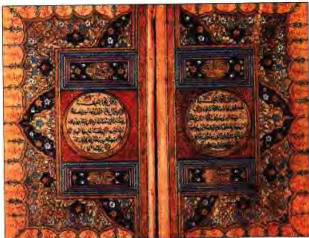
Расми 26. Саҳифаҳо аз Қуръон.

Арабҳо лашкари Византияро бо фиреб ба дом афтонданд. Пас аз наздикшавии лашкарҳои Византия, арабҳо Димишк ва шаҳри минтақаҳои дар ин ҷо ишғолкардашонро тарк карда, ба самти дарёи Ярмуки, яке аз шохобҳои дарёи Урдун ақибнишинӣ карданд. Дар ҳамин ҷо 20 августи соли 636 задухӯрди халқунандаи арабҳою византиягӣҳо доир гардид, ки дар он