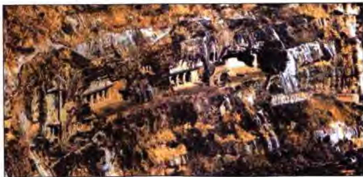
Расми 13. Ибодатгоҳи дар гори мавзеи Аҷанта кандашуда. Асрҳои V-VI.

АДАБИЁТ. Адабиёти давраи Гуптҳои Ҳиндустон бо адибони барҷастааш машҳур аст. Дар байни онҳо шоир Калидаса ҳам буд. Ӯ дар охири асри IV – аввали асри V ҳаёт ба сар бурдааст. Калидаса муаллифи якчанд достони калони қаҳрамонӣ ва драмаи асотириро таърихӣ будааст. Драмаи "Шакунталаи эътирофшуда" аз беҳтарин асари Калидаса буда, дар он образи зани ҳиндӯе инъикос ёфтааст, ки ҳамагуна монеаҳои сари роҳашро бартараф карда, ба мақсадҳои инсонияш расида тавонидааст. Ин асар дар Фарб танҳо соли 1789 маълум гардида, таваҷҷӯҳи мардуми