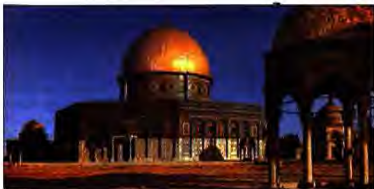
Расми 35. Масҷиди Умар – "Кубат-ас-Саҳро".

Аз куштори Аббос Абӯмуслим ҳам начот ёфта натавонист. Ба ҷои он ки ба Абӯмуслим барои шикаст додани Марвони II миннатдорӣ изҳор кунад, халифаи нав ӯро ба зиндон партофта, баъди ҷанде қатл кард.