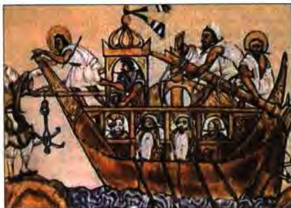
Расми 31. Киишти арабҳо ҳангоми ҳуҷум.

Халифаҳои Уммавиёнро одатан ба ду шоҳаи ҳешу табор тақсим мекунанд. Яке аз онҳоро Суфияҳо меномиданд, ки ин унвонашон аз номи падари Муовияи I бармеояд. Ба ин шоҳаи Муовия, писари ӯ – Язиди I ва набераи ӯ – Муовияи II дохиланд. Шоҳаи дуюм, ки Суфияҳоро дар тахту тоҷи хилофат иваз