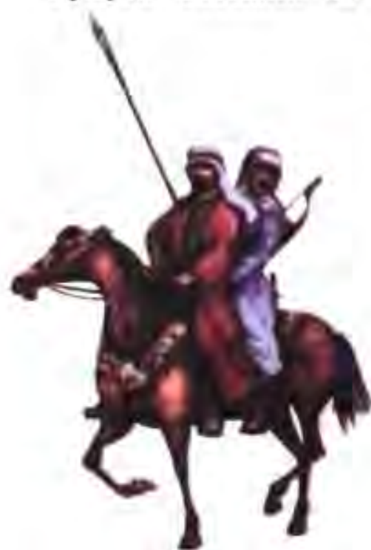
Раёми 27. Сарбозони араб.

Мухорибаҳои арабҳо дар Ироқ бо лашкарҳои Сосониёни Эрон ба амал омаданд. Ҳангоми ишголи шаҳри Хира арабҳо аз лашкари Сосониён якчанд маротиба шикаст хурда, маҷбур шуданд, ки ақибнишинӣ кунанд. Сарбозони арабро филҳои ҷангии эрониён ба даҳшат оварданд. Арабҳо дар ин ҷо эрониро шикаст доданд. Вале дар охири соли 635 бар Сосониён пирӯз гаштанд. Соли оянда арабҳо дар мухорибаи Кадисия лашкари бузурги Сосониёро торумор намуданд. Баъди ин галаба роҳи арабҳо ба сӯи пойтахти Сосониён – Тайсафун, ки онро аз сабаби зебоияш Мадоин ном мебарданд, кушода шуд. Сокинони он дарвозаҳои шаҳро ба рӯи арабҳо боз карданд. Қӯшуни Сосониён ба зарбаҳои ҳалокатбори арабҳо тоб