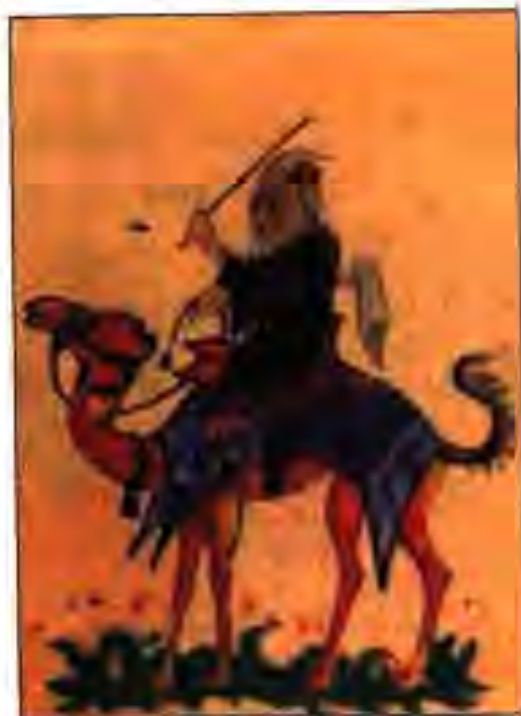
Расми 24. Араби уштурсавор. Тасвир дар девори сангини Арабистони Ҷанубӣ.

Халифа Абӯбакр шаҳри Мадинаро пойтахти Хилофат эълон кард. Маҳз бо ҳамин сабаб ин давлатро Хилофати Мадина ном мебаранд. Гарчанде ба давлати марказиятноки Араб Муҳаммад (с) асос гузошта буд, вале дар шакли хилофат он соли 632, баъди вафоти пайгамбари Оллоҳ ва дар оғози халифагии Абӯбакр номгузорӣ шудааст.