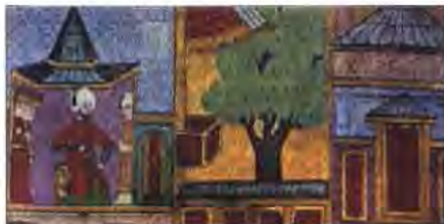
Расми 29. Дар хонаи ашрофи араб.