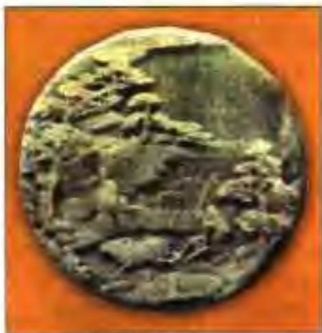
Расми 15. Парварини шолӣ.

ПАРОКАНДАГИИ ЧИН. Дар асрҳои V-VI Чин давраи парокандагии худро аз сар мегузаронд. Ин вақт қabilaҳои мугул ва турк, ки дар шимолу ғарби Чин сукунат доштанд, ба дохили Чин ба масофаи хеле дур даромада, хоҷагӣ ва маданияти мамлакатро хароб карданд. Дар зери фишор ва ҳамлаҳои пайдарпаи қabilaҳои бодиянишин давлатҳои калони Чин барҳам хӯрда, ба ҷои онҳо давлатҳои хурд-хурди сершумори камқувват ба вучуд омаданд. Сарвари бисёрии онҳо пешвоёни қabilaҳои номбурдан истилогар буданд. Дар байни ин давлатҳо Вэйи Шимолӣ калонтарин буд. Пойтахти он Лоян ном дошт. Ин давлат, ки империяи Сун ном дорад, солҳои 386-584 арзи вучуд кардаст.