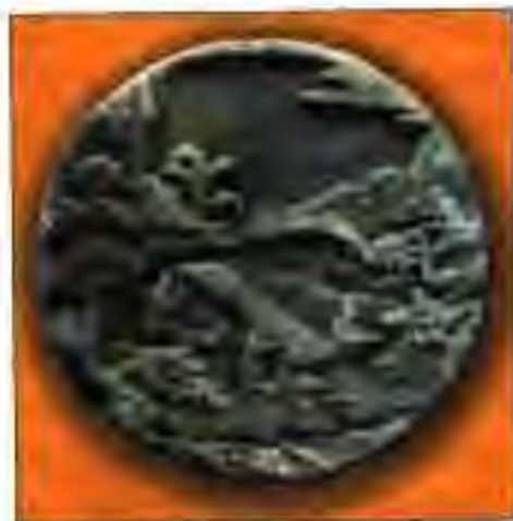
Расми 16. Қосибон абрешии мебофанд.

Янтсзян қарор дод, ки мақсадашро ба сарбозонаш фаҳмонад. Шояд онҳо ўро дастгирӣ кунанд. Хушбахтона, аскаронаш ўро дастгирӣ карданд. Янтсзян аввал қаламрави зери ҳокимияти сулолаеро, ки ба он хизмат мекард, ишғолнамуда, баъд ба васеъ кардани ҳудуди ишғолнамудаи худ шурӯъ кард. Ў дастаҳои низомии шоҳу ҳоки-