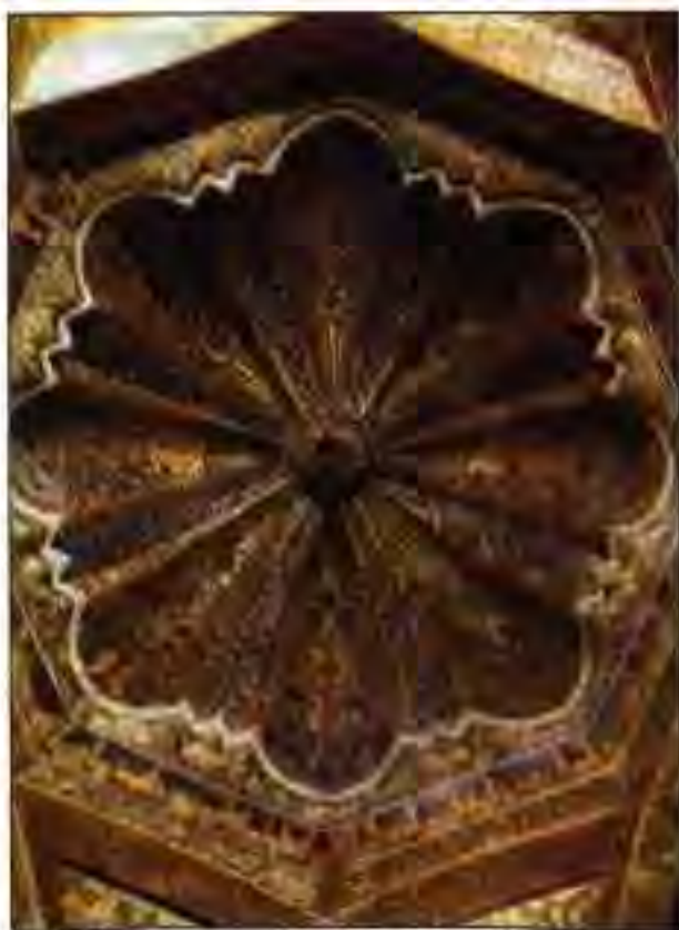
Расми 33. Гумбаз дар меҳроби Масҷиди Курдоб.

Дар охири асри VII лашкари арабҳо аз нав дар Мағриб пайдо шуда, шаҳри Карфағени Тунисро ишғол намуд. Дар оғози