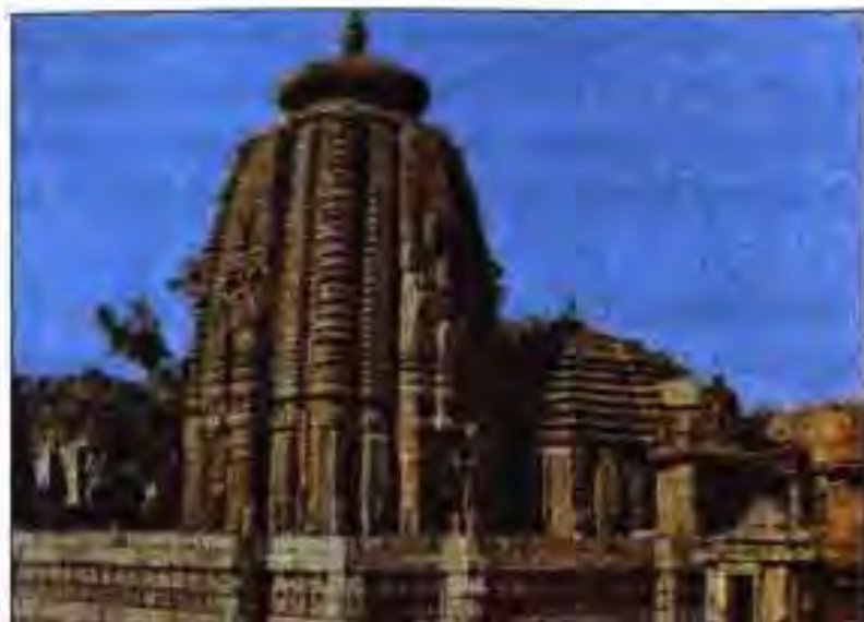
Расми 10. Ибодатхона дар Орио, соҳилҳои шарқии Ҳиндустон.

гуломдорӣ барҳам зада шавад. Сабабаш он буд, ки дар хоҷагиҳои дорон истифодаи меҳнати гуломон самарани кори онҳо паст буд. Лекин ҷамоаҳои деҳа дар ин масъала намуна буданд. Барои ҳамин ҳам гуломдорон гуломонро ҳарчӣ бештар озод карда, ба онҳо китъаи заминро иҷора меоданд.