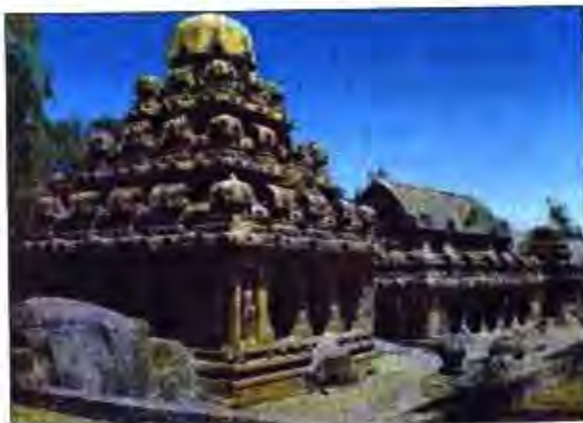
Расми 9. Ибодатхона дар ҷанубу шарқии Ҳиндустон.

Ҳар як деҳа майдони кишт ва чарогоҳ дошт. Ба деҳа сарвар ва якчанд амалдори дигар сарварӣ мекард. Ҷамоаи деҳа аз даҳҳо ва баъзан садҳо оила иборат буд. Ҷамоаи деҳа гурӯҳи захирақашоне буд, ки аъзоёни он ба касибӣ ва кишоварзӣ машғул буданд. Ин ҷамоа имконият фароҳам меовард, ки дар давлати Гуптҳо сохти