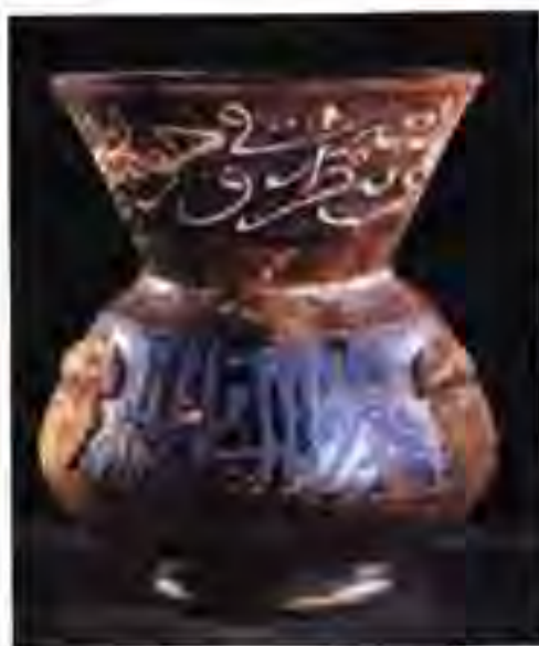
Расми 30. Зарфи касибони араб.

Ба гурӯҳи дуюми муқобилони Алӣ ҳокими Сурия Муовия роҳбарӣ мекард. Ӯ нерӯи ҳарбӣ ва сарвати бузург дошт. Як қисми қабилаҳои араби Ироқ Муовияро дастгирӣ мекарданд. Ба тахти хилофат нишаста, Алӣ ваъда дод, ки Арабистонро мисли Умар ҳукмронӣ хоҳад кард. Барои ҳамин ӯ мансабдоронро, ки Усмон таъин карда буд, аз вазифа сабуқдӯш карда, заминҳояшонро кашада гирифт. Ин иқдом душманони Алиро дар шаҳри Мадина ва тамоми Арабистон боз ҳам зиёдтар кард. Алӣ дид, ки дар ин ҷойҳо дигар такаюғи он қадар бозътимод надорад, қароргоҳи худро аз шаҳри Мадина ба шаҳри Куфа кӯчонд.