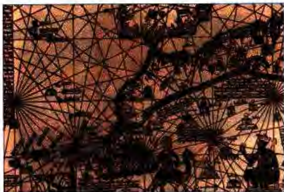
Расми 36. Марокаш ва заминҳои ба он ҳамсоя. Харитаи асри XV-и аврупоӣ.

Муқаннаъ ба Осиёи Марказӣ омада, ба тобеонаш фармуд, ки дар кӯҳи Санам қалъаи мустаҳкам созанд. Ин фармони Муқаннаъ бо тезӣ иҷро карда шуд.