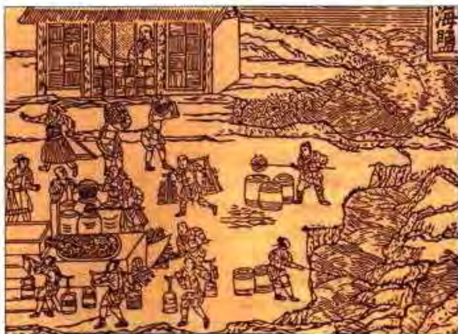
Расми 21. Чиниҳо ҳангоми қор. Асри XV.

АНҶОМИ ҲУКМРОНИИ СУЛОЛАИ СУН. Агар ислоҳоти пешниҳодкардаи Ван Ан-ши дар Чин пурра татбиқ мешуд, шояд империяи Сун умри зиёдтар медид. Дар оғози асри XII хатари аз тарафи қабилаҳои шимол забт кардани Чин ба миён омад. Барои начоти ҳокимияти худ императорони Сун маҷбур шуданд, ки соли 1126 пойтахти мамлақатро ба Ханҷжоу кӯчонанд.