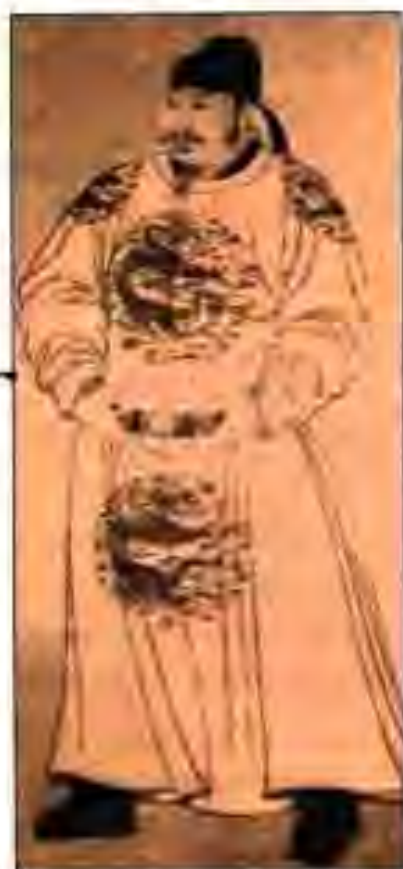
Расми 19. Императори охири сулолаи Ли Ши-мин.

Империяи Тан соли 907 барҳам хӯрдааст. Баъди барҳамхӯрии империяи Тан Чин дар тӯли даҳсолаҳои зиёд дар ҳолати парокандагӣ қарор дошт.