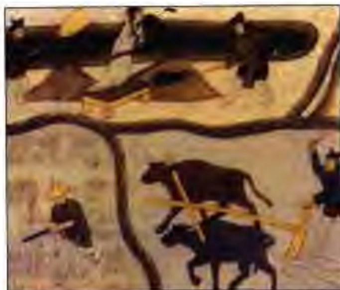
Расми 17. Киштукори кишоварзони Чин.

Вале ин ҳама муваффақиятҳои Чин то солҳои 70-уми асри VIII буд. Баъди ин империяи Тан рӯ ба таназзул ниҳод. Ин вақт хароҷоти давлатӣ аз ҳад зиёд шуд. Барои ҳамин импера-