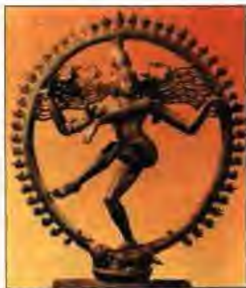
Расми 14. Ҳайкали биринҷии олиҳаи ҳиндуён.

Вале империяи ташкилкардаи Харши ҳам дуру дароз умр наид. Роҷаҳои алоҳида ҳанӯз ҳангоми дар қайди ҳаёт будани Харши мустақилият ба даст оварда, минбаъд ба ҳокимияти марказӣ иттиҳод наме-