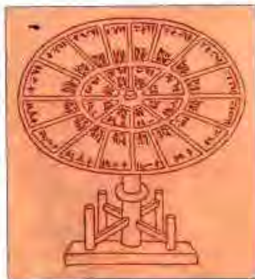
Расми 20. Ҳарфдони барои ҷон ҳуруфчинишуда.

Кишоварзон акнун ҳуқуқ доштанд, ки андози заминро қисман тавассути маҳсулот ва қисман тавассути пул адо кунанд.