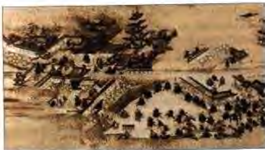
Рисун 22. Ибодатгоҳи шаҳри Нораи Чопон.

Дар миёнаҳои асри VII авлоди Сога мақоми роҳбарикунандаи худро аз даст дод. Соли 645 дар натиҷаи табодулот аксарияти