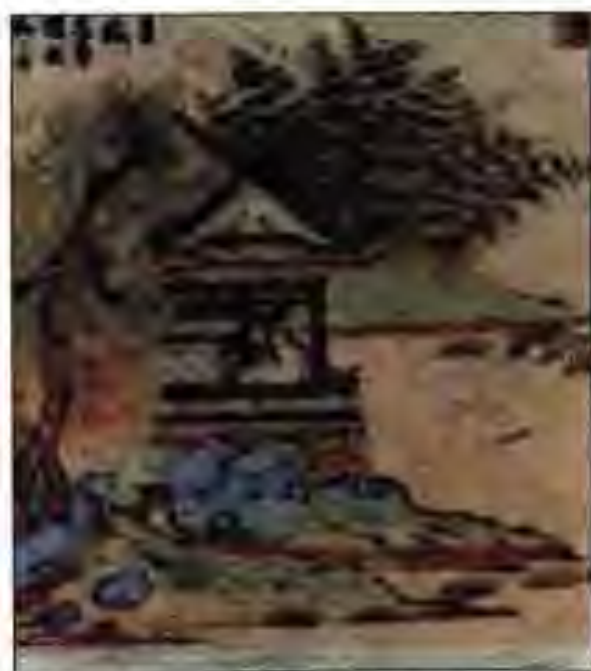
Расми 18. Деҳани Чин.

Дар охири асри VIII вазъи сулолаи Тан ва ҳокимияти марказии он рӯ ба таназул ниҳод. Аз ин аҳвол ҳокимону лашкаркашон хуб истифода бурда, меҳостанд, ки истиклолият ба даст дароранд. Ин қабил амалдорон дигар аз император наметарсидагӣ шуданд. Дар натиҷа соли 785 фармондеҳи артиш Ан Лу-шан ба муқобили император шӯриш бардошт. Дар ин шӯриши зидди ҳукумати лашкари 120-ҳазорнафара иштирок