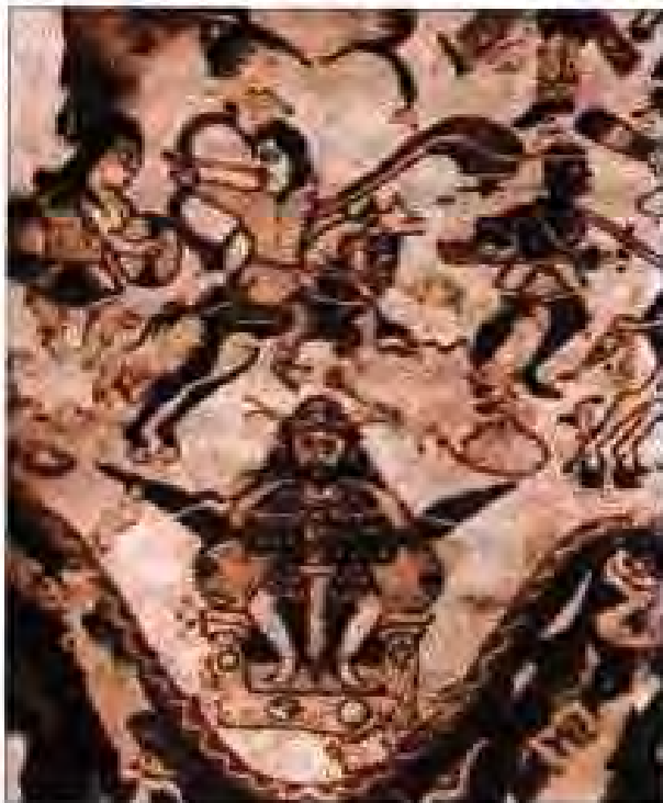
Расми 1. Шох Хусрави I дар майдони набард.

ХАРАКАТИ МОНАВИЯ. Сарфи назар аз пешрафти хоҷагӣ дар нимаи дуюми асри III аҳволи кишоварзони эронӣ хеле вазнин буд. Ба онҳо лозим меомад, ки ба давлат андозҳои гуногуни зиёд бидиҳанд. Ба ин аҳвол гирифтӣ шудани кишоварзон бо гуноҳи амалдорон низ ба амал меомад. Онҳо бо ҳар роҳу восита аз кишоварзон андози зиёд меситониданд. Аҳли меҳнат аз вазъи вазнини худ норозӣ буд. Аз ҳамин сабаб дар мамлакат ҳаракати