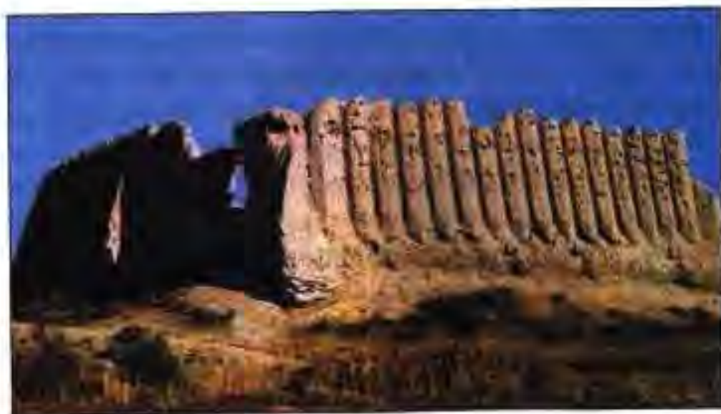
Расми 2. Харобаҳои кӯшики Марв. Асрҳои VI-VII.

Сарфи назар аз ҷидду ҷаҳди Ардашери Бобакон, Шопури I ва Бахроми I давлати Сосониён он қадар пурзӯр набуд. Вале дар давраи ҳукмронии Шопури II – солҳои 309-379 он рӯ ба тараққи ниҳод. Ҳудудҳои давлати Сосониён ҳам дар самти ғарб ва ҳам дар самти шарқ васеътар шуданд. Дар давраи шохигарии Яздигурди I (солҳои 399-420) низ давлати Сосониён дар рушду нумӯш буд. Дар мамлакат шаҳрҳо ободу зебо шуда, шаҳрҳои нав бунёд ёфтанд. Дар ин давра ба давлати Сосониён тохтутози лашкари Рим ва кӯчманчиён қатъ гардид. Вале дар дохили давлат оромию ваҳдати умумихалқӣ вучуд надошт. Дар музофотҳои гуногуни он ва алаҳхусус дар Қафқозу Осиёи Марказӣ бар зидди шохони сосонӣ шӯришҳо ба амал меомаланд. Мақсади шӯришҳо беҳбудии зиндагии аҳолии камбағал буд. Ин шӯришҳо дар