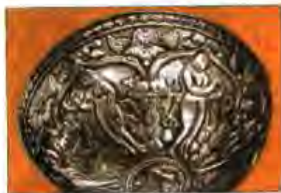
Расми 5. Табақи нуқрагин аз Чалак.

Далели марказиятноки будани давлати Ҳайтолиён пойтахти ягона доштани он мебошад. Пойтахти давлати Ҳайтолиён шаҳри Бомӣён буд, ки ҳоло дар Афғонистони Шимолии имрӯза воқеъ аст.