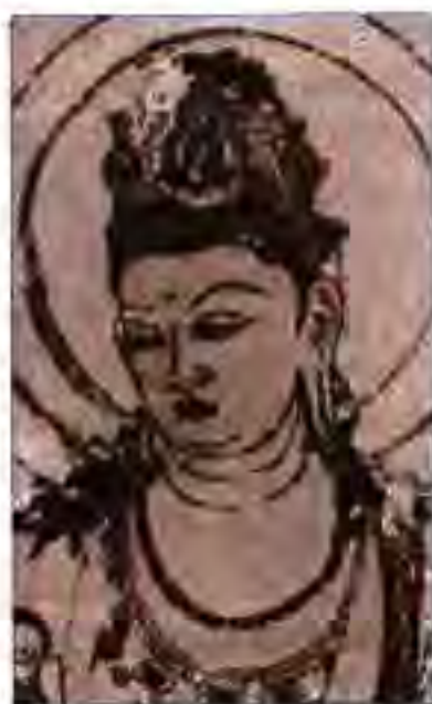
Расми 12. Мусаввари буддой дар яке аз ибодатхонаҳои шаҳри Нора. Асри VII.

дошт: 1) Бараҳманҳо табақаи коҳинони динӣ буданд. Ҳуқуқҳои аъзоёни табақаи бараҳманҳо нисбат ба се табақаи дигари аз он поёнтар баланд буд. 2) Табақаи кшатриҳо аз хизматчиёни ҳарбӣ иборат буда, ҳуқуқҳои аъзоёни он аз ҳуқуқҳои аъзоёни табақаи бараҳманҳо пасттар, лекин аз ду табақаи аз кшатриҳо пасттар баландтар буданд. 3) Вайшиҳо табақаи сеюмро ташкил мекарданд. Ба ин табақа аҳли захмат – кишоварзон, ҳунармандон ва тоҷирон дохил буданд. Ҳуқуқҳои аъзоёни ин табақа аз ҳуқуқҳои аъзоёни табақаи шудра, ки охирин ба шумор мерафт, баландтар буданд. 4) Шудра табақаи пасттарин ба шумор мерафт ва аъзоёни он беҳуқуқтарин буда, қорҳои аз ҳама ношоҷаю ифлос ва камарзиштаринро иҷро мекарданд.