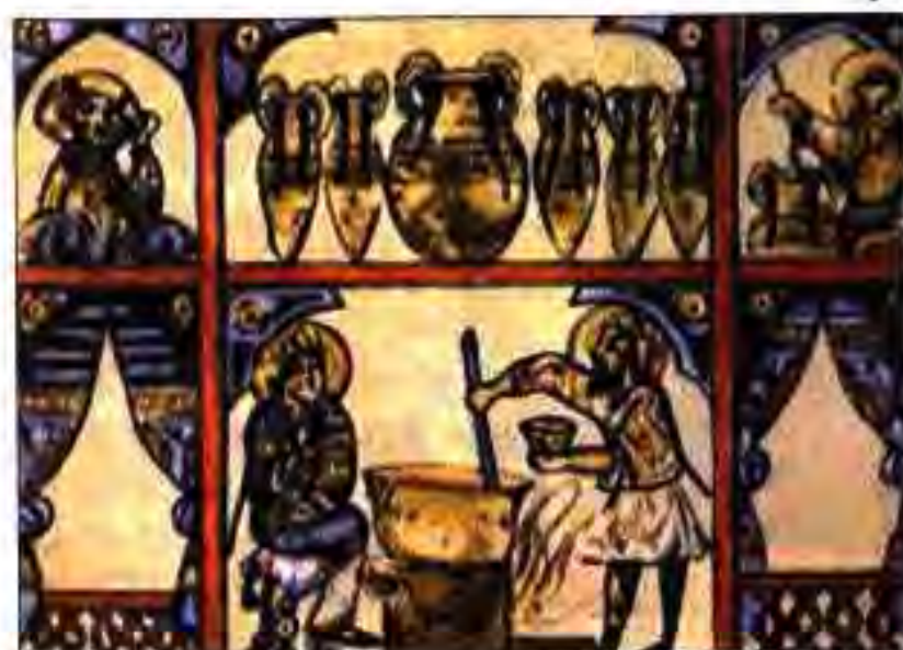
Расми 32. Дар доруҳона.

Соли 691 Абдулмалик бо лашкари худ ба Куфа дохил шуда, Ироқро ба Уммавиён тобеъ кунанд. Соли дигар амалиётҳои ҳарбии Абдулмалик дар Ҳичоз оғоз ёфтанд. Ин вақт Ҳичоз дар зери ҳокимияти Ибни Зубайр буд. Ӯ талаб мекард, ки ҳоҷиёни ба зиёрати Каъба ба Макка омада ба ӯ савганд ёд кунанд. Барои ба Ибни Зубайр берун аз Арабистон пеш бурда натавонистани таблиғот Абдулмалик муқаррар намуд, ки ҳоҷиҳо ба ҷои Макка ба зиёрати Байтулмуқаддас раванд.