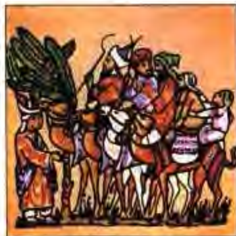
Рисми 23 Бадавиён ҳангоми лашкаркашӣ.

МОҲИЯТИ ДИНИ ИСЛОМ. Китоби муқаддаси дини ислом "Қуръон" мебошад, ки маънояш "Китоби хониш" аст. Дар ин китоб арзишҳои ахлоқӣ ва тамоми суннатҳои дигари дини ислом бо забони арабӣ инъикос