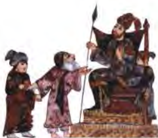
Расми 28. Ноиби Халифа ва дарवेशон.

Соли 644, баъди аз дасти гуломи эронӣ кушта шудани Умар, ба тахти Хилофати Мадина Усмон ибни ал-Аффон менишинад. Ӯ ба яке аз духтарони Муҳаммад (с) ҳонадор шуда буд. Баъди вафоти Муҳаммад (с) пайғамбар Усмон духтари дигари ӯро низ ба занӣ гирифт. Барои ҳамин ҳам Усмонро шӯҳриомез "ду қарат домоди пайғамбари Аллоҳ" ё ки "соҳиби ду нур" меномиданд.