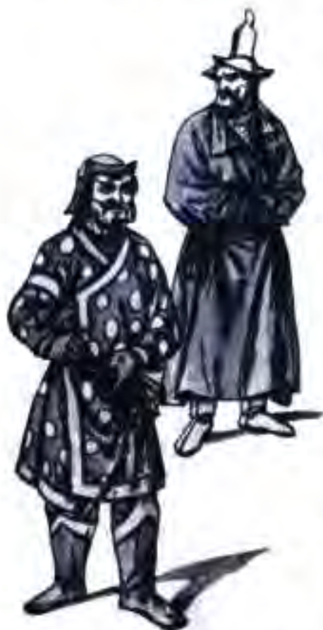
Расми 7. Сару либоси туркҳо. Асрҳои X-XI.