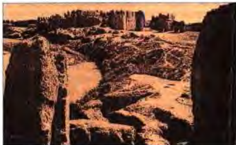
Расми 3 Ҳаробаҳои Сиситон.

Баъд аз вафоти Хусрави I Анӯшервон давлати Сосониён рӯ ба таназзул ниҳод. Ҳокимони вилоятҳои алоҳида мунтазам шӯриш мебардоштанд. Яке аз ҳамин шӯришҳо соли 590 бо роҳбарии Баҳроми Чубина ба амал омадааст. Хусрави II маҷбур шуд, ки аз