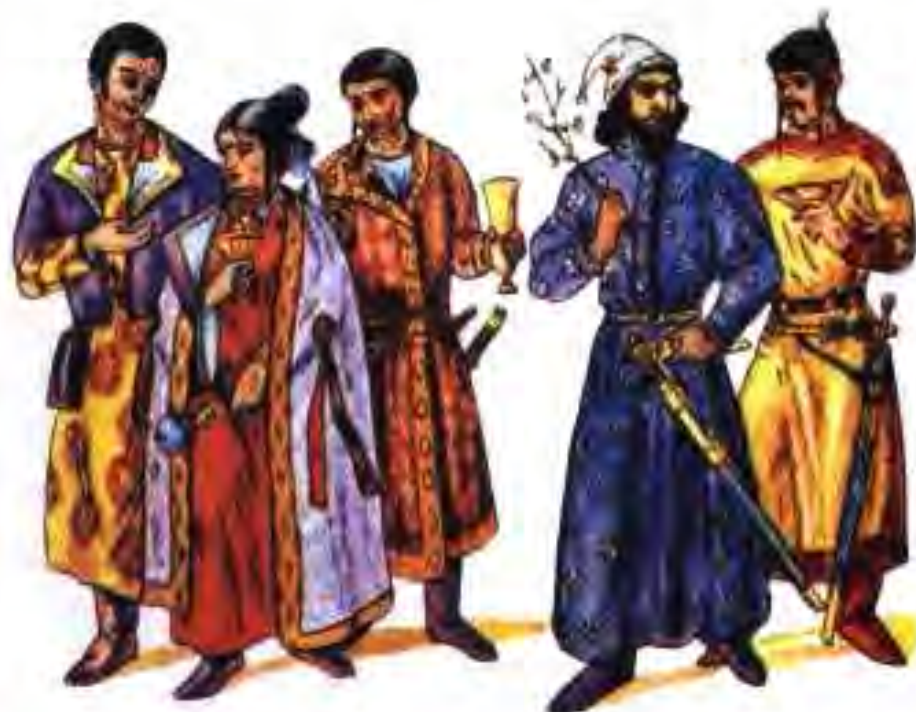
Расми 6. Сару либоси мардуми Осиёи Марказии замони Ҳайтолиён.

Дар ҷанги пешина Ҳайтолиҳо бар Эрони Сосонӣ голиб баромада, дар созишномаи сулҳ сарҳадҳои байни ин давлатҳоро муқаррар карда буданд. Кӯшиши Сосониён барои васеъ кардани ҳудудҳои давлати худ маънии вайрон кардани шартҳои ҳамин созишномаро дошт. Аз маъҳазии зерин шумо мебинед, ки шоҳи Сосониён бо хиллаю найранг чӣ тавр аҳдшиканӣ кардааст: