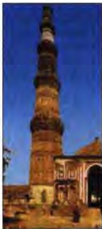
Расми 11. Қутбманори асри XIII. Деҳлӣ.

Подшоҳ низ ин вақт аз меҳнати гуломон кам истифода мебардагӣ шуд. Қисми зиёди заминҳои худро ӯ ҳам акнун ба иҷора меодагӣ шуд. Дар баробари ин дар ҳуди ҷамоаҳои деҳот тағйирот ба амал меомаданд. Олоти меҳнат такмил дода шуда, истеҳсолоти кишоварзиро сермахсултар мегардонд. Оилаҳои калон ба оилаҳои хурдтар таксим мешуданд. Қитъаҳои калонтари замин дар байни аъзоёни чунин оилаҳо таксим карда мешуданд. Як қисми аъзоёни ҷамоа муфлис мешуд. Онҳо аз ашхоси бой ва ё осудаҳол қарздор шуда, тобеи ингуна одамон мегардиданд.