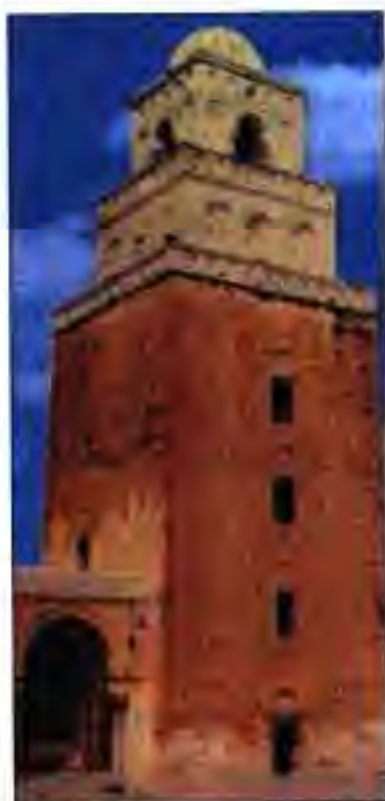
Раёми 34. Манораи масҷид дар Кайруан (Тунис, асри IX).

ШҶРИШИ АБҶМУСЛИМ. Дар замони таназзули ҳокимияти сулолаи Уммавиён ҳаракати озодихоҳонаи халқҳои хилофат авҷ гирифт. Қариб сар то сари онро шӯришҳо фаро гирифтанд. Шӯриши калонтарин дар Хуросон ба амал омад, ки сардори он Абӯмуслим буд.