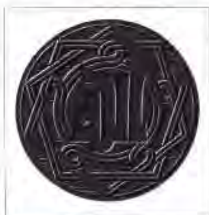
Расми 37. Нақшу ниғори манораи масҷиди ал-Ҳаким дар Қоҳира.

ИДОРАИ ХИЛОФАТИ АББОСИЁН. Хилофати Бағдод давлати исломӣ буд. Мувофиқи қонунҳои мазҳаби суннӣ халифаи Аббосиён вазифаи имом ва амир, яъне ҳокимияти динӣ ва дунявӣ хилофатро дар ихтиёри худ дошт. Халифа ҳамчун сарвари мусулмонон, ворис ва муовини Муҳаммад пайгамбар ва ҳатто намояндаи Аллоҳ дар Замин, аз ин рӯ, соҳиби олии тамоми замин ва бонгарихои дигари мамлакат ба шумор мерафт. Ҳокимияти халифа номаҳдуд, яъне мутлақ буд. Табақаи болоии ин мутлақиятро аъзоёни сулола ва наздикони дигари халифа ташкил менамуданд. Ноибони халифа дар вилоятҳо аз тарафи халифа таъйин карда мешуданд ва танҳо ба ӯ итоат мекарданд.