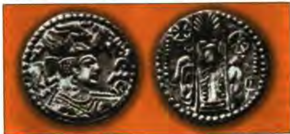
Расми 4. Тангаи Ҳайтолиён.

Дар маъхазе гуфта мешавад, ки ҳайтолиҳо золим, бочуръат ва дар майдони набард қобилияти ғавқулодда доранд.