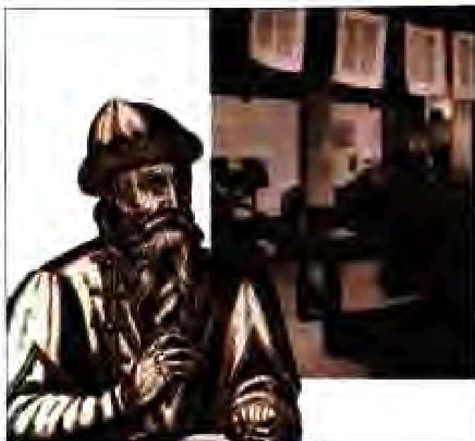
Расми 178. Гутенберг дастгоҳи чопкуниро ихтироъ мекунад.

САҶӢҲАТИ МАРКО ПОЛО. Аврупоиён баъди лашкаркашиҳои салибӣ ба ҷаҳон бо ҷашми дигар нигаристанд. Аз он ҷумла, кишварҳое, ки дар масофаи хеле дур воқеъ гардида буданд, диққати онҳоро бештар ҷалб намуданд. Аз сӯи дигар,