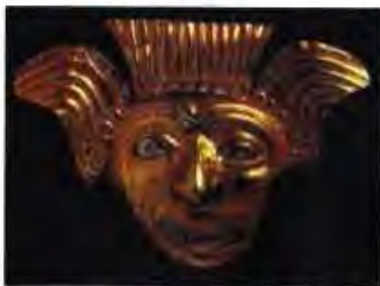
Расми 223. Тасвири худои болдор, аз тилло ва платина.

ДИНУ ОИНҲОИ ТАРАСКҲО. Тараскҳо ба якчанд худо