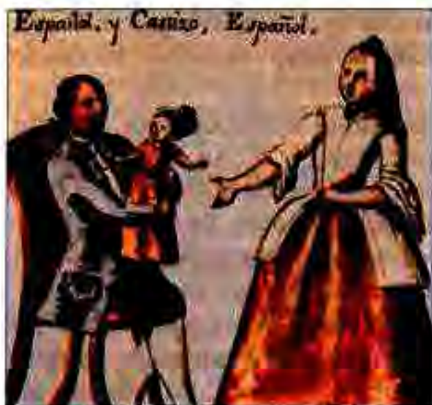
Расми 201. Кӯдаки аз марди испанию зани квартиронӣ ба дунёомадаро испанӣ меҳисобиданд.

паниҳо дастаҳои хуб мусал- лахбудаи аскарон низ шомил буданд.