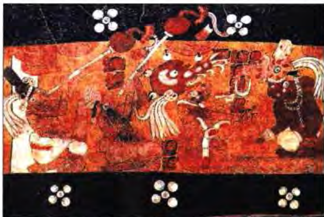
Расми 213. Туббозӣ.

Тасвирот дар бораи зиндагии ҳиндиён тавассути гулдӯзиҳои зебою дилкаш ва дорои мазмуни баланд низ иҷро карда шудаанд. Пори маторҳои аз як мақбара ёфтшуда дар ин бора гувоҳӣ