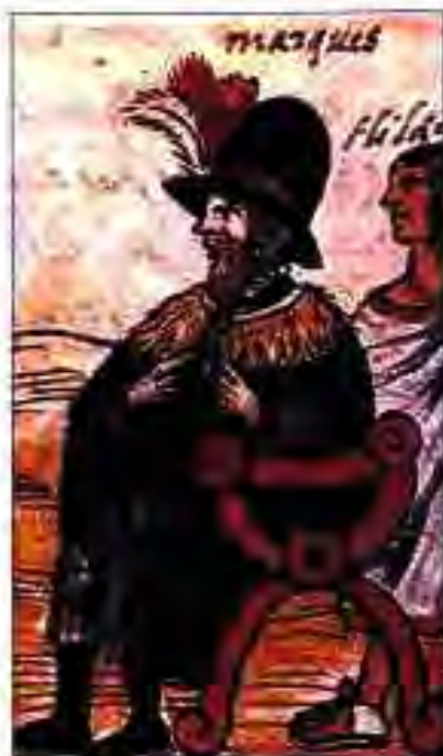
Расми 202. Эрнан Кортес.

ЗАБТКОРИҲОИ ПОРТУГАЛИ-ҲО. Португалиҳо забткориҳои худро аввал дар Осиё оғоз намуданд. Шохи Португалия паси ҳам ба ҷониби Ҳиндустон қорвонҳои киштиҳоро равон мекард. Боре дастаи калони ин киштиҳо дар уқёнуси Атлантика роҳгум зада, ба соҳилҳои шарқии Америкаи Ҷанубӣ рафта расид. Португалиҳо тасодуфан ҳамин қисмати Америкаи