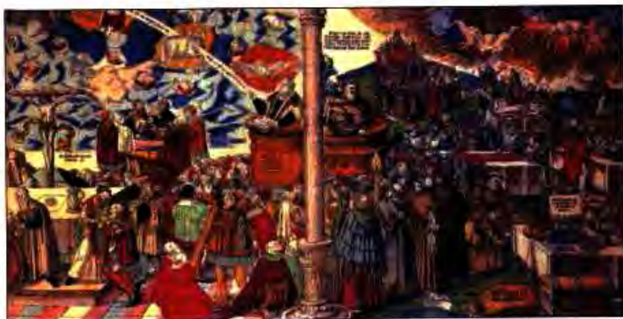
Расми 182. Калисои ростқавл (аз чап) ва калисои дурӯгин (аз рост).

ДаъватӢои Мартин Лютер тамоми Олмонро ба ларза овард. Ба ақидаи Лютер калисо миёнарави байни худо ва одамон шуда наметавонад.