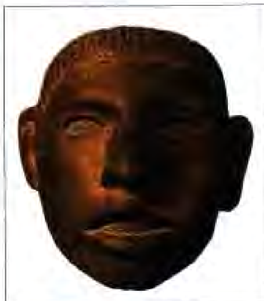
Расми 190. Ҳайкали сари астек.

Дар Мексикаи оғози асри XVI боз ду шаҳр-давлати дигар – Тикал ва Вишактун низ мавҷуд буданд. Ин шаҳр-давлатҳо тахминан аз асри III боз вучуд доштанд. Дар бораи сабабҳои аз