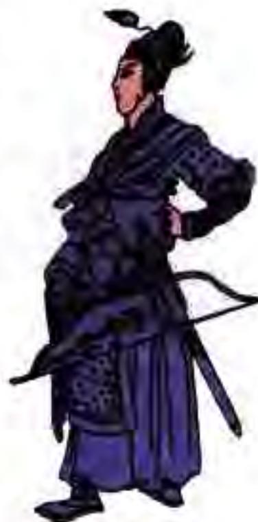
Расми 174. Ботухон.

31 май соли 1223 дар наздикии дарёи Калка дастаҳои муттаҳидани русу кипчоқҳо бо нерӯҳои асосии муғулҳо вохӯрданд. Князи Киев Мстислав Романович бо дастаи сарбазони худ аз дур шикастхӯрии ҷузъу томҳои лашкари Русро тамошо мекард. Дар рӯзи сеюми муҳориба князи Киев бо ҷанговаронаш силоҳи худро ба замин гузошта, ба Субадай ваъда дод, ки ӯ бе ягон мамоният ба Рус хоҳад даромад. Сарфи назар аз ин рафтораш, князи Киев бо ҳамроҳии ҷанговарон аз тарафи муғулҳо ваҳшиёна ба қатл расонда шуд.