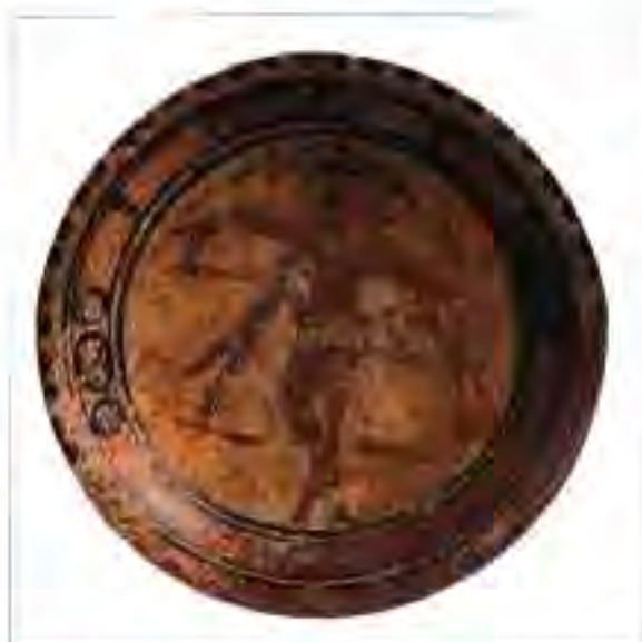
Расми 220. Раққосаи ҷавони Майя.