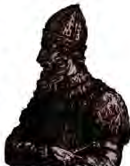
Рисунг 177. Ивани III.

Москва ҳучум намуда, онро ишғол ва талаю тороч карданд. Князи Москва ва князҳои дигари Рус мисли пештара ҳар сол аз халқ андоз ғундошта, ба хони мугулҳо месупориданд. Маълум буд, ки сарзамини Рус дар парокандагӣ аз зери зулми мугулҳо озод шуда наметавонад. Аксарияти князҳо эҳсос мекарданд, ки танҳо дар муттаҳидӣ озодӣ ба даст оварда метавонанд. Муттаҳидшавии князҳои Рус дар атрофии Москва, махсусан дар солҳои ҳукмронии Ивани III вусъат ёфт. Баъзе князҳо ихтиёран ба князи Москва ҳамроҳ мешуданд. Қисми дигари князҳо аз ин кор саркашӣ мекарданд. Бинобар ҳамин сабаб Ивани III онҳоро зӯран ба худ тобеъ мекард. Яке аз чунин князҳои Новгороди Бузург буд. Ивани III ба Новгород лашкар кашида, онро таслим карда ва вечеро пароканда намуда, рамзи истиклолияти Новгороди Бузург – Зангӯларо ба Москва овард.