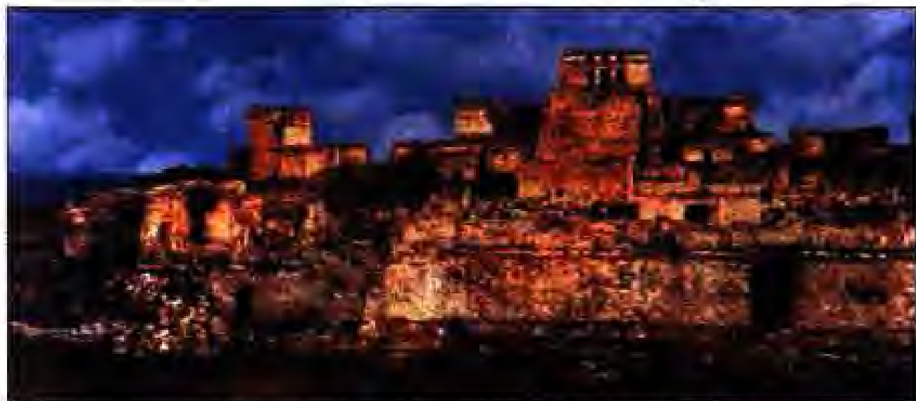
Расми 197. Харобаҳои бузурги шаҳри Тулуми Юкатан.

Номи Империяи Тиауанако аз номи шаҳри ҳамномаш бармеояд. Он дар оғози асрҳои миёна дастовардҳои қадими Инкро нигоҳ дошта буд. Вале баъд рӯ ба таназзул ниҳод. Дар каламрави ин давлат марказҳои дигари ободу зебои дорои маданияти баланд бунёд ёфта буданд. Яке аз онҳо Уари воқеъ дар водии дарёи Мантарои музофоти Уанта буд. Иншоотҳои бинокории ин шаҳр масоҳати бузургро ташкил мекард. Сарфи назар аз ин, Уари аз ҷиҳати сатҳи меъморӣ ва муҷассамасозӣ аз