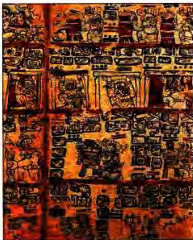
Расми 219. Саҳифаҳо аз дастнависи асари адабии хиндиён.

Алба Иштлилшочита асари худро асосан дар асоси маълумоти бойго-