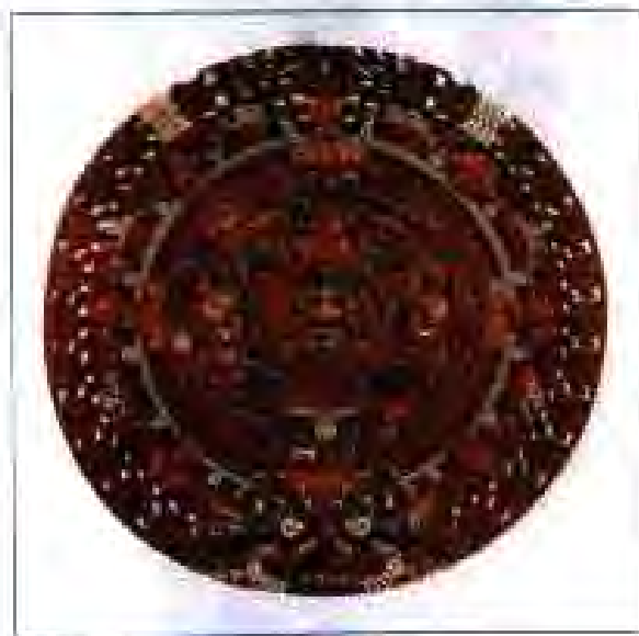
Расми 191. Тақвими астекҳо дар шакли доираи Офтоб.