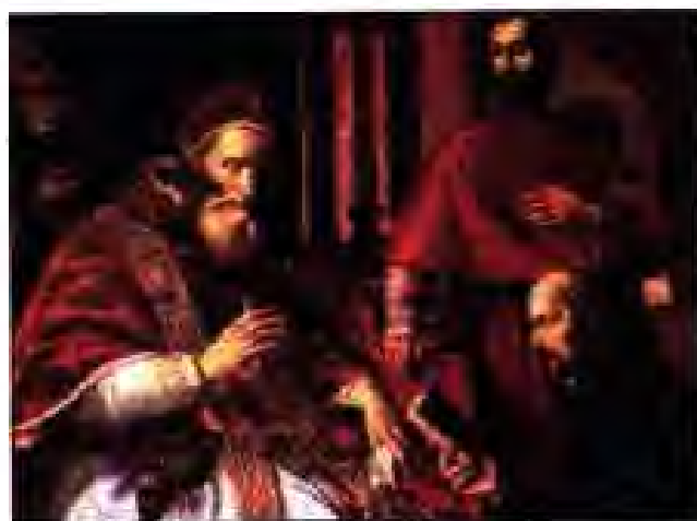
Расми 188. Игнатий Лойола Ошнномаи "Ҷамъияти Исо" ё худ "Ордени Иезуитҳо"-ро ба Папаи Рим Павели III месупорад.

Папаи Рим дар муборизаи зидди ислохотхоҳон ҷораҳои ҷавобӣ мечуст. Ӯ соли 1540 "Ҷамъияти Исо" ё худ "Ордени Иезуитҳо"-ро таъсис кард, то ки тавасути он бар зидди ислохотхоҳон берахмона мубориза барад. Асосгузори ин ҷамъият ашрофи испанӣ Игна-