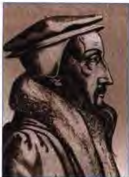
Расми 186. Жан Калвин – асосгузори мазҳаби протестанти.

Дар кишварҳои дигари Аврупо, ба монанди Англия, Дания ва Шветсия ислоҳоти калисоро королҳо бо дастгирии ашрофон гузаронданд. Заминҳои аз калисо мусодирашуда ба дасти ашрофон гузаштанд. Императорҳо бошанд, дар ин кишварҳо сардори калисо гардиданд.