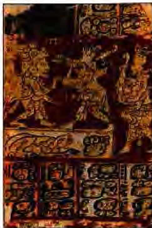
Расми 206. Дастнависи иероглифӣ. Фарҳанги Майяҳо.

Муассисаҳои таълимии онҳо "Еҷай уаси" ва "Акла уаси" ном доштанд. Таълимгоҳҳои "Еҷай уаси" барои таълими фарзандони ашроф муқаррар гардида буданд. Дар он ҷо роҳбарони ояндаи