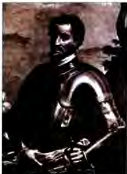
Рисун 204. Конкистадор Эрнандо де Сото.

Чанубиро аз они худ карданд, ки он Бразилия имрӯза буд. Қисматҳои дигари ин чоро Испания ишғол кард. Ҳамин тариқ, Бразилия мустамликаи Португалия шуд.