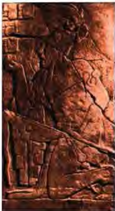
Расми 208. Хаттот. Аз девори "Ибодатгоҳи Навиштаҷотҳо".

сиёсию харбӣ ва рӯхонии мамлакат тайёр карда мешуданд. Яке аз чунин мактабҳо дар Кускои наздикии Қасри Инки Роки воқеъ гардида буд. Инки Роки худ асосгузори ин мактаб буд. Дастпарварони донишгоҳи Инки Роки маълумоти олии гирифта, аз он ҷумла забони барои инкҳо умумиро, ки "руне сими" ном дошт, аз худ мекарданд.