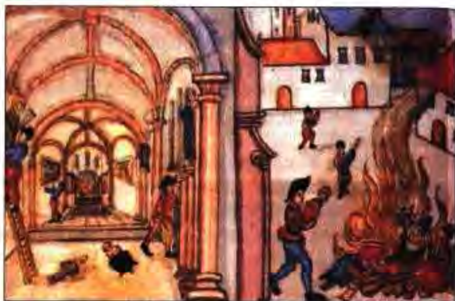
Расми 185. Мардум бутҳои зебу зиннати католикиро несту нобуд мекунанд.

Князҳои Олмони Шимолӣ дар мулкҳоиашон ислоҳоти калисиро мувофиқи тавсияи Мартин Лютер доир намуданд. Онҳо дайрхоро баста, заминҳои калисоро кашада мегирифтанд. Ҳукуки князҳо номаҳдуд гардид. Онҳо акнун ба калисои дар мулкашонбуда низ роҳбарӣ мекарданд. Калисои протестантиро калисои лютерӣ мегуфтанд.