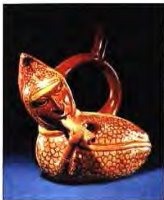
Расми 212. Муסיқачӣ, ки дар намуди одам – зарф инъикос ёфтааст.

Масалан, Кодекси "Нуттел" 11 метр дарозӣ дошта, дар пӯсти гавазн бо аломатҳо – расмҳо "навишта" шуда, чун дар шакли "гармошка" (асбоби мусиқӣ) 44 маротиба катъ карда шудааст, яъне 88 варақ дорад. Расмҳои ин кодекс дорои сифати баланди рассомӣ, дар ҳолати ҳаракат, пурмазмун ва бо назокат эҷод шудаанд.