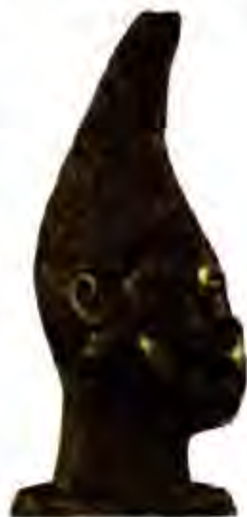
Расми 230. Муҷассамаи модари ҳоким.