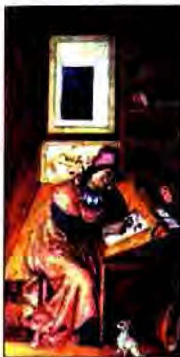
Расми 181. Петрарки дар утоқи кори худ.

ТАВЛИДИ МАДАНИЯТИ ЭҲЁ - РЕНЕСАНС. Дар охирҳои асри XIV - аввали асри XV дар Италия маданияте тавлид ёфт, ки онро Эҳё номидаанд. Маълум аст, ки маданияти Эҳё аз тамаддунҳои Хилофати Араб ва Сомониён сарчашма гирифтааст. Маданияти Эҳё ба Италия ва баъд ба давлатҳои дигари Аврупо ҳамоно вақте ворид гардид, ки калисон католикӣ ва Папаи Рим бар зидди ҳама гуна донишхое, ки ба қолабҳои ин дин мувофиқат намекард, муборизаи шадид мебард. Сарфи назар аз ин, аҳли тараккихоҳ ва инсондӯсти Аврупо, аз он ҷумла, намоёндагони пешқадами маориф, илм, адабиёт, санъат ва шахсиятҳои сиёсӣ рӯ ба маданияти пешқадами Юнон ва Рими қадим оварданд. Онро омӯхта, аз нав эҳё карда, дар байни мардум паҳн менамудаанд. Дар баробари ин асархое эҷод мекарданд, ки онҳо мағз андар мағз аз ғояҳои инсондӯстӣ саршор буданд. Дар ин давра ва асрҳои XV-XVII маданияти Эҳё дар мамлакатҳои пешқадами Аврупо гул-гул шукуфт. Он ба майдони таърих шахсиятҳои машҳурро овард, ки дар байни онҳо Эразм Роттердамский, Томас Мор, Алберти, Петрарки, Леонардо да Винчи, Боттичелли, Титсиан, Микеланджело, Рафаэл ва дигарон ҳастанд. Ин шахсиятҳо ва шахсиятҳои дигар, ки онҳо хеле зиёданд, дар соҳаи маданият воқеан инқилоб ба амал оварданд. Ғояи асосӣ дар асарҳои онҳо инсон мебошад. Ин мутафаккирон маҳз инсонро васф мекарданд.