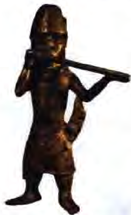
Расми 236. Ҳайкали биринчии сарбози пайнавоз. Бенин.

СОМАЛИ Дар нимҷазираи Сомалӣ ва соҳилҳои баҳри Сурх халқиятҳои галла ва сомалӣ, дар кӯҳсори Аббесин бошад, халқиятҳои амҳара, татра ва халқиятҳои дигар сукунат доштанд.