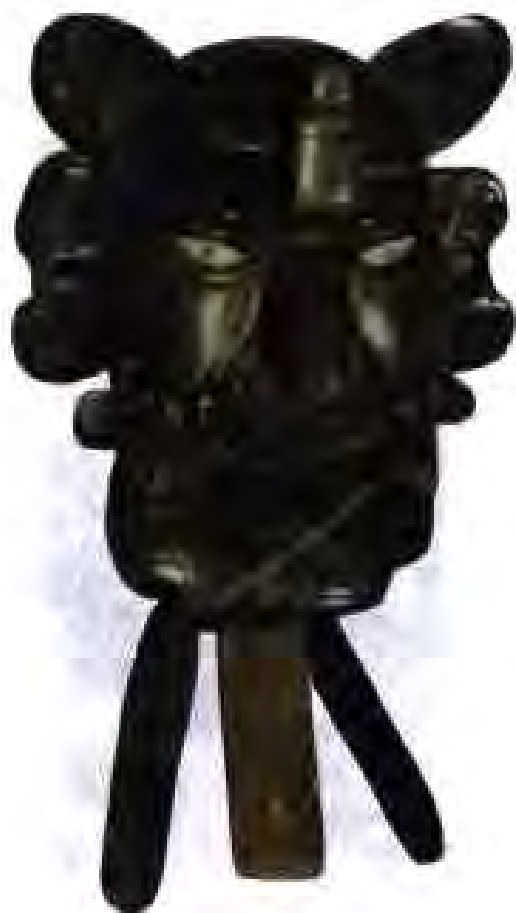
Расми 227. Ниқоби худои ҳиндиён дар намуди кӯришанарак.

Дар Уку паче замоне ду мори калон пайдо мешавад – Яку Модар ва Сече Модар. Ҳангоми ба рӯи замин ҳазида баромадани мори аввал он ба дарёи калон мубаддал мегардад. Вақте ки ба Олами Олӣ мебарояд, ба Тиру Камон – Кайчи табдил ёфта, бордор мешавад ва ба ҳайвоноту наботот ҳаёт мебахшад. Мори дуюм рост роҳ мегаштааст. Ҳангоми ба осмон баромадан ба барқ – Иляна, худои борон, тӯфон ва раъду барқ мубаддал мегардад.