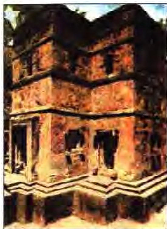
Расми 235. Калисон зеризаминӣ дар Ламбэз. Ҷабашистон. Асри XII.

галӣ, ки ба Ҳиндустон рахсипор буд, соли 1500 дар соҳили Мадагаскар лангар партофт. Барои ҳукмронӣ дар уқёнуси Ҳинд Англия, Фаронса, Голландия ва Португалия байни ҳамдигар мубориза мебуданд. Оқибат ба Фаронса муяссар гардид, ки дар уқёнуси Ҳинд мавқеи худро мустаҳкам карда, Мадагаскарро ҳам ба даст дарорад. Соли 1642 экспедитсияи Жан Прони ба сохтмони истехкоми Форт-Дофин, воқеъ дар ҷанубии ҷазира хишти аввалинро гузошт.