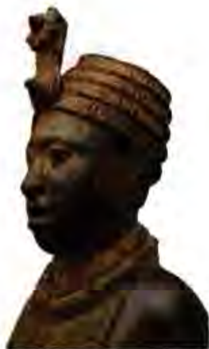
Расми 233. Сурати ҳоким, Нигерия. Асри XII.

Аврупоиёни аввалине, ки ба Мадагаскар сар дароварданд, португалиҳо буданд. Экспедитсияи Кабрал порту-