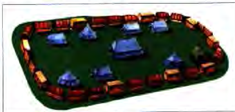
Расми 173. Боинигоҳи мустаҳками гусиён.

Қисми асосии гусчиёно табориҳо ташкил меоданд. Онҳо аз деҳқонон, хунармандон ва камбағалони шаҳр иборат буданд. Шахсоне, ки ба Табор меомаданд, пулҳои худро ба сандуки