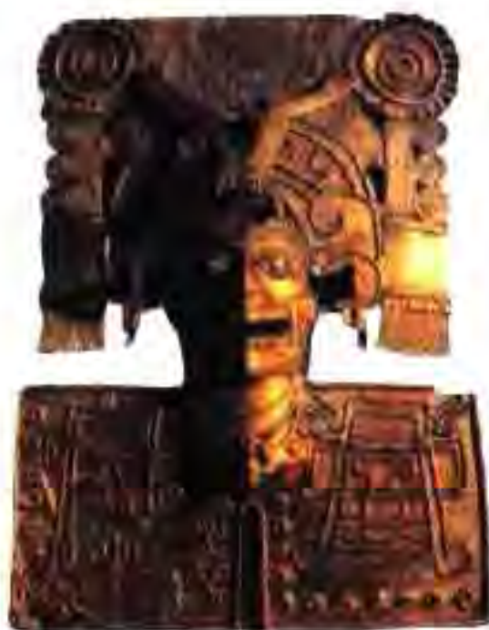
Расми 218. Ниқоби тиллоӣ аз Монте-Албане.

Ёдгории дигари адабиёти қисса-эпоси ҳиндӣ, ки аз қаблаи Какчикели то давраи мо расидааст, "Анналҳо" мебошад. Дар он дар бораи тақдир ду қаҳрамони асар, ки Гагавис ва Сактенаух ном доранд, сухан меравад. Ба поре аз он таваҷҷӯх кунед.