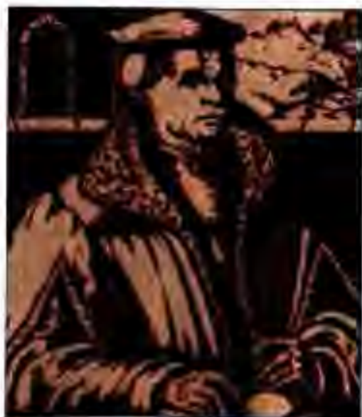
Расми 183. Томас Мюнсер.

ИСЛОҲОТИ КАЛИСО. Маросимҳои пурдабада ва идҳои сершумори калисон масеҳӣ, ки бо харчи зиёд мегузашт, боиси норозигии ашрофони шахрӣ гардид. Шаҳриён талаб намуданд, ки андозҳои барои таъмини рӯҳониён муқарраргардида кам карда ва даёрҳо пушида шаванд. Онҳо "калисон арзон"-ро талаб карданд.