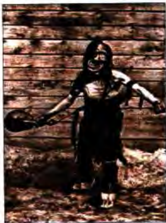
Расми 215. Ҷодугар.

Ҳайкали писарбачаи 12-13-солаи варзишгар аз Талатилко ёфтшуда тақрибан ба солҳои 1300-800 пеш аз милод рост меояд. Ӯ дар ҳолати ҷаҳиш ба ақиб ва бо пойҳои рост истодан тасвир ёфтааст. Барои иҷрои ин машқ ӯ бо тамоми қувваи бозӯ ва бадан ба шаст ҳаракат кардааст. Дар