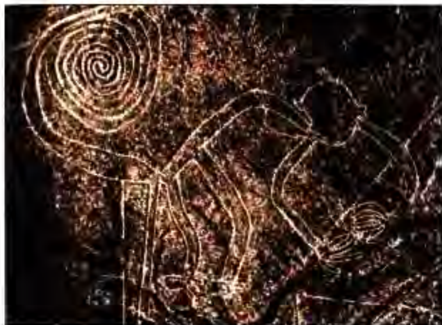
Расми 210. Расмҳои водии Наска.

доштани воқеаҳои муҳим буд. Ҳар як гиреҳи "кину" маънои оморию риёзӣ ва ахбороти таърихӣ дошт. Китоби "Тафсир"-и Горсиласа дар асоси донишҳои дар гиреҳҳои "кину" инъикосёфта таҳия шудааст.