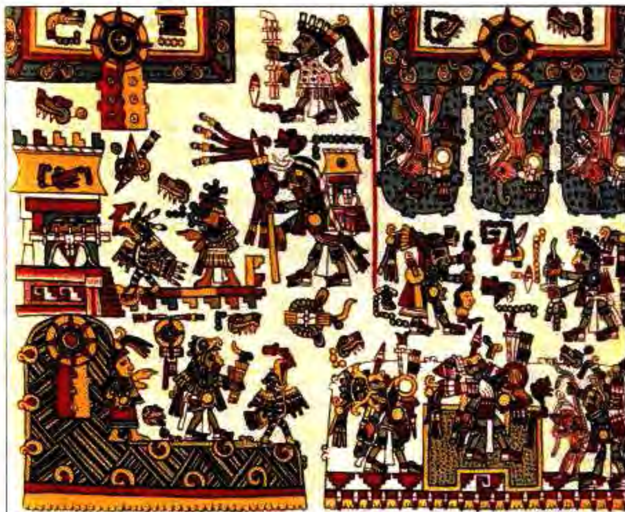
Расми 209. Поряи расмҳо аз "Кодекси Нуттал". Фарҳанги Миштекҳо.

Илми ситорашиносии Ҳиндӣ бе илми риёзӣ Ҳандасаи бонизому дақиқ пеш рафта наметавонист. Аҷибаш он аст, ки низомии риёзии майяҳо ва халқҳои дигари Ҳиндуи Америка то як дараҷа ба риёзиёти Ҳиндустони қадим ва аввали асрҳои миёна