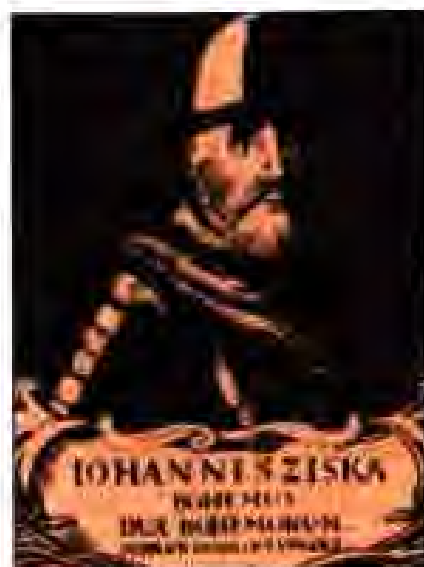
Расми 172. Ян Жижка.

Соли 1419 дар Прага шӯриш ба амал омад. Хунармандону камбағалон ба шаҳрдорӣ даромада, аз тирезаҳои он ҳокимони бадкинро берун мепартофтанд. Ба шӯришгарон муяссар гардид, ки дар марказ муддате ҳокимиятро ба даст оранд. Онҳо аз шаҳр бойҳою ашрофони немисро пеш карданд. Шӯришчиён дайрхоро горат намуда, хизматгорони калисоро мекуштанд ва ё аз шаҳр меронданд. Аз ин ҳолат панҳо истифода бурда, заминҳои калисоро забт карданд.