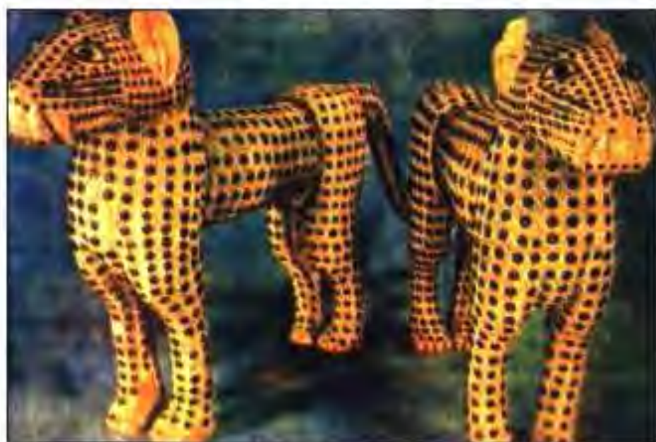
Рис. 232. Ҳайкатчаҳои ду паланг аз устухони оҷ. Бенин. Асри XVI.

асрҳои VIII-XV дар соҳилҳои Замбезӣ давлати Мономотала вучуд дошт, ки он аз номи ҳокими ин давлат ба миён омадааст. Шоҳҳои Мономотала бо давлатҳои соҳили Африқои Шарқӣ муносибатҳои тиҷоратӣ доштанд. Тоҷирони Мономотала аз ин қаламрав гузашта, ба давлатҳои Осиёи Ҷанубу Шарқӣ ва Чин рафта, доду гирифт мекарданд. Дар Мономотала истехсоли мис,