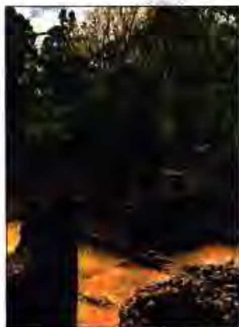
Расми 234. Вайронаҳои масҷид. Ҳабаиштон. Асри XIII.