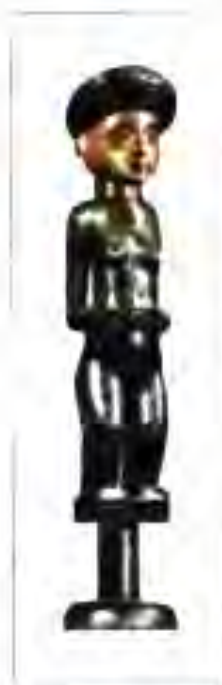
Рис. 228. Ҳайкалчаи биринҷии сарволиди авлод.

Дар асри VII халифаҳои Араб қисмати шимолӣ ва шимолу шарқии қитъаи Африқоро забт карда, дар ин ҷо ҳокимияти худро барпо ва дини исломро паҳн намуданд. Ба ҳайати Хилофати Араб Миср, мамлакатҳои Мағриби Араб ва баъзе мамлакатҳои дигари ин минтақаҳо дохил шуданд. Тобеият ба Хилофати Араб ба пешрафти давлатҳои Африқои Шимолӣ ва Шимолу Шарқӣ мусоидат карданд. Ин буд, ки идораи давлатӣ, хоҷагидорӣ ва илму фарҳанги онҳо рӯ ба пешравӣ ниҳоданд. Баъди барҳам