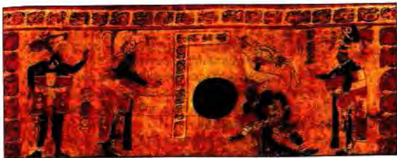
Расми 214. Туббози муурофиавӣ.

медихад. Дар рӯи он образҳои асотири хеле хуб инъикос гардидаанд.