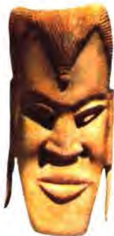
Рис. 231. Ниқоб аз устухони оҷ. Бенин. Асри XVI.

АФРИҚОИ ШАРҚӢ. Дар асрҳои IX-XII дар болооби дарёи Нил, Африқои Ғарбӣ ва Шарқи давлатҳои Бганда, Буноро, Торо, Анколе, Карагва ва Кизиба, дар ғарбии Угандаи имрӯза Руанда ва Урунди вучуд доштанд.