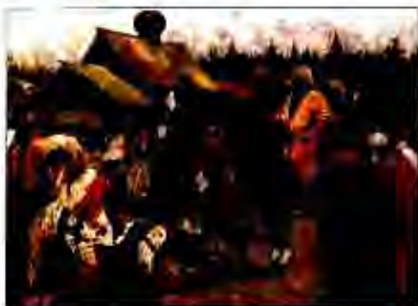
Рисунг 175. Баскакҳои мугул андоз меғундоранд.

Тирамоҳи соли 1240 Ботухон бо лашкари бузурги худ ба самти ҷануби Рус ҳаракат кард, аз Днепр гузашта, ба Киев наздик шуд.