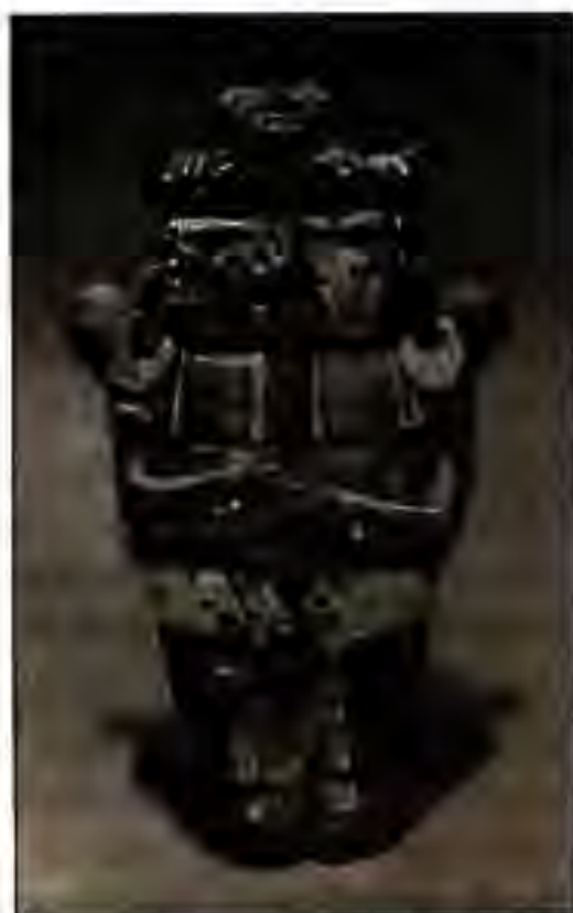
Расми 221. Найтавоз.

"Ана силоҳи ман барои маро бо ду зону шинонидан, вақте ки дар даромадгоҳи деворҳои баланди