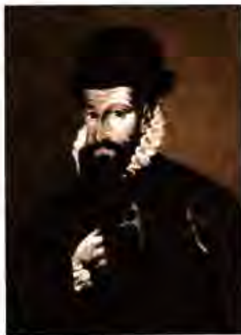
Расми 203. Франческо Писарро.