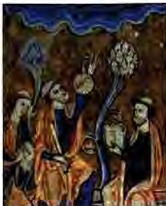
Расми 180. Ситорашинос, риезишинос ва ҳатмат.

Дар асри XV дар Аврупо 65 донишгоҳ мавҷуд буд. Донишгоҳҳои Париж (Фаронса), Болония (Италия), Оксфорд (Англия), Прага (Чехия), Краков (Лахистон) аз ҷумлаи машхуртарини онҳо буданд.