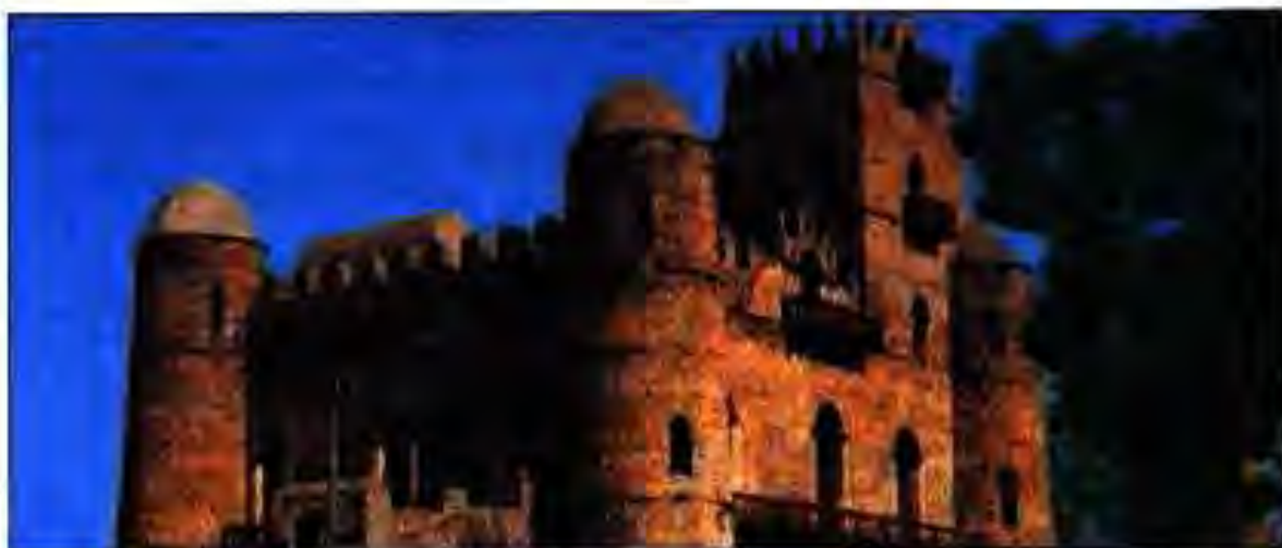
Расми 237. Касри император дар Гондэр. Хабашистон. Асри XVI.

Хабашистон заминҳое буданд, ки "гулт" номида мешуданд. Ин заминҳо барои хизмати давлатӣ дода ва ё тӯхфа карда мешуданд.