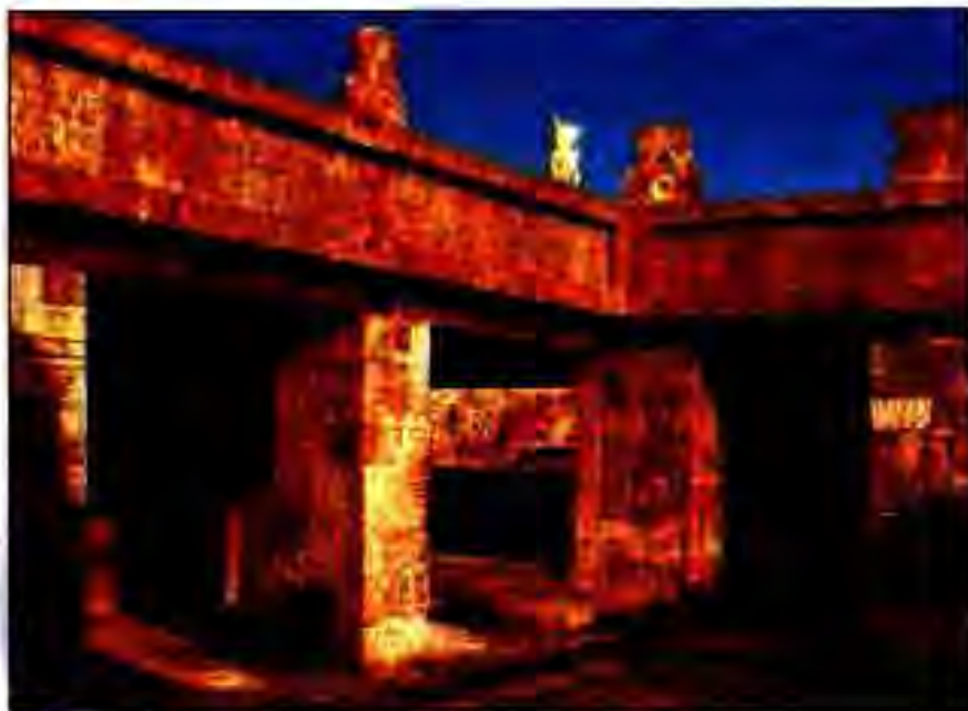
Расми 198. Қасри Кесалпаналотл. Теотиуакан.

Мувофиқи онҳо Мишкоатл пойтахти давлати худро дар Кулхуакан асос гузошта, баъд ба ишғоли водии ғирду атроф шурӯъ мекунад. Тахминан ҳамин вақт ҳамсараш Чималман