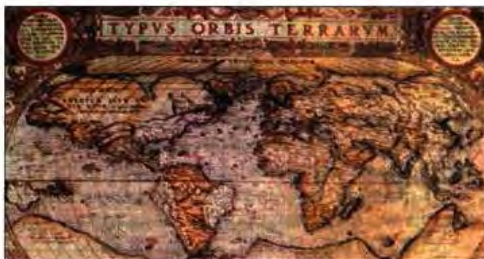
Расми 238. Ҷуғрофҳои асримеёнагӣ харитани ҷаҳонро чунин тасвир намудаанд.