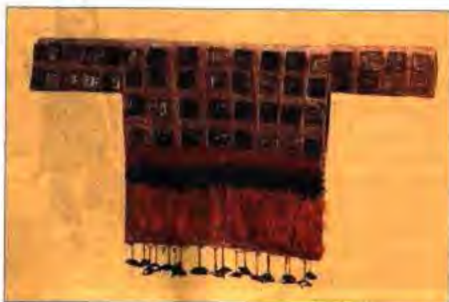
Расми 216. Яке аз намуди куртаи ҳиндиён.

Чандто либоси ҳиндиёнро шумо дар ин расмҳо мебинед. Онҳоро мушоҳида карда бигӯед, ки кадом ҷиҳатҳояш ба сару либоси мардуми Ғарб ва Шарқи имрӯза монанд ҳастанд ва ё фарқ мекунанд.