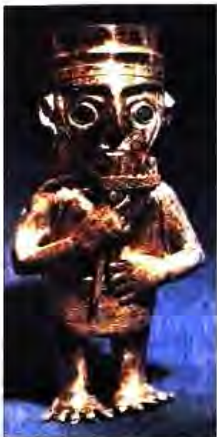
Расми 222. Мусиқачи нукрагин.

қасри бузург пайдо мешавам. Хохиши ягонаи ман – ин ба таназзул рӯ ба рӯ гардидани бузургии ҳокимии ту, давлати ту мебошад. Хохиши ягонаи ман гардану рӯятро захмдор, ба ҳок яксон кардани қалъаю деворҳо мебошад".