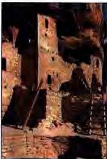
Расми 192. Шаҳри анасазиҳо дар Маса.

Барои ишғоли заминҳои ҳиндиён дар асри XVIII рақобат дар байни англисҳо ва фаронсавиҳо пурзӯр мешавад. Дар чунин шароит ирокезҳо ба англисҳо ва алгонкиҳо ба фаронсавиҳо пайвастанд. Дар ниҳояти ин низоъ англисҳо ва фаронсавиён фоида бардоштанд, яъне заминҳои Конфедератсияи Ирокезҳо аз худ карданд.