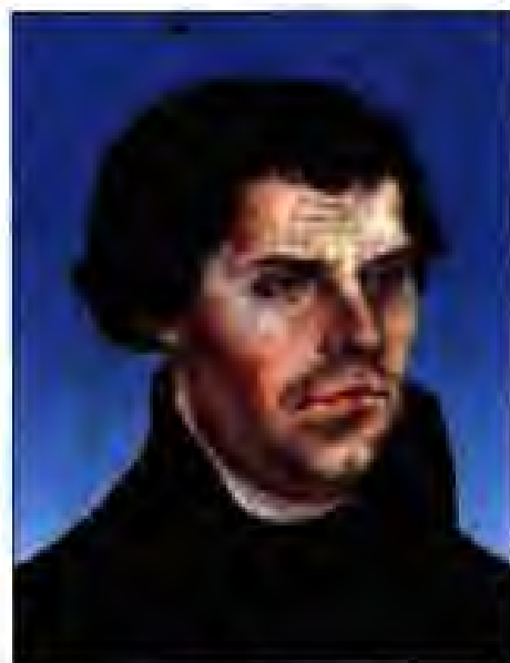
Расми 184. Мартин Лютер.

Тарафдорони ислоҳоти калисоро протестант (эътирозгар) ва калисои навро протестантӣ меномиданд.