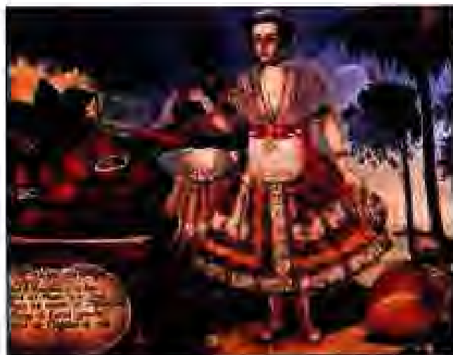
Расми 200. Сокинони нави Америка – сафедпӯст ва зангӣ.

Баъд аз он ки Америго Веспуччи оид ба қитъаи нав ба аврупоиён хабар расонд, ҳукумати Испания ба Америка паси ҳам экспедитсия равон кардан мегирад. Акнун дар назди ин экспедитсияҳо вазифаҳои нав гузошта шуда буданд. Аз он ҷо бояд тилло пайдо намоянд ва ҳиндуёнро ба ғуломӣ таъдил диҳанд. Бинобар ҳамин сабаб ба ҳаёти экспедитсияҳои нави ис-