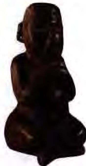
Расми 193. Ҳайкалчаи олмаки аз Вашиктули (Гватемалаи ҳозира).

Баъди сарсонӣ саргардонҳои зиёде мешикҳо боз ба ватани худ – наздикии қули Тескоко баргашта, сокин шудаанд. Онҳо соли 1325 дар ҳамин ҷо деҳае бунёд карданд, ки бо мурури замон ба Мехико – Теночтитлани бузург табдил ёфт. Дар номи ин шаҳр номи пешвоёни бузурги мешикҳо – Мешу ва Теноча абадӣ гардидааст.