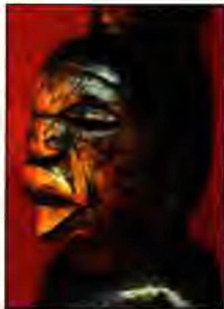
Расми 229. Тасвири намоёндаи ниёгон. Конго.

Дар асрҳои миёна дар наздикии кӯли Чад давлатҳои зиёд мавҷуд буданд, ки дар байни онҳо Канем ном давлат пурзӯртар буд. Он дар асри IX таъсис ёфта, то асри XIII қаламрави бузургро дар бар гирифта, ба маркази муҳимми тиҷоратӣ фарҳангӣ мубаддал гардид. Баъдтар ин давлат Борну ном мегирад. Давраи гулгулшукуфии Борну ба солҳои 1570–1603, ки он вақт Идриси III ҳукмронӣ карда буд, рост омадааст.