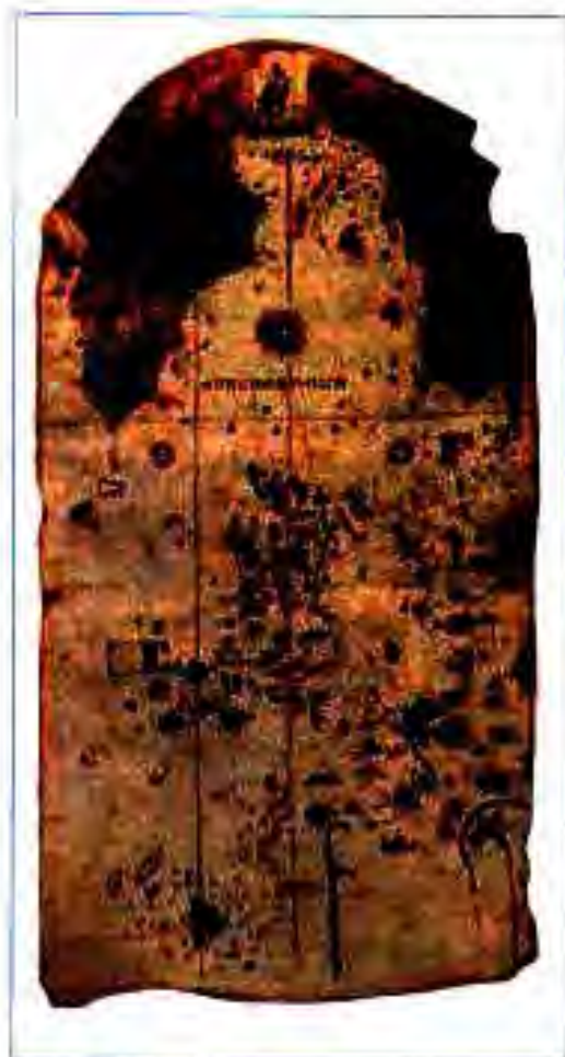
Рис. 199. Харитаи баҳрии соли 1500.

Дар оғози асрҳои миёна дар ин уқёнус киштиҳои келтҳо, баскҳо ва скандинавиҳо пайдо мешаванд. Давлатҳои алоҳидаи