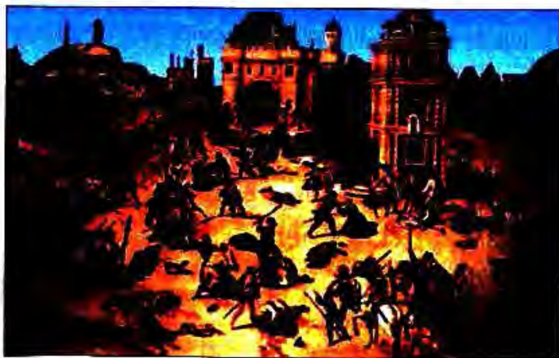
Расми 189. Манзараи қуштори Шабӣ Варфоломей.

АВЧИ ИНКВИЗИТСИЯ. Инквизитсия дидаю дониста, дар Испания ба бедодгарии зиёд роҳ дод. Дар гулхан сӯзондани мулҳидон "аутодаф" ном гирифта буд. Қатли мулҳидон дар майдони марказии шаҳр, дар ҳузури издиҳоми калони одамон ва бо