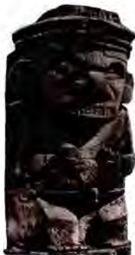
Расми 226. Ҷини сангир (аз Колумбия ҳозира ёфта шудааст).

Робитан байни олами миёна ва Хонаи паче – осмон бошад, тавассути миёнаравии Инка муқаррар карда мешавад. Дар ин маврид ӯ вазифаи Инчу чурина, яъне писари Офторо иҷро менамояд.