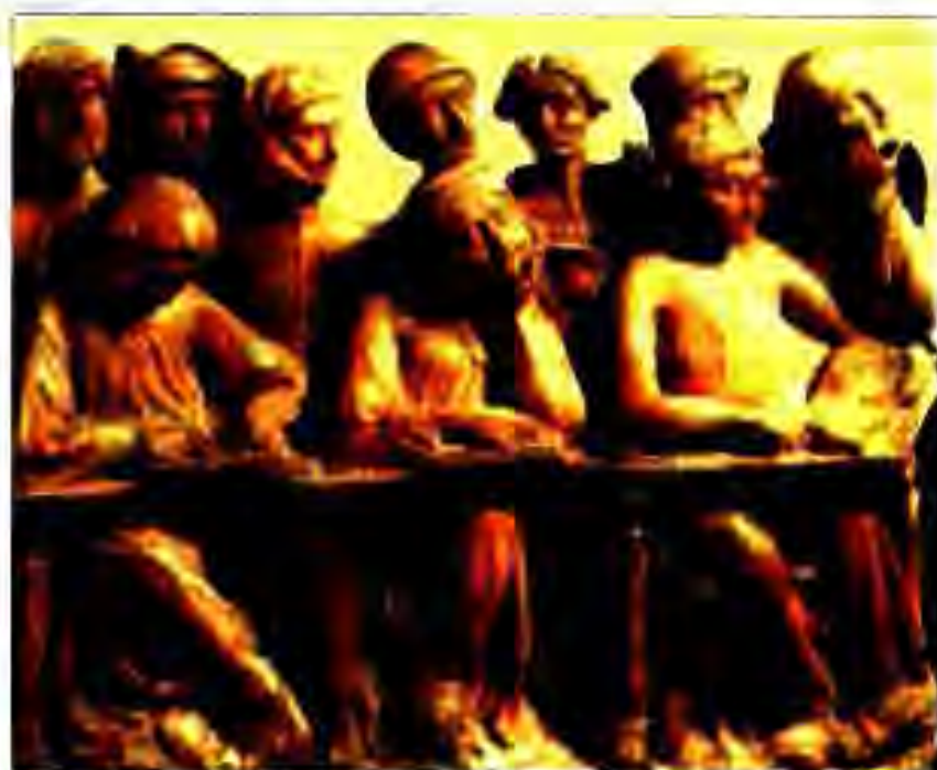
Расми 179. Донишҷӯён ҳангоми машғулият. Асри XIV.

Дар асри XIII дар баъзе мамлакатҳои Аврупо аввалин мактабҳои олий – донишгоҳҳо ҳам таъсис ёфтанд. Донишгоҳҳо асосан дар шаҳрҳои бунёд меёфтанд, ки шумораи аҳолиашон бисёр бошад. Дарҳо дар ин донишгоҳҳо бо забони латинӣ сурат