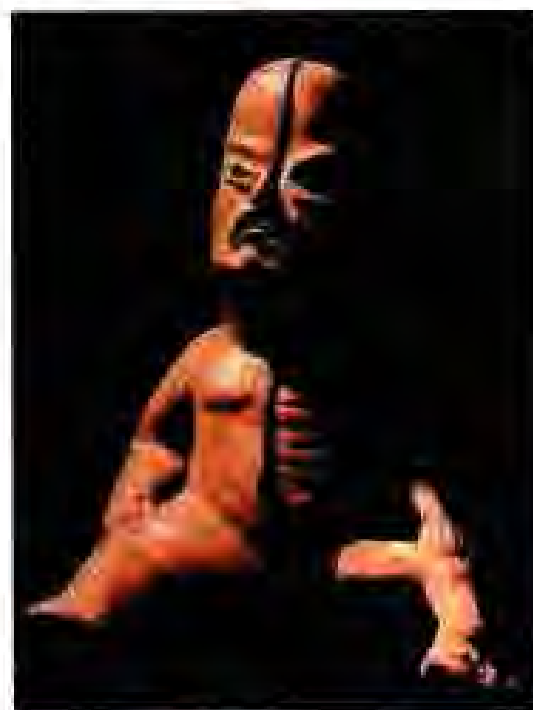
Расми 207. Таълимоти фалсафии америкониёни қадим ва асрҳои миёна дар бораи дугунагии дониш.