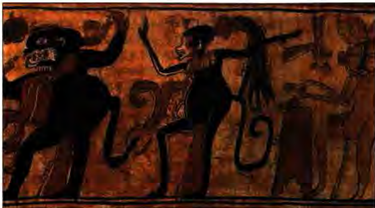
Расми 224. Худоҳо рақс мекунанд. Аз Майя.

Мувофиқи тасаввуроти тараскҳо Кайҳон аз се ҳамвори дар болои ҳамдигар истода воқеъ мебошад. Ҳар кадоми онҳо марказ дорад ва ба ҷониби чор самт – чор мамлакати Олам нигоҳ мекунад. Ҳар кадоми онҳо марказ доранд ва ба ҷониби чор самт – чор мамлакат ҳаракат мекунанд. Ҳар яки чор мамлакати Олам дорои худо – ҳомии ранги муайян дошт: дар шимол худои Зарди Ҳосилот; дар ҷануб худои Сиёҳ – ифодагари офтоб ва дузахи фуромадаистода; дар шарқ худои Сурхи Зухро ва бахр; дар ғарб худои Сафед – Ситораи Шаб ва ҳомии шамол.