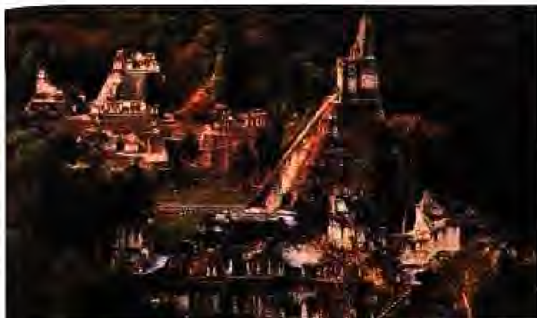
Расми 195. Акрополи марказии Тикали.

ИМПЕРИЯИ ИНКҲО. Дар бораи пайдоиши империяи Инкҳо ривоятҳо бисёранд. Мувофиқи яке аз онҳо Манко Капак ном шахс ва хохари ӯ хоҳиш ва иродаи падарашон – Офтоб – Интиро ба ҷо оварда, аз кӯли Титикака берун баромаданд, то ки ваҳшиёнро ба роҳи инсонӣ ворид карда, империяи бузурги Инкро бунёд созанд. Онҳо гӯё, ки аз падари худ гурзи калони тиллоии сеҳрноке мерос гирифта буданд. Дар рӯи он ҷои бунёди пойтахти ояндаи давлати Инкҳо нишон дода шуда буд.