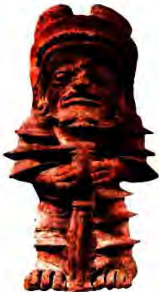
Рисунг 225. Рухонӣ бо ҷӯбдастани муқаддас, ҳангоми иди киштукор.

Мардуми Теотиуакан боварӣ доштанд, ки дар шаҳри онҳо море мӯъчизавор парвоз карданро ёд гирифтааст. Дар ин ҷо шахс ҳукуқи тавассути ботин ба хирад ноил шуда ва дар Кайҳон вучуд доштанро пайдо менамояд.