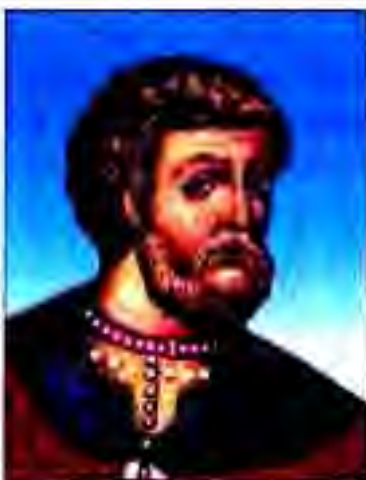
Рисунг 176. Дмитрий Донской.

ОЗОДШАВИИ РУС. Дар тӯли асрҳои XIII-XV князҳои Рус ба муқобили истилогарони Мугул мубориза мебариданд. Вале дар аввал дар ин мубориза на ҳамаи князҳо ғайбона иштирок мекарданд. Ниҳоят, ташаббуси мубориза бар зидди мугулҳоро