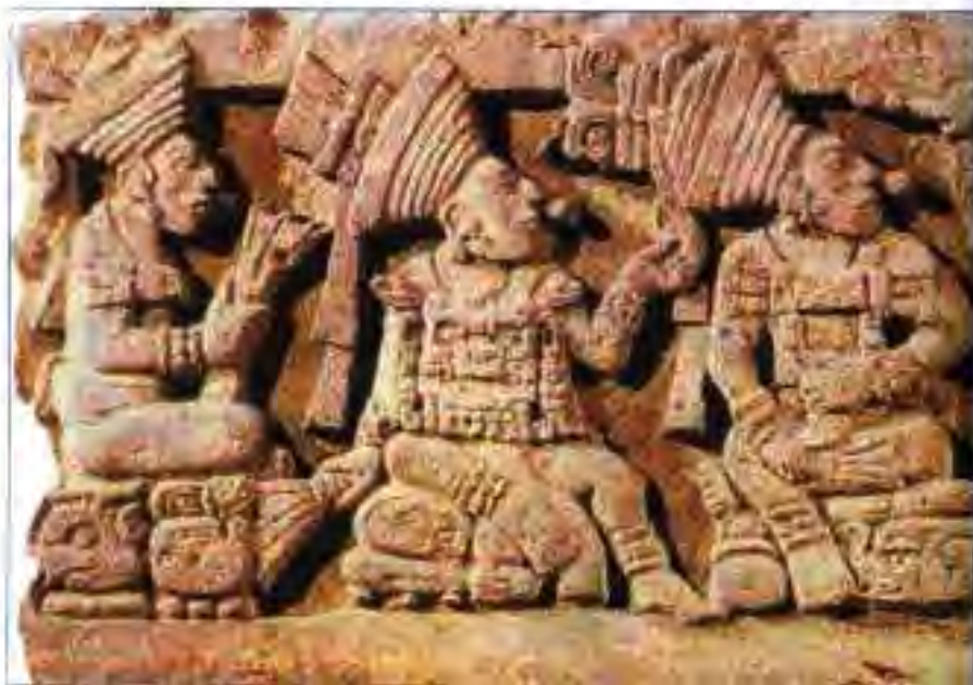
Расми 205. Нақши муқарнас. "Анҷумани мутафаккирон". Иштирокчиён дар даст ба китобҳо тасвир ёфтаанд.

Вале дар минтақаҳои алоҳидаи Америка гурӯҳҳои нисбатан хурдтари забонҳои дигар ҳам вуҷуд доштанд. Масалан, дар Юкатан забони майя, дар Чапал забонҳои лакондон, селтал ва сотсил, дар Табаско забони чаптал, дар Гватемала забонҳои какчикел, сутухил, киче, кекчи, покомам, поконтти, мам, агусток,