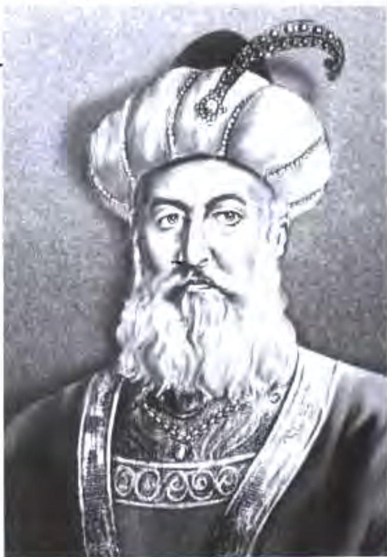
Султон Ғиёсуддини Ғури

Ғазнавиён дар таърихи зиёда 180-солаи ҳукмронияшон бори нахуст шикаст хӯрда, пойтахтро монда фирор мекунад. Султон Сайфуддини Сури ба тахт соҳиб мешавад, вале Баҳромшоҳ зимистони ҳамон сол бо лашкари хеле зиёд бозгашта, галаба мекунад. ӯ Сайфуддини Суриро асир гирифта, бо азобу шиканча ба қатл мерасонад. Ин амалиёти ваҳшиёнаи Баҳромшоҳ каҳру газаби Шансабониёро дучанд мекунад. Бародари дигар Шаҳобуддин фавран ба муқобили Ғазнавиён лашкар кашада, Ғазнаро фатҳ менамояд. Ин галабаи бузургтарини Шаҳобуддин (соли 1150) бар Баҳромшоҳи Ғазнавӣ буд. Бо амри ӯ шаҳри Ғазна ба оташ дода мешавад. Аз хамин сабаб вай лақаби «чаҳонсӯз»-ро мегирад. Ниҳоят, Ғуриён давлати пурзӯртарини замон, яъне давлати Ғазнавиёро, ки зиёда аз 180 сол ҳукмронӣ карда буд, барҳам доданд. Баъд аз ин Ғуриён дар охири асри XII ба лашкари Салҷуқиён зарба заданд. Дар натиҷа ҳудуди давлати Ғуриён васеъ шуд. Ба ҷуз ин, онҳо тамоми мулкҳои дар Ҳиндустон доштаи Ғазнавиёро тасарруф намуданд. Соли 1186- Шаҳобуддини Ғури шаҳри Лохурро гасб намуда, онро пойтахти давлати Ғуриён эълон кард. Бародари ӯ Ғиёсуддин Муҳаммад Хуросонро ҳам ба даст даровард, вале байни ӯ ва шохони Хоразм ҷанги сахте ба вуқӯъ пайваст.