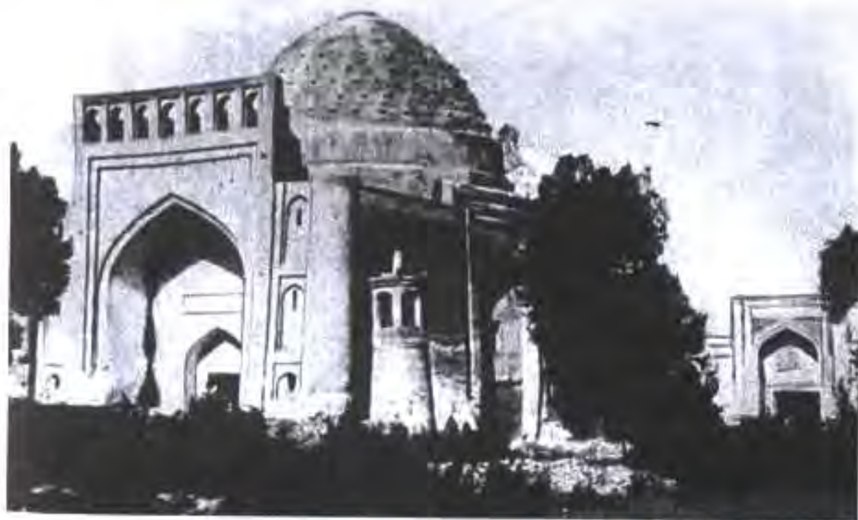
Макбараи Сайфуддини Бохарзӣ. Бухоро. Асри XIV.

Макбараи Сайфуддини Бохарзӣ (дар наздикии Бухоро) яке аз иморатҳои мӯхташами замони мугулҳо ҳисоб меёбад. Сайфуддини Бохарзӣ аз ашрофони дин буд ва ўро ҳатто мугулҳо низ эътироф менамуданд. Макбараҳои асри XIII ва нимаи аввали асри XIV хеле зиёданд ва онҳо аз санъати меъморӣ ҳамон давра дарак медиҳанд. Макбараи