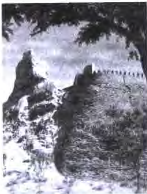
Боқимондаҳои девори Бухоро

Мовароуннахру Хуросон борхо хароб гардида буд. Арабхо соли 709 Бухороро забт намуда, ними хавлиҳои сокинони Бухороро зӯран кашада гирифтанд ва ҳатто мардуми зиёди шаҳрро ронда, ба ҷои онҳо қabilaҳои арабро шинонданд. Умуман дар бисёр шаҳрҳои давлати Сомониён арабхо зӯран маскан гирифтанд. Аммо дар аҳди Сомониён вазъият тағйир ёфт. Ба тӯфайли робитаҳои тиҷоратӣ ва аз ҳар ҷиҳат тараққӣ ёфтани давлат ҳаёт нисбатан орому пойдор гардид.