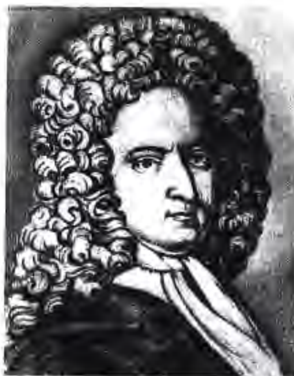
118. Даниел Дефо

Адабиёт. Дар асри XVIII ва нимаи аввали асри XIX адабиёти Аврупо ба муваффақиятҳои беназир ноил гардид. Шоирону нависандагони ҳақиқатнигоре ба майдон омаданд, ки дар асарҳои худ ҷиҳатҳои бадунеки ҷомеаро реалистона (воқеъбинона) тасвир мекарданд. Мардумро тавассути асарҳои худ ба мубориза барои ояндаи нек, озодӣ ва пешравиӣ ҷамъият баъват мекарданд. Образҳои манфии асарҳои онҳо нафрати мардумро ва образҳои мусбат шавқу завқ ва хоҳиши пайрави кардани хонандагонро ба вучуд меоварданд.