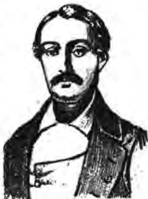
107. Джузеппе Мадзини

Дар Итолиё солҳои 1747-1748 вазъияти инқилобӣ ба амал омад. Дар