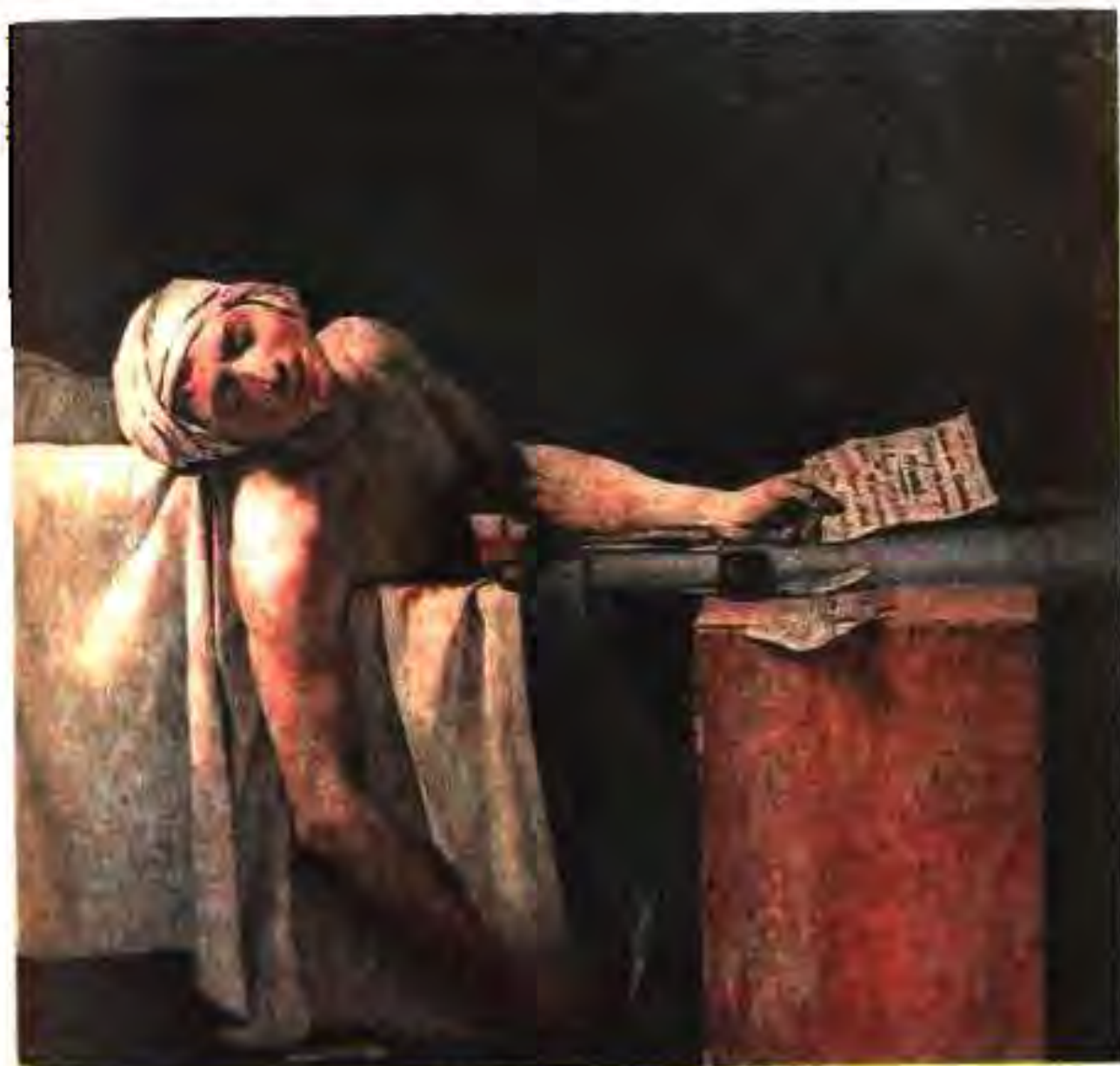
128. Ж.Л. Давид. Марги Марат

Расмҳои Ж.Л.Давид «Савганди Горатсийҳо» ва «Марги Марат» дар вучуди кас ҳаяҷонро ба вучуд меоваранд.