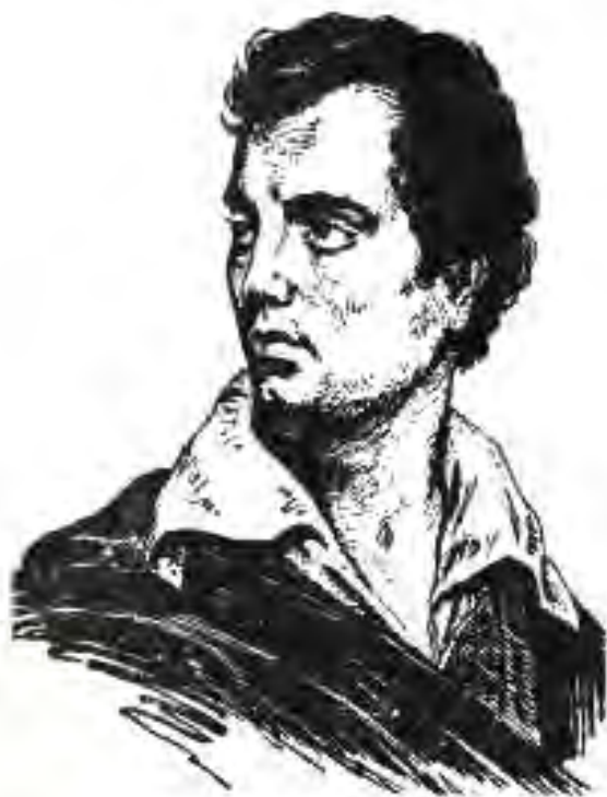
123. Чорч Байрон