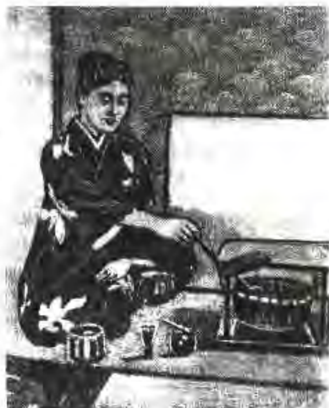
134. Тайёрии хонуми чопонӣ ба чойнӯшӣ

Дигаргуниҳои калон дар адабиёт ба амал омаданд. Дар байни адабиёти асримиёнагӣ ва адабиёти нави тамоили реалистӣ чузби пайваस्तкунандаи онҳо асарҳои шуданд, ки тавассути алифбои ҳиҷоӣ навишта шуда буданд. Вале чараҳои ҳақиқии демократии адабиёт укиётсозӣ мебошад, ки асосгузори он Ихара Сайкаку (1642-1693) буд.