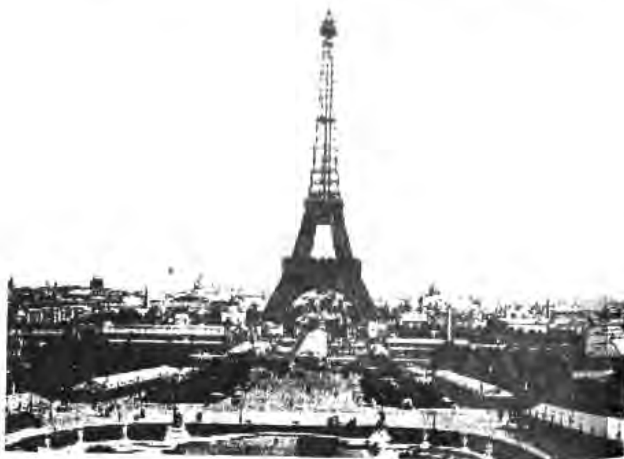
129. Париж. Манораи Эйфел

Дар Ҳоланд, Олмон, Лахистон ва як қатор мамлакатҳои дигари Аврупо ва Америкаи Шимолӣ тарзи дигари сохтани қасрҳо ва калосоҳо ба ҳукми анъана даромада буд. Чунин биноҳоро ниҳоят пуршукӯҳ, гумбаздор ва бо нақшу ниғори зебо сохта, зебу