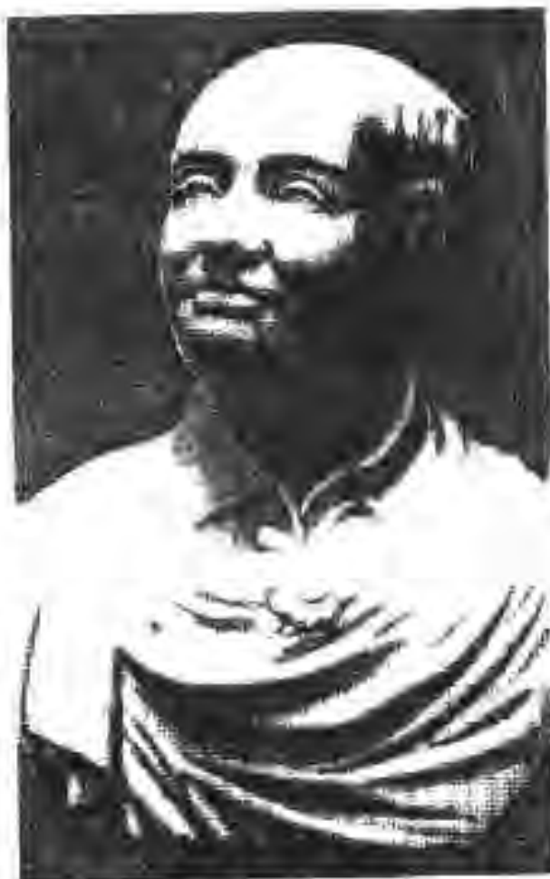
116. М.В. Ломоносов

Аз тарафи бародарони фаронсавӣ Монголфъҳо ихтироъ карда шудани кураи ҳавой имконият фароҳам овард, ки азростатҳо сохта шаванд. Дар Фаронса ҳангоми инқилоби буржуазии охири асри XVIII азростатҳо бо мақсади ҳарбӣ истифода бурда мешу-