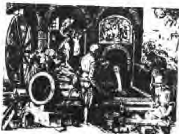
113. Корхонаи тўпсозӣ

ҷўяни моеъ мегудохтанд. Дар он ҷо барои ҳаво пуф кардан насосҳои пуриктидорро ба кор мебарданд.