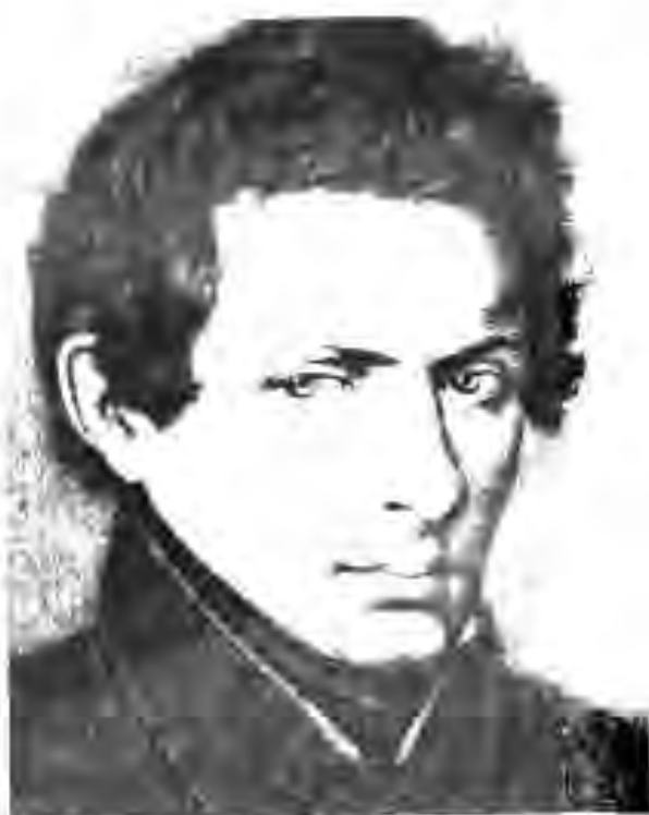
115. Н.И. Лобачевский

ро дуруст муайян карда, аз рӯи он соли 1846 мавҷудияти яке аз сайёраҳои системаи офтобӣ – Нептунро исбот карданд. Олимон пешакӣ ҳисоб карда баромадани вақти хусуфи Офтоб ва Моҳро ёд гирифтанд.