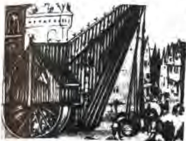
112. Борбардор дар бозори Брюгге