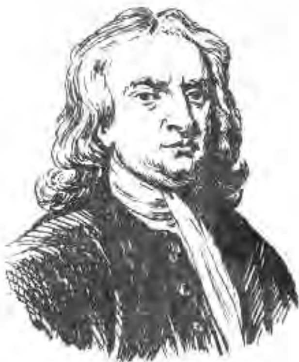
114. Исаак Нютон