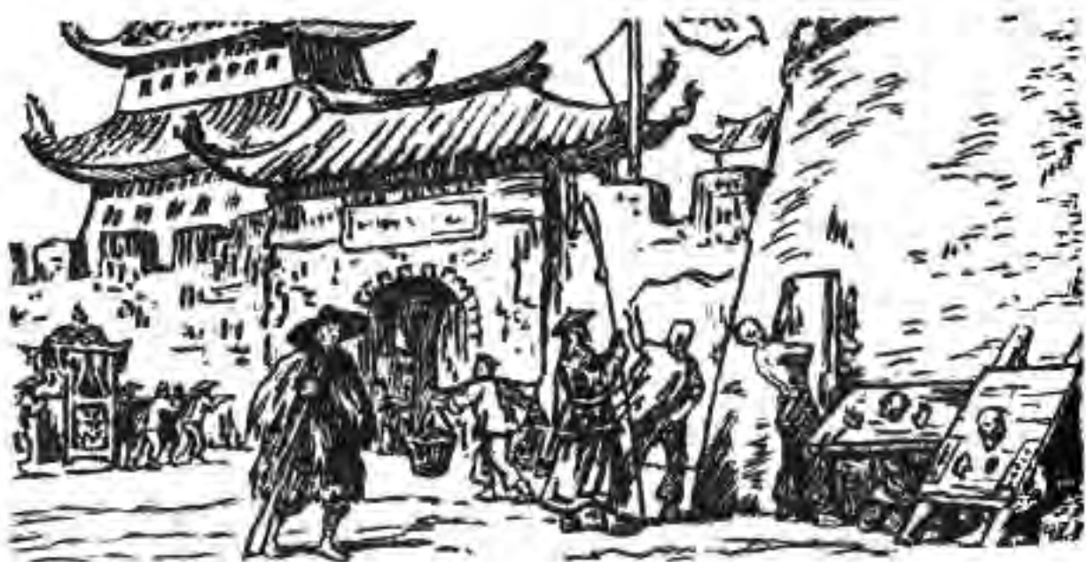
131. Манзараи даромадгоҳи яке аз шаҳрҳои Чин

Барои бо роҳи дипломатӣ ҳал намудани мақсадҳои худ корони Англия Георг III соли 1793 Макартнейро бо номае ба ин ҷо мефиристонанд. Императори Чин Тоянлин ба корони Англия номаи ҷавобии ҷавобаландона менависад. Ин сафорати Англия бенатиҷа анҷомид. Соли 1818 ҳукумати Англия бори дуум ба Чин