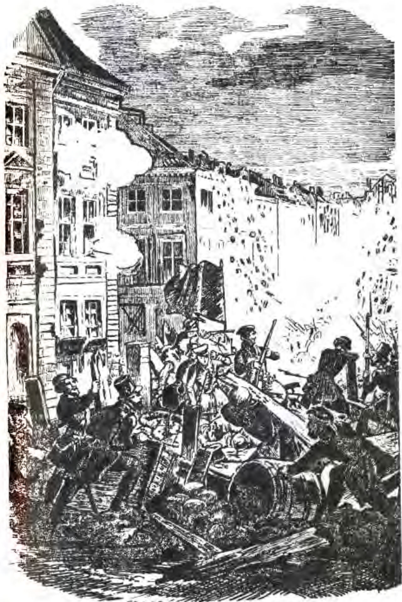
106. Моҳи марти соли 1848. Шӯриш дар Берлин