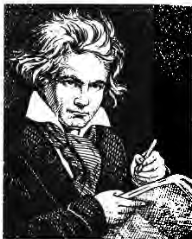
127. Людвиг ван Бетховен

гиаш бо клавесин оҳанг менавохт. Дар 6- солагиаш концерт нишон дода, дар 11- солагиаш операи аввалини худро навиштааст. Дар 14- солагӣ узви Академияи мусикии Болонъеи Итолиё интихоб шуд. Мотсарт соли 1791 дар синни 35 -солагӣ вафот кардааст. Бо вучуди ҷавон будан ӯ асарҳои зиёди баландгоя эҷод кардааст. Операҳои ӯ «Дон Жуан», «Зангирии Фигаро» ва ғайра ханӯз ҳам дар катори беҳтарин асарҳои классикии ҷаҳонӣ буда, барномаҳои бисёр театрҳои мамлакатҳои ҷаҳонро оро медиҳанд.