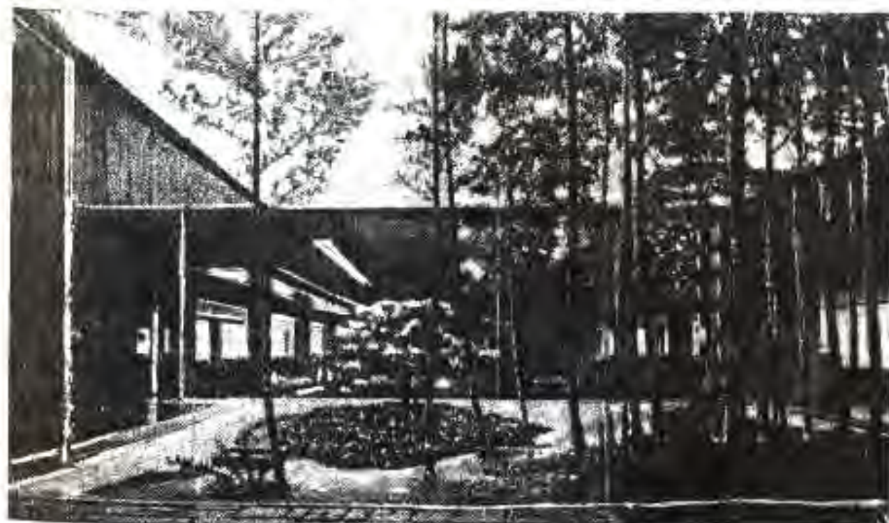
135. Боғдории манзаравии чопонӣ

Театр дар Чопон таърихи чандинасра дорад. Соли 1675 дар Киото ва соли 1684 дар Осака театрҳо кушода шуданд. Дар сахнаҳои ин театрҳо ва театрҳои дигари Чопон асосан асарҳои драматурги бузурги мамлакат Тикаматсу Мондзаэмон (1653-1725) гузошта мешуданд. Мардуми Чопон санъати театриро хеле дӯст