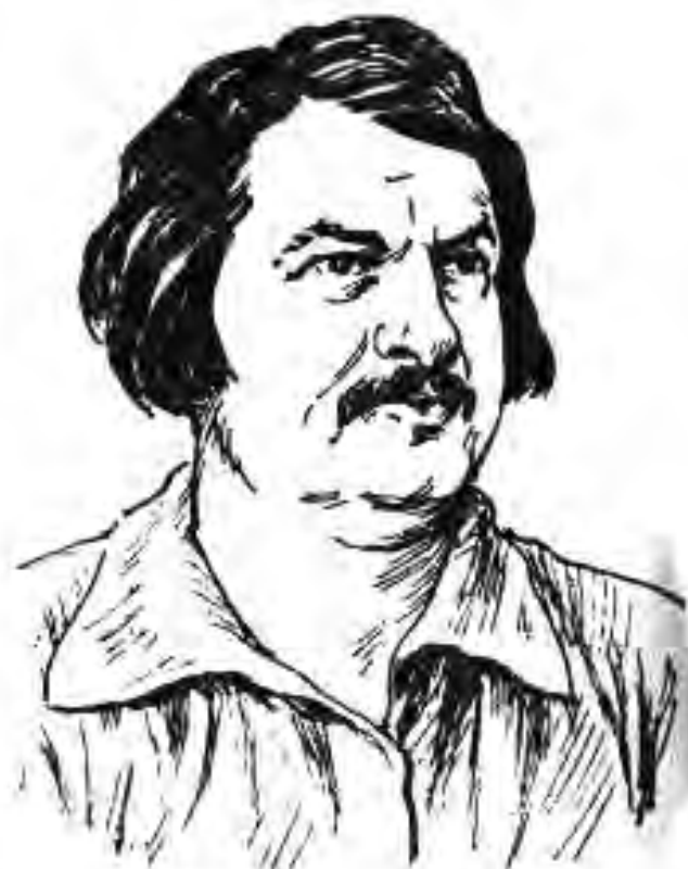
122. Оноре де Балзак

Мо чунин андешаҳои ӯро пеш аз ҳама дар романи «Фауст» мебинем. Қаҳрамони асар Фауст барои ҳалли масъалаҳои муҳим, аз қабилӣ маънии ҳаёт чист, вазифаи одам аз ҷӣ иборат аст, камар мебандад. ӯ ҳатто қонашро мефурӯшад, то ки ба ин саволҳо ҷавоб ёбад. Вале Фауст бахтро дар ҳеҷ чиз наёфта, дар дами марг ба ҳулосае меояд, ки маънии ҳаёт дар қорнамоӣ ва мубориза аст.