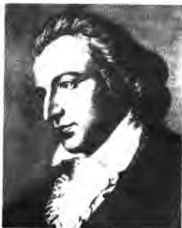
120. Фридрих Шиллер

Свифт (1667-1743) диққати хонандагонро ба худ ҷалб мекунад. Ӯ бо баҳонаи тасвир кардани мамлакат ва ҳаёти лилипутҳо иллатҳои ҷамъияти замони худро ба зери танкиди саҳт гирифтааст. Муаллиф дар асараш ба муқобили дурӯғу риёкорӣ, зулми золимон ва таъкиби одамон баромадааст.