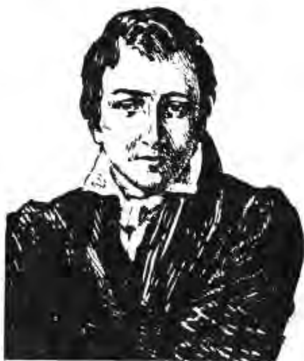
124. Генрих Гейне

Санъат. Бастакорон. Мусикӣ яке аз санъатҳои қадимтарин буда, ба инсон хурсандӣ ва илҳом мебахшад. Одамон тавассути мусикӣ хурсандӣ ва андӯхи худро ифода мекарданд. Дар замонҳои қадим, ки ҳанӯз нота вучуд надошт, мусиқчиён онро аз насл ба насл мерос мегузоштанд. Пайдо шудани нота кори мусиқчиёну бастакоронро хеле осон кард. Минбаъд мусикиро барои наслҳои оянда дар қоғаз сабт менамуданд. Мусиқчиён оҳангҳои аз тарафи бастакорон офаридашударо аз рӯи нота иҷро мекарданд.