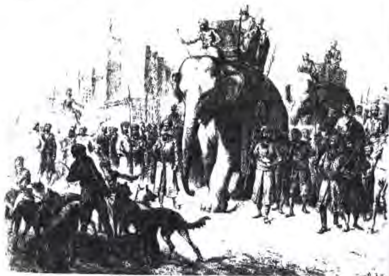
138. Яке аз ҳокимони ҳиндӣ бо аҳли рикоби худ ба назди халқ мебарояд

Мухориба дар Панипат равандҳои иҷтимоӣ ва иқтисодӣ ва сиёсӣ дар ҳаёти Ҳиндустони даҳсолаҳои қаблӣ ба амаломадаро ҷамъбаст кард.