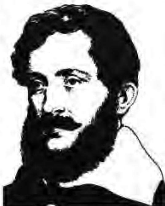
110. Лайош Кошут

Моҳи апрели соли 1849 император Франс Иосиф аз шоҳи Русия Николаи I ёри ҷарбӣ пурсид. Моҳи май шоҳи Русия бо императори Австрия дар Варшава вохӯрда, нақшаи ҳуҷум ба Маҷористонро кашиданд. Моҳи июн лашкари Русия бо сардории княз Паскевич ба Маҷористон ҳаракат кард. Лашкари Маҷористон аз қувваҳои ҷарбии Русия ва Австрия шикаст хӯрда,