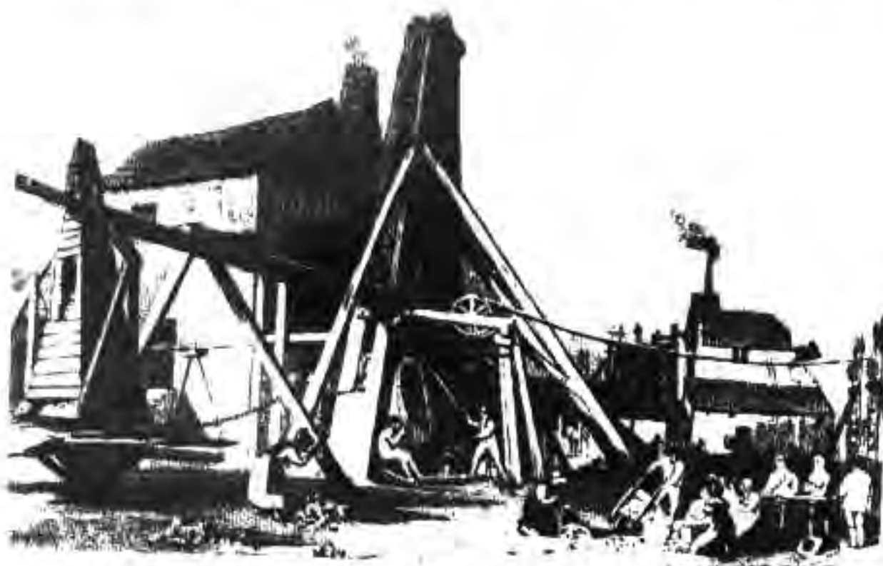
111. Заводи чӯянғудозии Англия дар солҳои 30-юми асри XIX

Коркарди фулузот низ такмил ёфт. Дар нимаи дуюми асри XVIII дар Англия тавассути кокс ва ангишт дар печҳои домнагӣ