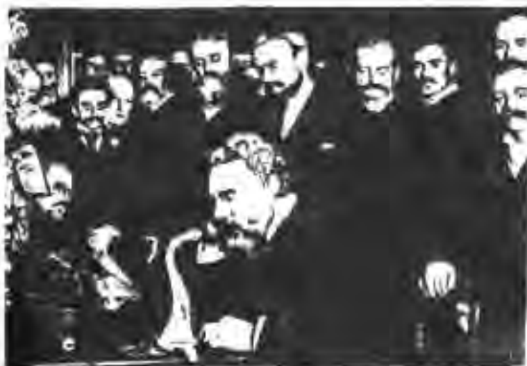
117. Мухобираи телефони А.Белл

зе ва дастгоҳи харфчопкунӣ ҳам ихтироъ карда шуданд. Чунин ихтироотҳо дар алоқа инқилоб ба вучуд оварданд.