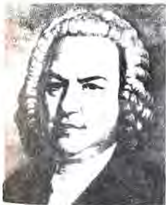
125. Иохан Себастьян Бах

Мотсарт, Волфганг Амадей Мотсарт (1756-1791) дар 4-сола-