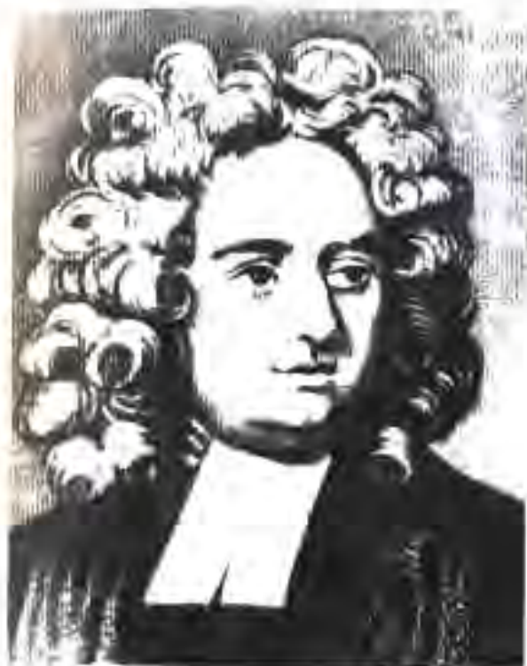
119. Ҷонатан Свифт