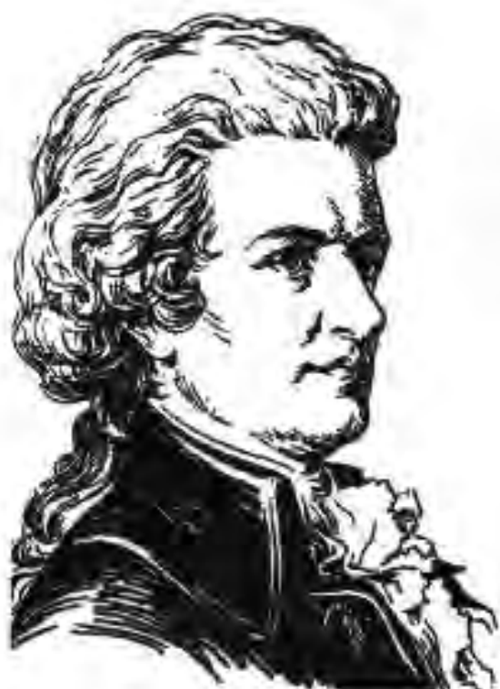
126. Волфганг Амадей Мотсарт