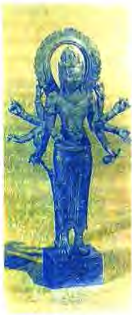
137. Ҳайкал. Аз Яваи Марказӣ

Халқи Индонезия дар санъат низ комёбиҳои назаррас ба даст овард. Ҳар як халқияти ин мамлакат рақсҳои дӯстдоштаи худро дошт. Дар Бали, Ява ва баъзе навоҳиҳои Суматра унсурҳои рақси ҳиндӣ мақоми ниҳоят баланд доштанд. Дар Индонезия панҷ намуди театр — театри лӯхтаҳои ҳамвори чармин (ваянг кулит), он ҳамчун «Театри сояҳо» (ваянг пурво) низ маълум аст; театри лӯхтаҳои калони чӯбин (ваянг голек); театри актёрҳои никобпӯш (ваянг топенг) ва намуди махсуси театр амал мекарданд. Ин намуди театр (ваянг бебер) бо он фарқ мекард, ки баранда матои печонидашудаи расмдорро кушода истода, мувофиқи матн онро шарҳ медиҳад. Баъдтар дар Индонезия театри актёр (ваянг оранг) ҳам паҳн мегардад.