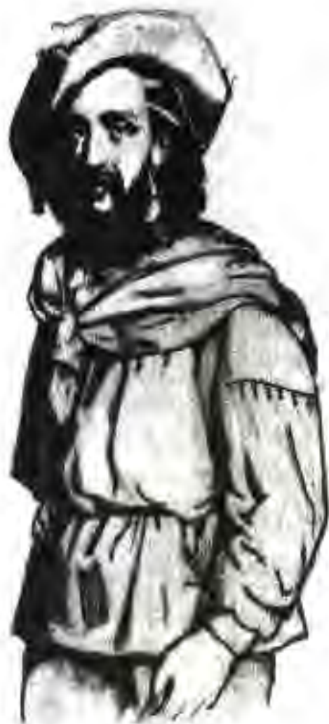
108. Джузеппе Гарибалди