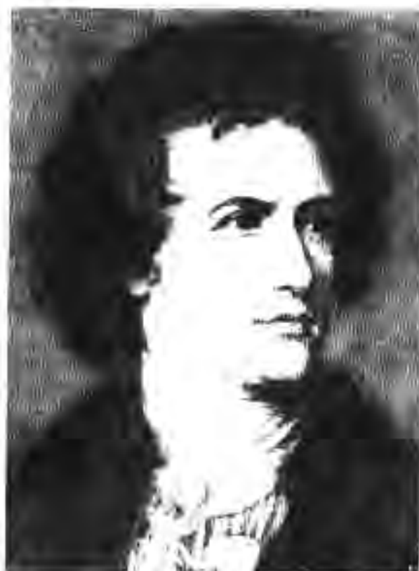
121. Иоханн Волфганг Гёте