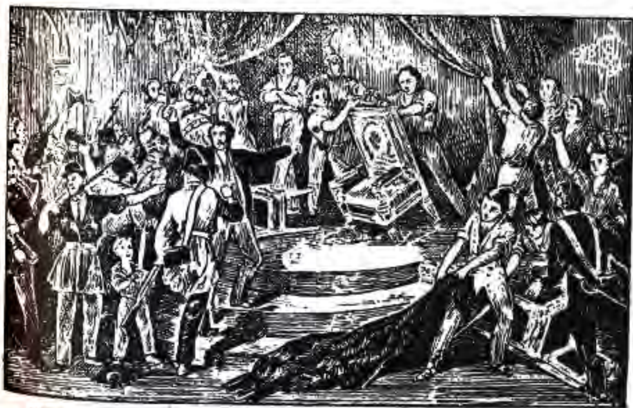
105. Ҳалқ тахти королро ба замин мепартояд. 24 феввали соли 1848.

Шӯриши июн. Аз 4 май ба ҷои Ҳукумати Муваққатӣ Маҷлиси Муассисон ба қор шурӯъ кард. Ин маҷлис аз рӯзи аввали фаъолияташ барои торумори шӯришчиён пинҳонӣ ба тайёри саркард. Коргарон аз Маҷлиси Муассисон талаб карданд, ки Вазорати меҳнат ва рушдро ташкил намояд. Вале он қатъиян ба муқобили ташкил кардани чунин вазорат баромад. Маҷлиси Муассисон чанд қарори зиддиҳалқӣ қабул кард, ки он қаҳру қазаби захирақашони Парижро ба вуҷуд овард. 15 май зиёда аз 100 ҳазор нафар коргарон ба намоиши эътирозӣ баромада, сӯи қасри Бурбонҳо, ки қароргоҳи Маҷлиси Муассисон буд, ҳаракат карданд. Намоишчиён пароканда кардани Маҷлиси Муассисонро талаб карданд. Вакилон хавфро ҳис карда, ба ҳар тараф пароканда шуданд. Намоишчиён аз ин рӯҳ гирифта, ба сӯи бинои Ратушан