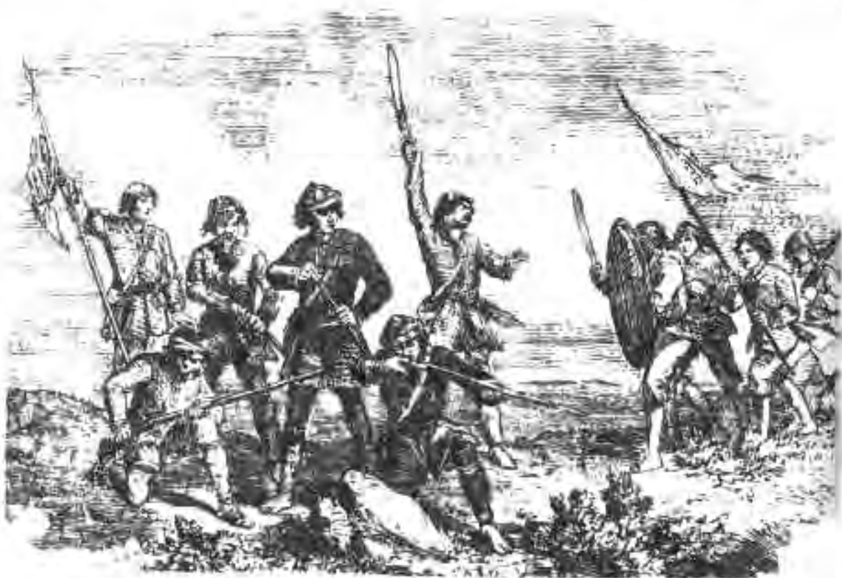
132. Дастаи мусаллаҳи Тайпинҳо

Дар муқобили Тайпинҳо Англия, Фаронса, ИМА ва Русия меистоданд. Дар солҳои 1856-1860 ба муқобили Чин (Тайпин) ҷанги дуҷуми афъюнӣ оғоз меёбад. Хонадони Тсин зидди тайпинҳо