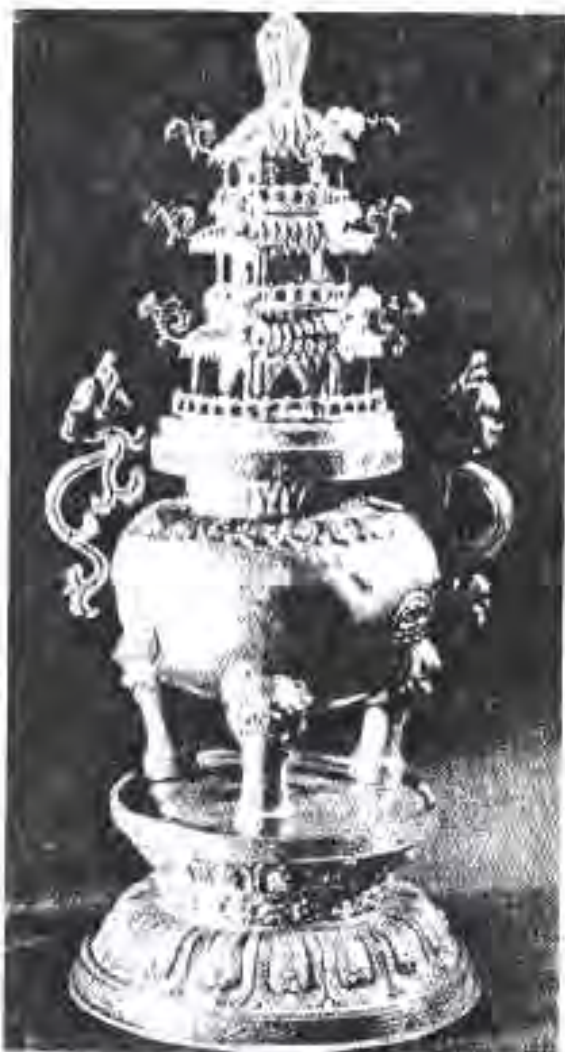
133. Намунае аз санъати амалии мугулҳо

дини буддоиро таҳқиқ намуда, онҳоро аз назари дунявӣ ва рӯҳонӣ инъикос менамуданд. Мувофиқи ин назария ҳокимияти дунявӣ аз ҳокимияти рӯҳонӣ бартарӣ дорад. Ҳокими дунявӣ тамоми масъалаҳоро танҳо бо ҳокимияти худ ҳал мекунад ва ба даҳолати рӯҳонӣён роҳ намедихад.