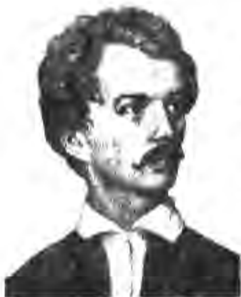
109. Шандор Петефи

Инкилоб дар Мачористон. Муваффакиятҳои шӯришгарони Вена тарқиши инкилобиро дар дигар қисмҳои империяи Австрия тезонид. Халқи маҷор барои ба даст овардани истиқлолият ва озодӣ ба мубориза бархест.