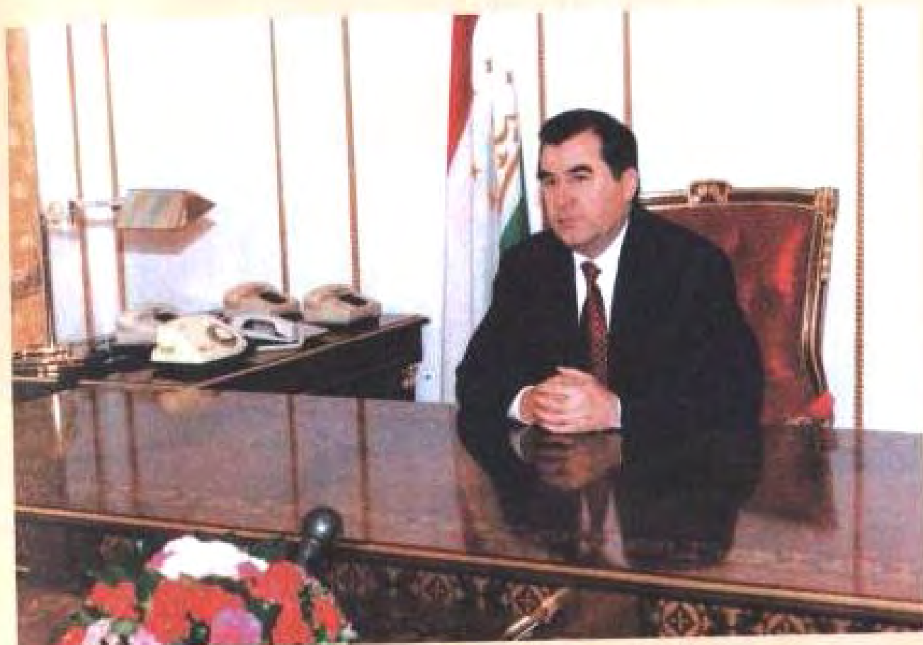
ПРЕЗИДЕНТИ ҶУМҲУРИИ ТОҶИКИСТОН ЭМОМАЛӢ РАҲМОҶОВ