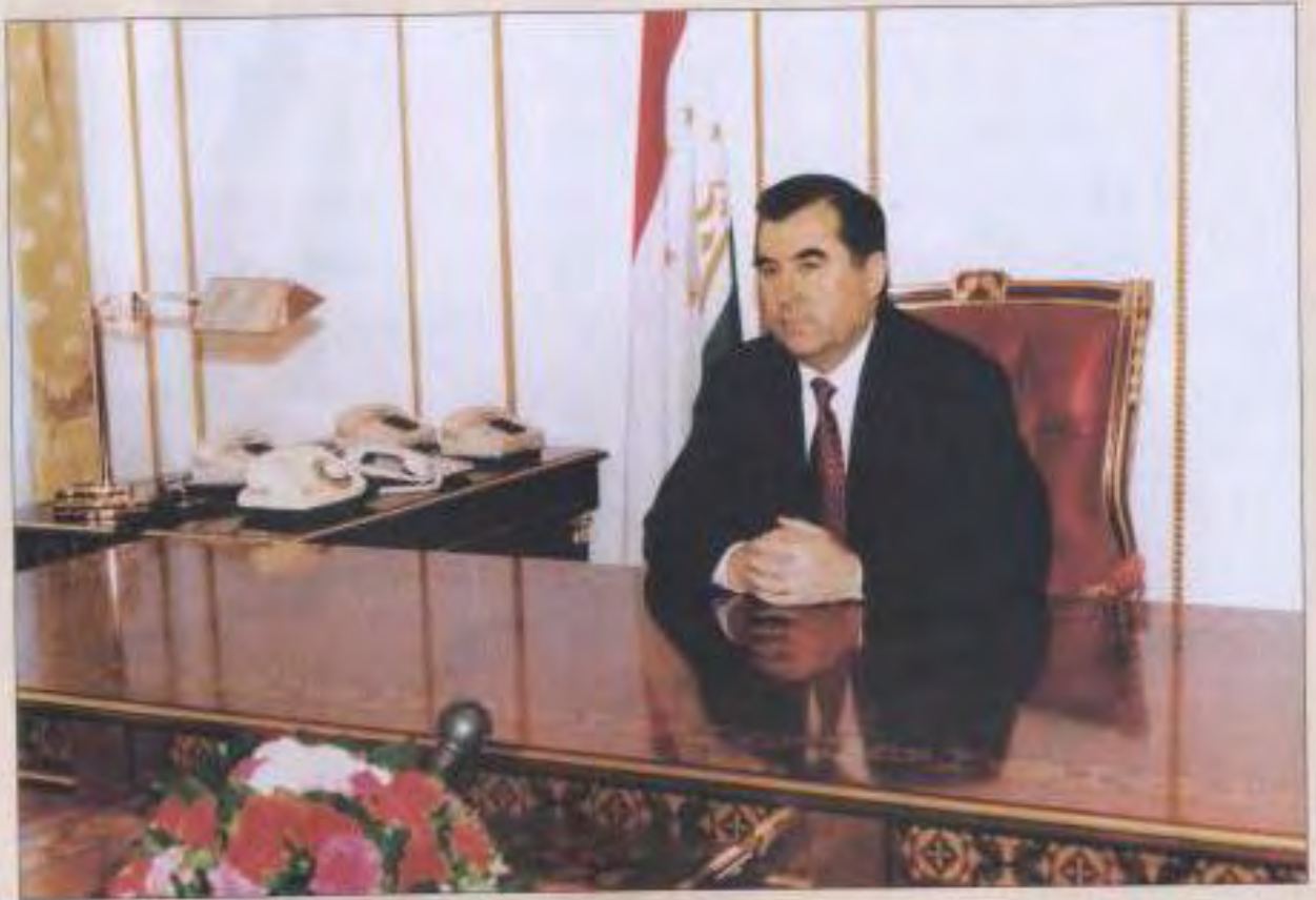
ПРЕЗИДЕНТИ ҶУМҲУРИИ ТОҶИКИСТОН ЭМОМАЛИ РАҲМОНОВ

БИРЖА республики Таджикистан услуги связи и телекоммуникации г. Душанба