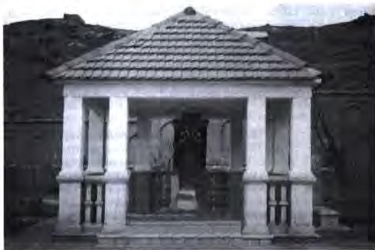
Оромгоҳи Бобур Мирзо /1483–1530/ дар Кобул.

Бобур барои ишғоли чаҳоруми Самарқанд қувваи кофӣ надошт. ӯ ба шоҳи Эрон Исмоил мурочиат намуда, ёрии ҳарбӣ талабид. Тирамоҳи соли 1512 лашкари 60 ҳазорнафараи Эрон бо сардории Начми Сонӣ вориди Мовароуннаҳр гашт. Онҳо ба қучоқе, ки по мегузаштанд, соқинонашро аз дами тег мегузарониданд. Лашкари Эрон дар Қаршӣ қатли ом карда, 15 ҳазор аҳолии онро халок кард. Бинобар ин иттифоқи Бобур бо эронӣён боиси норизоияти аҳолии гардида, нисбат ба ӯ ҳисси нафрат пайдо шуд.