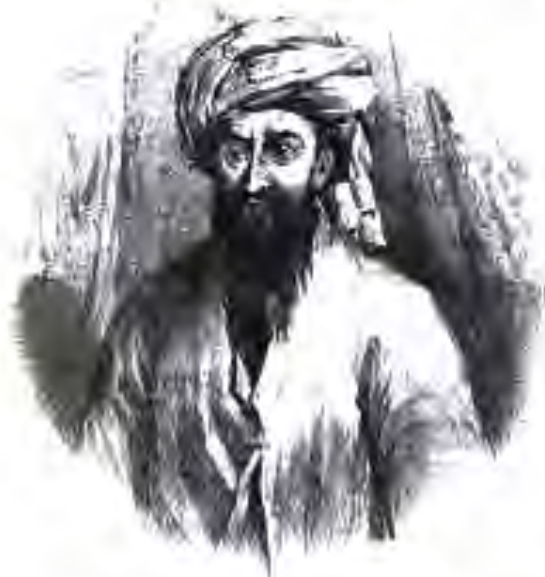
Амир Насрулло (1826-1860)

Насрулло соли 1826 ба тахти Бухоро соҳиб шуда, то соли 1860 ҳукмронӣ намуд. Ӯ феврал се бародари дигари худ — Зубайрхон, Ҳамзахон ва Сафдархонро бо зану фарзандонаш қатл намуда, аз даъвогарони тахти амирӣ худро эмин намуд. Барои асрори ба тахт соҳибшавишро пинҳон доштан, қушбегӣ Ҳакимбӣ низ қатл шуд. Дар давоми як моҳи пас аз ҷилуи худ Насрулло ҳар рӯз 50-100 касро ба қатл мерасонид. Ба ғайр аз инҳо Насрулло дар ибтидои 7-8 соли ҳукмронии худ ҳаман дарбориёни пада-