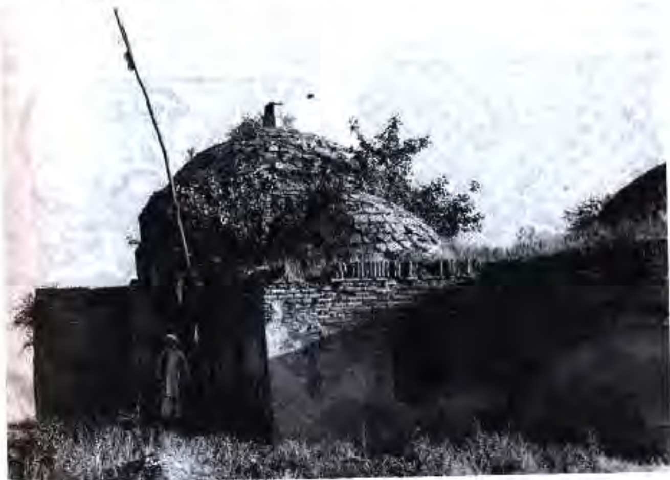
Мазори Маҳдуми Аъзам дар Ҳисор (соли 1547/).

Намунаи биноҳои зебои асри XVI дар деҳаҳои Чапарӣ ва Лайлауяи ноҳияи Қубодиён низ боқӣ мондаанд.