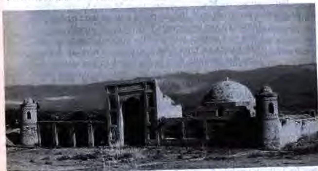
Мадрасаи Кӯҳна дар Ҳисор (асри XVI).

Яке аз сарчашмаҳои нодири таърихӣ ва адабии асри XVI асари Бобур Мирзо “Бобурнома” мебошад. Ин асар дар бораи Мовароуннаҳр, Афғонистон, Ҳиндустон, шаҳрҳои он ҷойҳо маълумоти дақиқ медиҳад. Дар “Бобурнома” воқеаҳо ҳодисаҳо аниқ ва таъсирбахш ифода ёфтааст. Дар ин асар роҷеъ ба Ҷомӣ, Биноӣ, Ҳилолӣ, Бехзод ва дигар арбобони илмию адабӣ маълумоти нодир пайдо кардан мумкин аст.