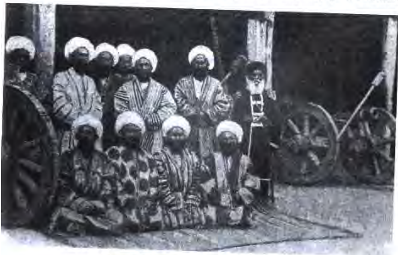
Каратук. Назди бошишгоҳи бек. Соли 1900

Ҳисор — масоҳаташ зиёда аз се миллиону 290 ҳазор таноб, нуфусаш 450 ҳазор нафар. Аз ин микдор қабилани лақай 150 ҳазор нафар, қабилани балос (барлос) 60 ҳазор нафар, қабилани марка 30 ҳазор нафар ва тоҷикон