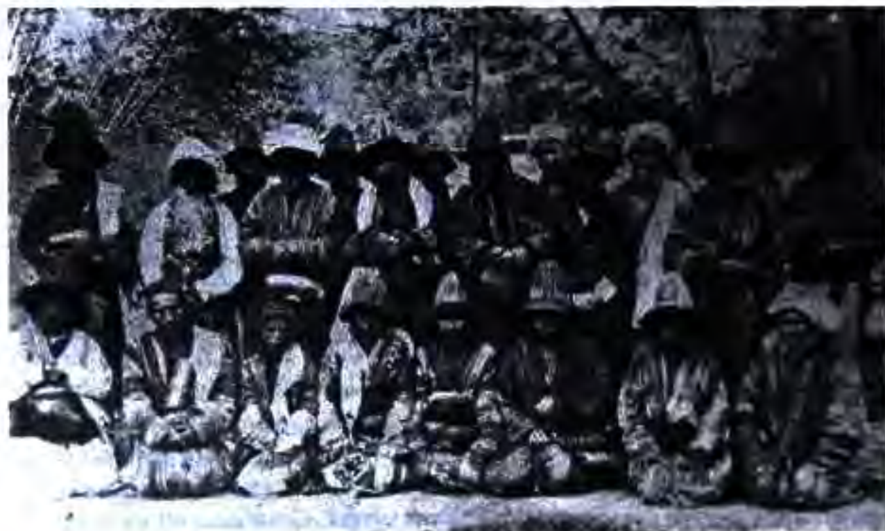
Дарвешон /акси соли 1903/

Тартиби ситонидани андоз чунин буд : ҳар сол аввали баҳор доруғаҳо барои ҷен қардани замини қорами деҳқон ва ҷамъ овардани “қўшпулӣ” ва “танобона” ҳозир мешуданд. Андоз аз барзаговҳои қорӣ (қўшпулӣ) аз 4 то 8 танга муайян шуда буд. Танобона андози пулӣ буд, ки аз обҷақорӣ ситонида мешуд.