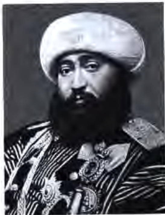
Амир Олимхон /1910-1920/

Баъди забти Осиёи Миёна аз тарафи ҳукумати подшоҳӣ якҷанд шаҳру вилоятҳои аморати Бухоро — Хучанд, Ҷирғатеппа, Фалғар, Мастчоҳ, Қиззах, Самарқанд, Панҷакент, Катта-Қўрғон ва дигар ҷойҳо ба зери дасти ҳукумати мустамликавӣ гузаштанд. Дар навбати худ, ҳукумати подшоҳӣ ба қарор омад, ки ба амири Бухоро мебояд ёрӣ расонид. Яъне ба ивази мулкҳои аз даст рафтааш бекигарихои ҷанубу шарқии Тоҷикистони ҳозира ва Помири гарбиро ба ихтиёри ӯ диҳад. Бекигарихои ин сарзамин дар амал ниммустамликавӣ буда, танҳо ба ном ба ҳайати мулкҳои амир (Ҳисор, Қабодиён, Қўлоб, Қаротегин, Дарвоз ва ғайра) дохил мешуданд.