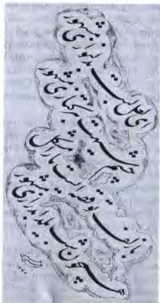
Намунаи хатти хаттот Мирҳусайни Истравшанӣ

нав марок зоҳир намуда буданд. Вале ҳукумати мустамликавӣ майли талаботи онҳоро қонеъ кунондан нашофт. Аммо баъд аз сохтмони роҳи оҳан, ривоч ёфтани муносибатҳои савдоӣ ва умуман инкишофи муносибатҳои иқтисодии Руссия бо Осиёи Миёна, маъмурияти мустамликавӣ ба одамони босавод эҳтиҷманд буданаширо ҳис кард. Чунки тарҷимонҳо ва мирзоҳо намерасид. Донишҷӯи забони русӣ барои тоҷирони маҳаллӣ ҳатмӣ гашт. Аз ҳамин сабаб маъмурияти ҳукумати подшоҳӣ соли 1888 дар боран кушодани мактабҳои русӣ-туземӣ дар Хучанд, Ўротеппа ва дертар дар Хоруг, қарор қабул кард. Чунин мактабҳо оҳиста-оҳиста обрӯ пайдо карда, байни ҷавонон диққатҷалбкунанда гаштанд. Бинобар он дар ибтидои асри ХХ дар тамоми уезди Хучанд, дар се мактаби ибтидоии назди қалисо, ду мактаби русӣ-туземӣ ва курсҳои шабонаи назди онҳо, тақрибан 2700 талаба таълим мегирифтанд. Дар солҳои аввали ташкилшавӣ дар ин мактабҳо фарзандони бойҳо ва тоҷирони маҳаллӣ меҳонданд. Аммо на ҳамаи хоҳишмандон, ҳатто фарзандони русҳои дар шаҳрҳо истиқоматдошта ба мисли аҳолии эҳтиҷманди маҳаллӣ, наметавонистанд дар ин мактабҳо таҳсил кунанд.