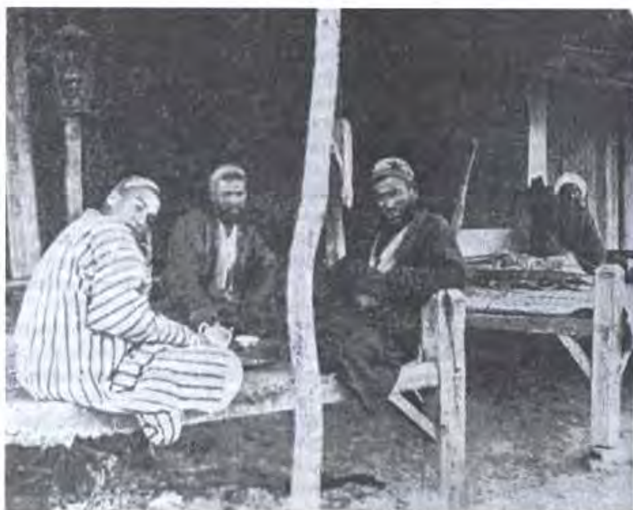
Чойхона дар бозори Қаратӯқ /соли 1903/

Восеъ фаност имрӯз Ҷонҳо фидост имрӯз Ғавғои рӯзи махшар, Бар фуқарост имрӯз.