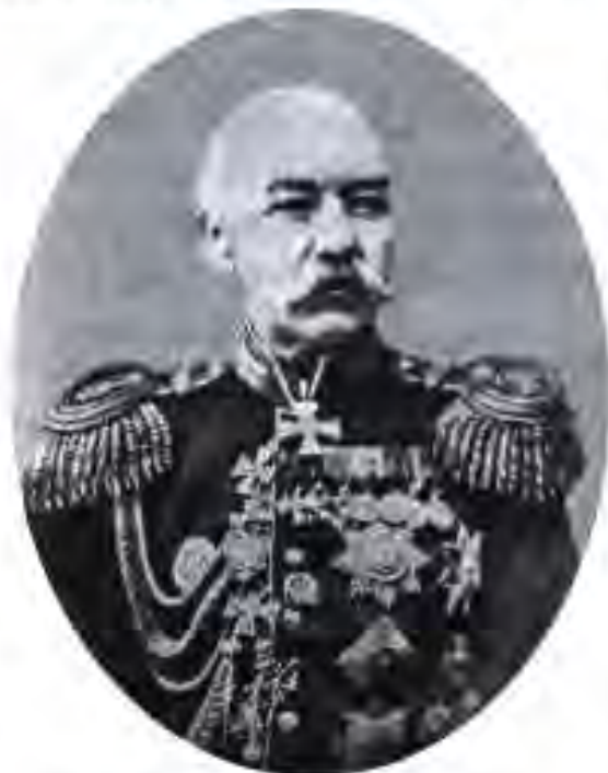
Фон -- Кауфман аввалин генерал -- губернатори Туркистон.

Ҳукумати подшоҳӣ барои идора кардани қисмати ниғолшудаи Осиёи Миёна соли 1865 вилояти Туркистонро, ки марказаш шаҳри Тошканд буд, таъсис намуд. Соли 1867 бо фаро гирифтани вилоятҳои Сирдарё ва Хафтруд вилояти Туркистон ба генерал-губернатории Туркистон табдил ёфт. Дар сари он генерал-адъютанти подшоҳӣ К.Т. Кауфман қарор гирифт. Ӯ ба ин вазифа бо "ярилики заррин" - и подшоҳ Александри II тайин шуда, соҳиби вақолати номаҳдуде гашт. Кауфман ҳақдор буд, ки бо давлатҳои ҳамсоя музокироти дипломатӣ барпо намоянд, ҷанг эълон кунад, сулҳ бандад ва монанди инҳо.