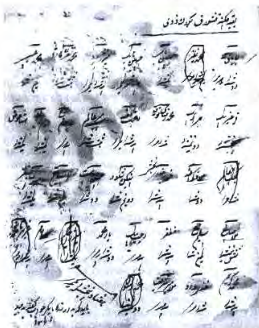
Бақияи ҷақянаи кишелоки калони Зиддӣ

Намуди дигари замин — заминҳои вақф буд. Аз даромади ин гуна замин ба манфиати масҷиду мадраса, мазору хонақоҳ ё роҳу кӯпрӯкҳо истифода мебуданд. Замини вақф дар аморати Бухоро аз рӯи миқдор ҷои дуҷумро ишғол мекард. Дар Бухорои Шарқӣ, хусусан дар ноҳияҳои кӯҳӣ замини вақф хело кам, дар баъзе ҷойҳо тамоман набуд.