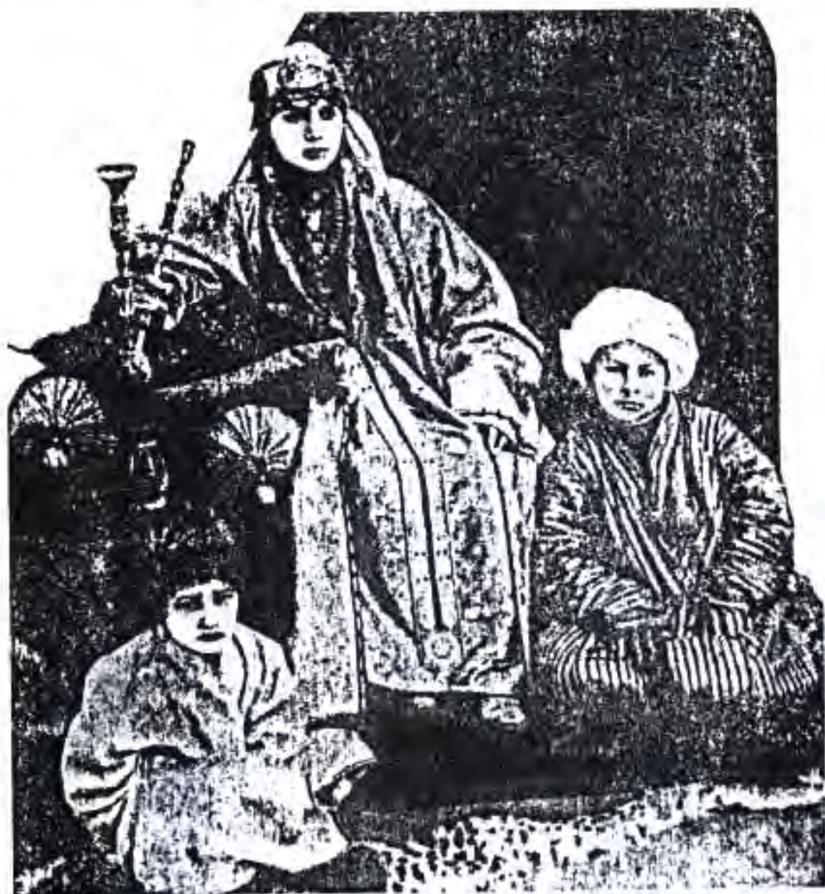
Зани асирлодаи Бухоро бо ду писараш

Дар мактабҳои ибтидоии завоҷи таълим боз ҳам бадтар буд. (Гейер М.И. Путеводитель по Туркестану, Ташкент 1901).