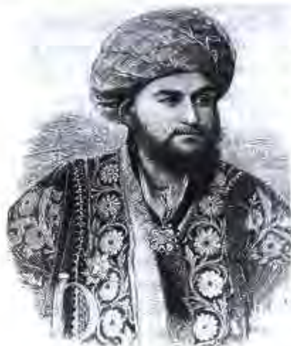
Амир Абдулаҳад /1885-1910/

Амир Абдулаҳадхон аз рафтори баъзе рӯхониёни сернуфузи Бухоро изҳори норозигӣ намуда, пойтахти худ — Бухороро тарк намуд ва дар шаҳри Кармина соқин гашт. Аз ҳамин шаҳр истода ӯ давлатро идора мекард. Ҳатто дар ҳинни муҳолифат ва қатлу ғорати мазҳабӣ байни сунниён ва шиҳо дар Бухоро (соли 1910), ӯ супориши расмӣ ҳукумати русхоро барои ба Бухоро рафта паҳш кардани он қабул накард. Ин вазифаро амир ба ӯҳдаи писараш Олимхон ҳавола намуд.