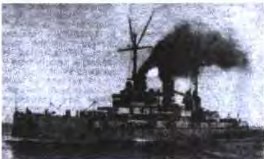
Киштии калони ҳарбии немисии “Вестфалия”, ки дар ибтидои асри XX сохта шудааст

Дар охири асри XIX – аввали асри XX ба хориҷа баровардани сармоя барои Германия аҳамияти калон пайдо кард. Сармоядорон маблағҳои худро ба иқтисодиёти Европани Ҷануби Ғарбӣ, Шарқи Наздик ва Америкаи Ҷанубӣ мебароварданд. Сармояи ба хориҷа