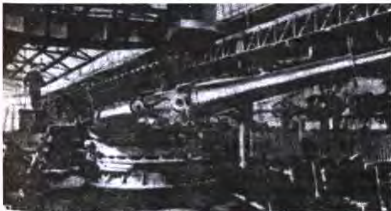
Васл кардани тӯпҳо дар заводи Крезе

Ба марказонидани истеҳсолот ва ба вуҷуд омадани ширкатҳои инхисорӣ нигоҳ накарда Фаронса аз давлатҳои пуриктидори сармоядорӣ хеле ақиб мемонд. Мо инро дар содироти молин он ҳам дида метавонем. Дар ин бобат дар ҷои якум пашм, дар ҷои дуҷум газвор, дар ҷои сеҷум абрешим, дар ҷои чорум шароб, дар ҷои ҳаштум маснуоти химиявӣ ва танҳо дар ҷои даҳум автомобил меистод. Аз рӯи суръати марказонидани истеҳсолот Фаронса аз ИМА, Германия ва Англия ақиб мемонд.