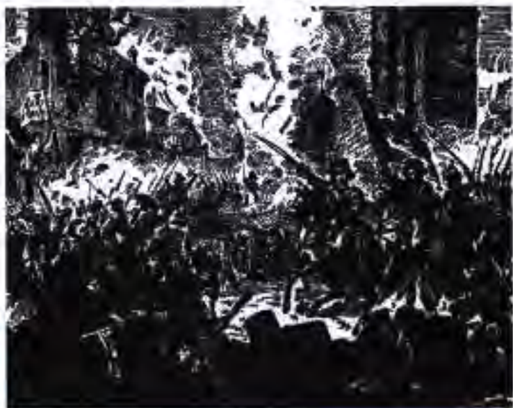
Гарибалдичини ҳангоми ҷанг дар ҷанҷаҳои Палермо соли 1860

Дастаи Гарибалдӣ ба соҳили ҷазираи Ситсилия бомуваффақият лангар партофта, ба амалиётҳои ҳарбӣ шурӯъ кард. Ба дастаи ӯ гурӯҳ-гурӯҳ деҳқонони ҷазира дохил мешуданд. Дастаи “куртасурхҳо” дар муддати кӯтоҳтарин сершумору пурзӯр гардид. Ин имконият дод, ки дар наздикии Калатафимӣ ба лашкари бар зидди Гарибалдӣ раванкардан шох голиб барояд. Ҷангҳои вазнин ҳангоми бадастдарории пойтахти ҷазира – шаҳри Палермо ба амал омаданд. Хушбахтона, ин дам шаҳриҳо шӯриш бардошта, ба тарафи Гарибалдӣ гузашта, ба ӯ барои тезтар ба даст даровардани шаҳр ёрӣ расониданд.