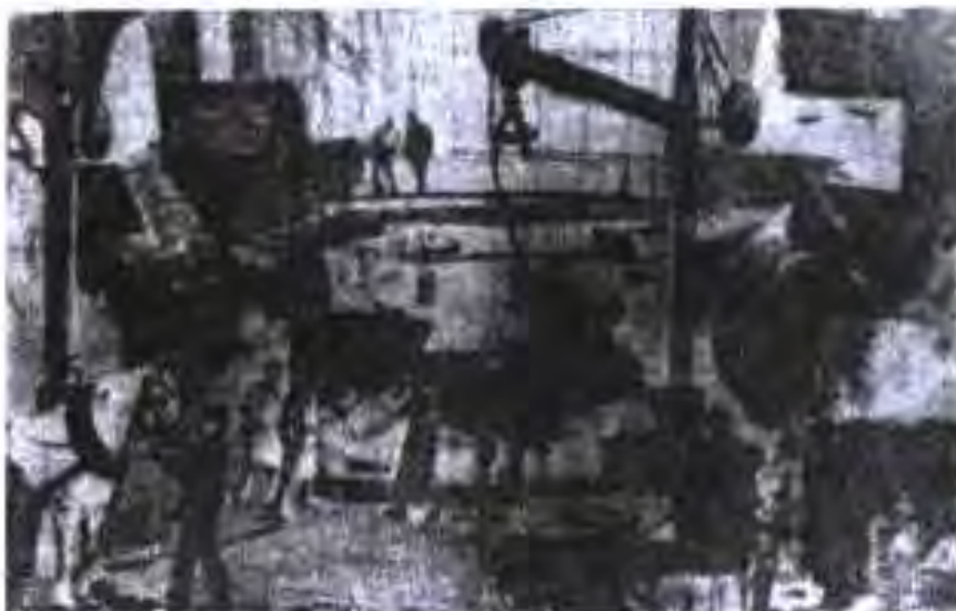
Сехи чўяну пўлодгудозни заводи Крупн дар Рур

Крупн, Тиссен, Стиннес ва дигарон. Саноати электротехникӣ аз тарафи ду ширкати калонтарин назорат карда мешуд: “Симменс-Галске” ва “АЗГ”. Дар саноати химиявӣ ду гурӯҳи инхисор ташаккул ёфтанд. Дар киштисозӣ ду ширкат инхисор буданд: “Ллойди Германияи Шимолӣ” ва “Гамбург–Америка”.