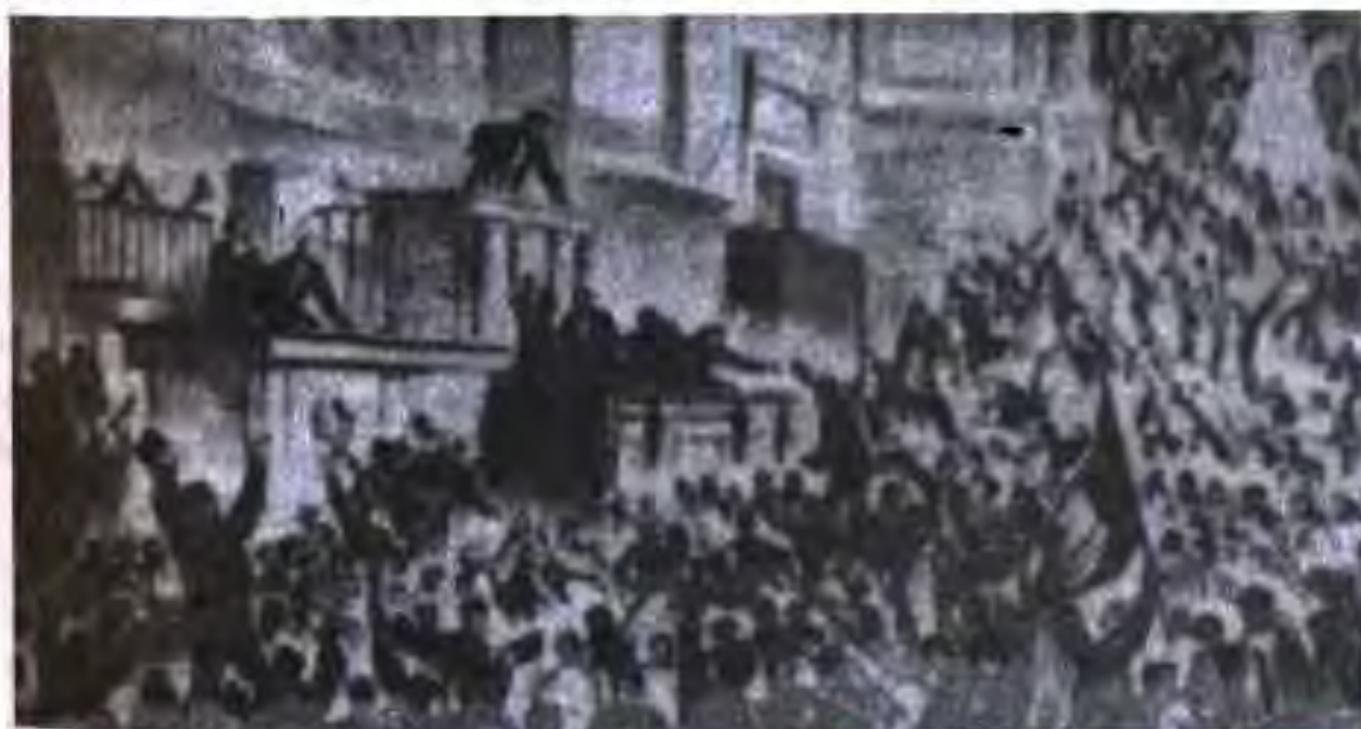
Халқ дар толори Қонунбарор. 4 сентябр соли 1870

Инқилоби 4 сентябри соли 1870 дар таърихи Фаронса инқилоби чорумин буд. Ҳарчанд дар он мардуми оддӣ ғалаба карда бошад ҳам, буржуазияи дар ин кор таҷрибадори Фаронса аз он истифода бурда, аз рӯзи аввали инқилоб ҳокимиятро ба даст гирифта, ҳукумати муваққатиро ташкил намуд.