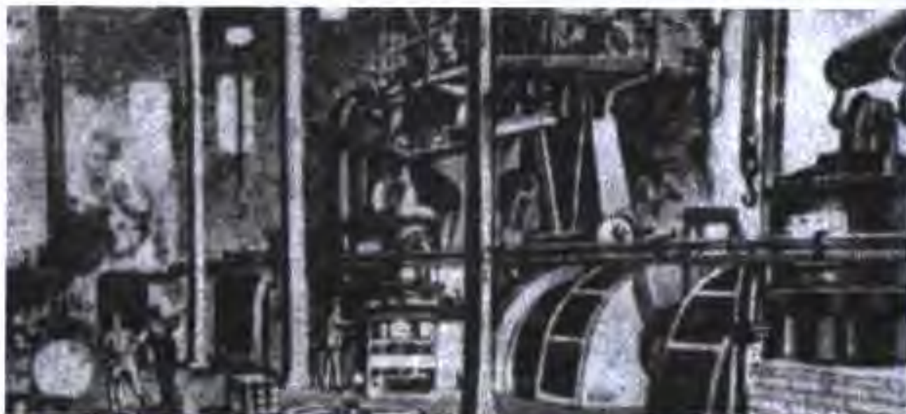
Толори мошинҳои стансияи барқии марказӣ дар Берлин. Соли 1890

Дар натиҷаи марказонидани саноат молҳои саноатӣ бештар дар фабрикаҳои калон истеҳсол карда мешуданд. Дар байни онҳо заводҳои пӯлодгудозӣ ва аслиҳасозии Крупп мавқеи намоёнро ишғол карданд. Соли 1875 дар корхонаҳои ин соҳибкори калон ҳамагӣ 122 нафар коргарону мутахассисон кор мекарданд, лекин