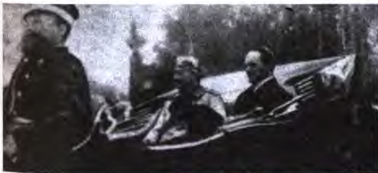
Вилгелми II ва Крупн. Расми соли 1912

Ба вучуд омадани инҳисорҳо. Дар асоси марказонидани истеҳсолот шумораи иттиҳодияҳои инҳисорӣ мунтазам зиёд мешуд. Дар Германия шакли аз ҳама маъмули инҳисорҳо картелҳо ва синдикатҳо буданд. Ин инҳисорҳо иттифоқи корхонаҳое буданд, ки соҳибони онҳо бо роҳи созиши якҷоя нархи навои молҳои истеҳсолкардаи худро дар дараҷаи муайян нигоҳ медоштанд, ҳаҷми истеҳсоли молро муайян менамуданд, бозори молфурӯширо дар байни худ тақсим мекарданд ва ғайра. Баъзеи онҳо ниҳоят калон шуда буданд. Масалан, синдикати ангиштистеҳсолкунии Рейн-Вестфалия дар соли 1910 ба 95,4 фоизи истеҳсоли умумии ангишти музофот назорат мекард. Дар саноати маъданкоркунӣ синдикате ба вучуд омад, ки ҳамаи заводҳои пӯлодгудозиро муттаҳид намуд. Саноати вазнини мамлакат дар дасти 30 инҳисори пурқувват буд: консернҳои