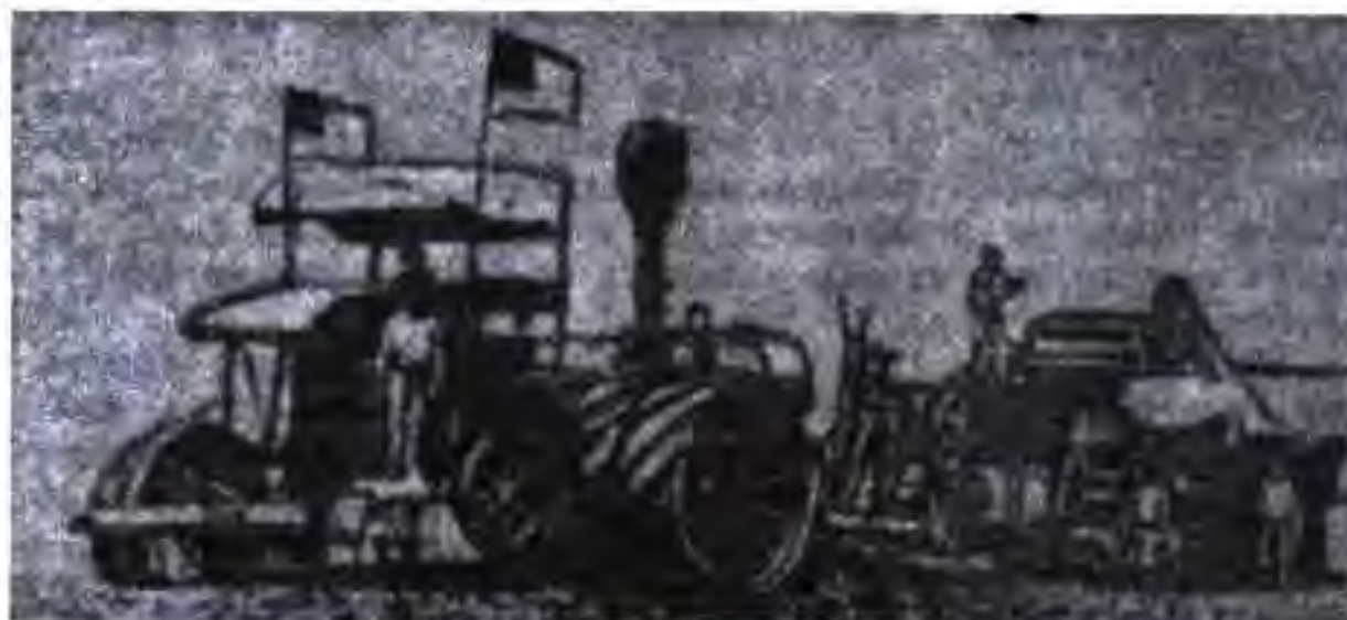
Трактори чархдор ва комбайн дар Калифорния

Дар миёнаи солҳои 80-ум ихтироъкорони немис Г. Даймлер ва К. Бенце типҳои нави ҳаракатдиҳандаи дарунсӯзро кор карда баромаданд, ки он бо бензин кор мекард. Ин ҳаракатдиҳанда дар нақлиёти берелс истифода бурда мешуд. Олими немис Р. Давал ҳаракатдиҳандаи нави дарунсӯзро сохт, ки он ба сӯзишвории вазнини моеъ кор мекард.