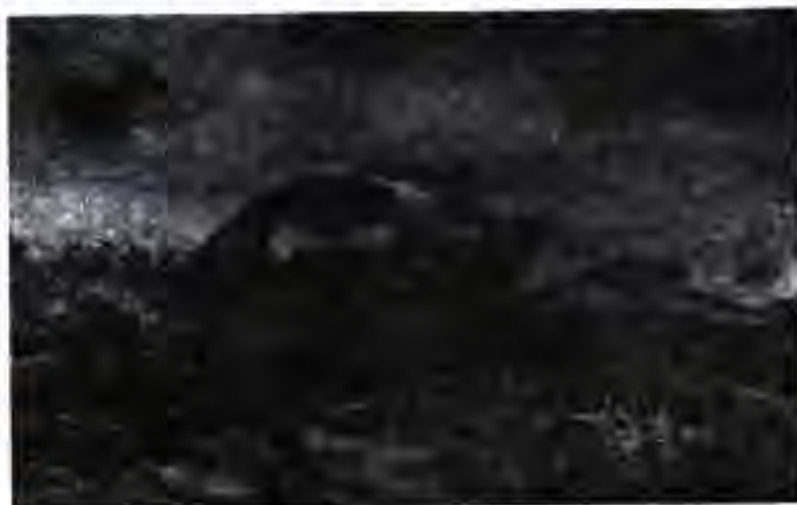
Аввалин танкҳо ба ҷониби хандакҳои немис ба ҳучум мегузаранд

Қувваҳои муттаҳидаи немисҳою австровеенгерҳо дар Горлицса хати мудофиаи фаронсавихоро раҳна карданд. Ҷузъу томҳои лашкари немисӣ дар самти шимолтари Варшава ба ҳучуми зидди