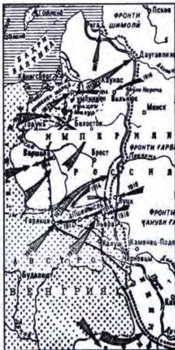
Амалиёти ҳарбӣ дар ҷабҳан Шарқӣ (солҳои 1914 – 1917)

Дар солҳои чанг ИМА ба давлатҳои Антанта лавозимоти чангӣ ва озӯқа фурӯхта, аз ин ҳисоб сарвати фаровон гун кард. Акнун империализми ИМА бо ин бойгарию тавононаш мехост, ки ҳукмрони ҷаҳон шавад. Танҳо баъди се соли чанг – моҳи апрели соли 1917 бо ҳамин мақсад бо Германия чанг эълон кард. Ин хабарро шунида, ҳукуматдорони Англия ва Фаронса саросема шуданд. Онҳо дар фикри он буданд, ки ИМА аз музаффариятхояшон истифода набарад. Барои ҳамин ғалабаи худро бар давлатҳои гурӯҳи германиявӣ тезонданӣ буданд. Вале ба Англия ва Фаронса муяссар нашуд, ки то ба Европа расида омадани артиши ИМА Германияро