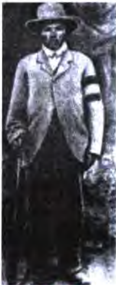
Хендрик Витбой (1824 – 1905). У шахси босавод ва сиёсатмадор буд. Витбой ягонагии хабашхоро шарт муваффақиятноки муборизаи зидди мустамликадорон медонист

1904 – 1907 ниҳоят шадид буд. Моҳи январӣ соли 1904 готтентотҳо тахти роҳбарии пешвои худ Хендрик Витбой шӯриш бардоштанд. Дар ин шӯриш қабилаҳои гереро низ ғайилона ширкат варзиданд. Ҷанги нобаробари готтентотҳою гереро бар зидди Германия то соли 1908 давом кард. Дар ин ҷанг артиши Германия ғалаба кард. Баъди ин ғалаба империализми Германия дар Ҷанубу Ғарбии Африка режими мустамликавии шадиди худро ташкил намуд.