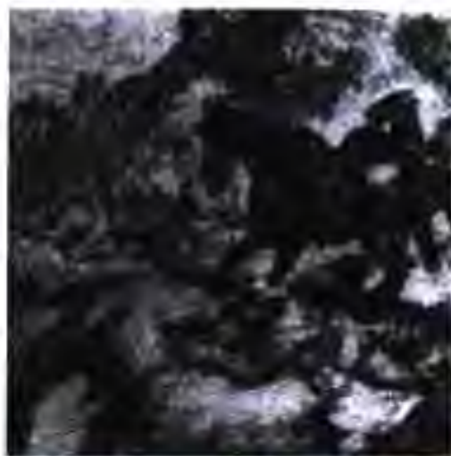
Чанги бурҳо бо англисҳо

Императори Германия Вилгелми I аз вазъи қулайи баамаломата истифода бурда, ба президенти ҶАҶ Крюгер баркияи табрикӣ фиристода, ишора кард, ки Германия бурҳоро дар муборизаашон бар зидди Англия дастгирӣ хоҳад кард. Вале ин ваъдаи императори Германия дурӯғ баромад. Империалистони англис бошанд, ҳамонро барои барҳам додани истиклолияти бурҳо мубориза мебурданд.