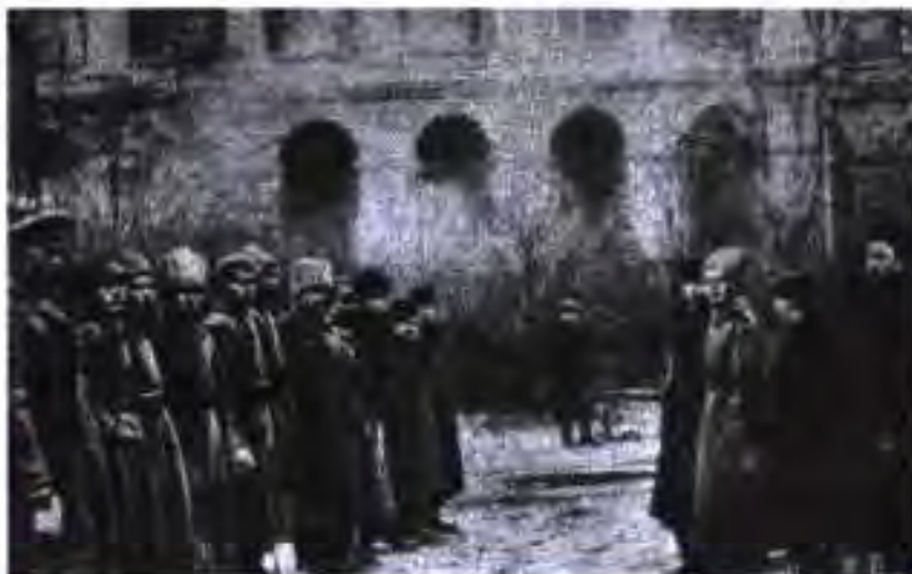
Гвардиячиёни Сурх Смолнийро дар рӯзҳои октябрӣ хифз менамоянд

Вале ҳокимияти ҷумҳурӣ дар Русия дер давом накард. 25 октябри соли 1917 дар Петербург табaddулоти инқилобӣ ба амал омад, ки дар натиҷа дар Русия дар шакли шӯроҳо диктатураи пролетариати РКП(б) барпо гардид. Баъди ғалаба болшевикони Русия аз Германия сулҳ талабиданд. 3 марти соли 1918 Русияи Шӯравӣ бо Германия сулҳи алоҳида баста, бо ҷамин аз Ҷанги якуми ҷаҳонӣ баромад.