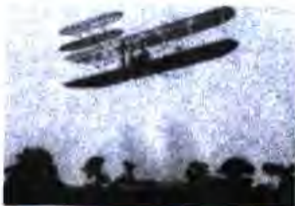
Самолёти Блерио, ки аз болон Ла-Манш соли 1909 парвоз карда буд

Дар солҳои 90-ум дар ИМА, Швейсария, Германия, Италия, Англия роҳҳои оҳани барқии наздишаҳрӣ ва байнишаҳрӣ сохта ба истифода дода шуданд. Тепловози аввалине, ки бо сӯзишвории дизелӣ кор мекард ва суръати ҳаракаташ дар як соат 100 км буд, ба роҳ баромад.