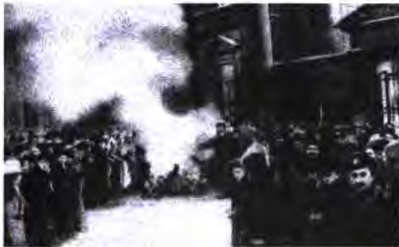
Завол ёфтани мутлакият дар Русия. Феврари соли 1917

Дар охири соли 1916 ва аввали соли 1917 дар Русия ҳам бӯҳрони инқилобӣ ба амал омад. Вазифаҳои он аз сарнагун кардани ҳукумати подшоҳӣ, барпо намудани ҷумҳурии демократӣ, ба халқ додани озодиҳои демократӣ ва аз ҷанг баровардани Русия иборат буданд.