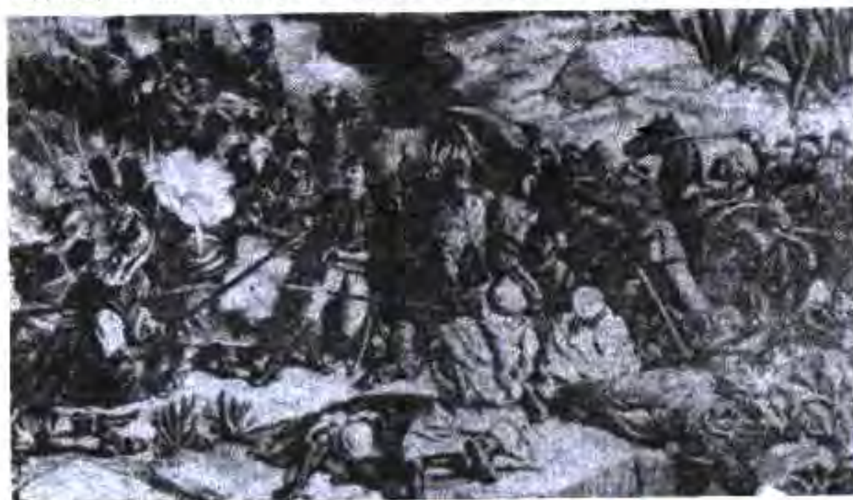
Чанги туарегҳо бо дастаҳои Фаронса

Немисҳо Африкаи Ҷанубу Ғарбиро ишғол карда, аҳолии маҳаллиро бераҳмона истисмор мекарданд. Ҷавобан ба ин қабилҳои готтентотҳо ва гереро ба муборизан озодихоҳӣ даст заданд, ки он зиёда аз 20 сол давом кард. Ин шӯриш дар солҳои