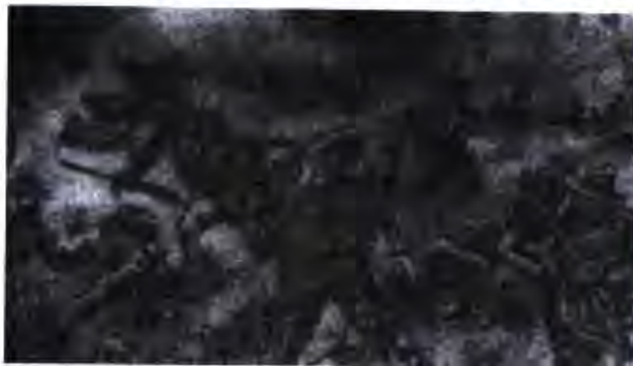
Истифодаи буғи хлор ба муқобили англисҳо дар Белгия

Тирамоҳи соли 1915 Булғория аз тарафи Иттифоқи Сегона ба ҷанг даромад ва ин иттифоқ номи “Иттифоқи Чоргона” (Германия, Австро-Венгрия, Туркия ва Булғория)-ро гирифт. Лашкари муттаҳиди Австро-Венгрия, Германия ва Булғория ба