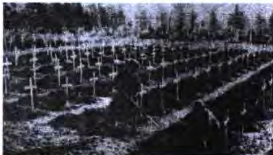
Қабристон аскарҳои Фаронса

Русҳо барои ба фаронсавиҳо англисҳо ёри расонидан боз ба ҳучум гузаштанд. Моҳи июн сарбозони ҷабҳаи ҷанубу ғарбӣ, ки сарфармондеҳи он генерал А. А. Брусиллов буд, хати муқофиаи германиявӣю австровенгриявиро раҳна карда, қувваҳои душманро то 80 – 100 км ба ақиб партофтанд. Фармондеҳии артиши Германия маҷбур шуд, ки аз майдони ҷарбу зарби ҷабҳаи ғарбӣ як қисми лашкарашро ба ҷабҳаи ҷанубу ғарбӣ бар зидди сарбозони генерал А. А. Брусиллов равои кунад. Ба ин нигоҳ нақарда лашкари русҳо қисми Галитсия ва Буковинаро ба даст даровард. Дар ин самт қисми лашкари немисҳо ба муқобили Руминияи аз тарафи Антанта баҷангдаромада ҳучум кард. Русия маҷбур шуд, ки ҷабҳаи худро дар ин минтақаи ҷанг ба масофаи қариб 500 км дарозтар кунад, то ки ҳучуми иттифоқии нави худ Руминияро дастгирӣ намояд.