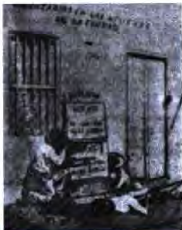
Ҷанги ҷирикҳои Мексика бо америкавӣҳо дар Веракрус

Оммаи кишоварзони беамин ва камзамин барои ба даст даровардани замин мубориза мебуданд. Онҳо ба дастаҳои инқилобӣ дохил мешуданд ва широкҳои Сапата “Замин ва озодӣ” ва “Бо сарбаландӣ мурдан беҳ аз зистан бо сари ҳам”-ро сармашки муборизаи худ карда буданд. Буржуазияи дар сари ҳокимият буда зуд ба кишоварзон замин дода натавонист. Ин ҳолат авҷи ҳаракати инқилобиро боз ҳам баландтар кард. Дастаҳои ҷирикӣ дар зерирӯи Сапата ва Виля ба артишҳои мунтазами кишоварзон табдил ёфта буданд.