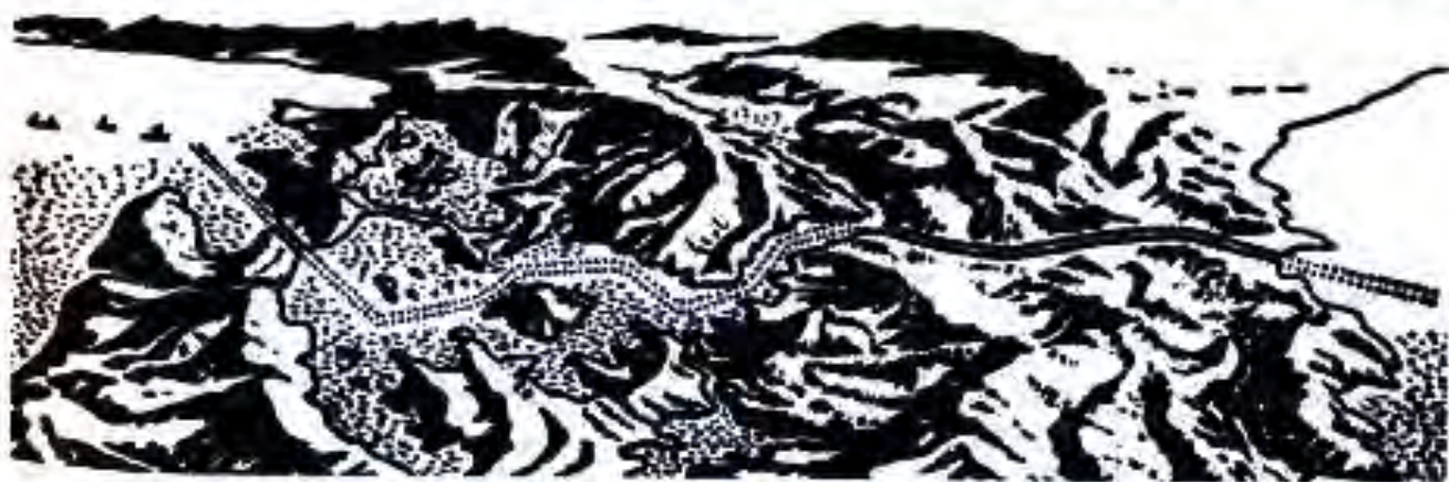
Канали Панама солҳои 1904 – 1914 сохта шудааст. Дар тарафи чапи нақша Уқёнуси Атлантик, дар тарафи рост Уқёнуси Ором

Соли 1907 ИМА аз мушкилоти молиявии Ҷумҳурии Доминикан истифода бурда, бар болои он протекторат ва вомбаргҳои асоратовари худро бор мекунад. Чун дар Куба ИМА дар Ҷумҳурии Доминикан ба ташкили ҳамагон ҳукуматҳои роҳ меод, ки гапдари бошанд. Баромадҳои оммаи халқ бар зидди