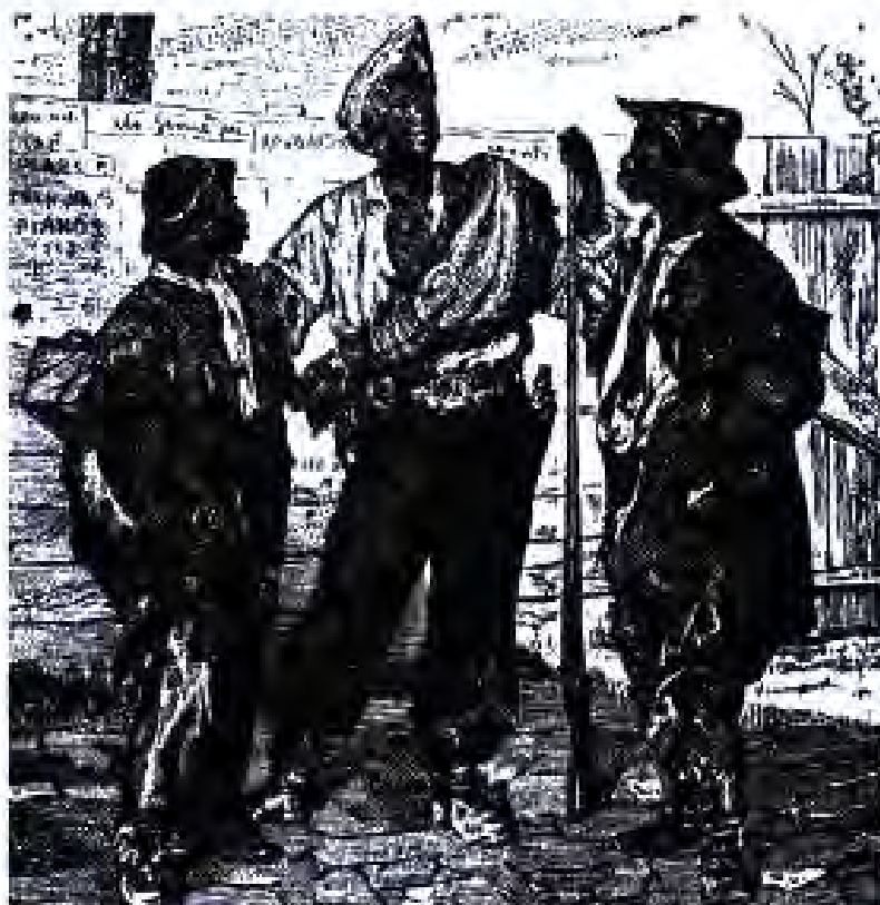
Бозгашти аскарони ихтиёрӣ. Зағғин ҷавон дар боран ҷангҳои гузашта нақл мекунад

Соли 1901 ИМА бо Англия созишномае бааст, ки мувофиқи он ҳуқуқи сохтмони истифодаи Канали Панамаро ба даст даровард. Ҳарчанд ҳукумати Колумбия ин созишномаро рад кард, аз дасташ қоре наомад. ИМА зидди ин давлат исён ташкил намуда, ба ёрии исёнгарон сипоҳ фиристонд. Колумбия маҷбур шуд, ки ба тақдир тан диҳад. Аз ҳамин вақт сар карда империализми ИМА бар зидди рақибони камқуввати худ сиёсати “дарраи калон”-ро ба қор мебардагӣ шуд. Бо ҳамин роҳ ба гардани як қатор мамлакатҳо шартномаҳои асоратоварро бор мекард. Масалан, соли 1907 нисбат ба Санто – Доминга ҳамин хел рафтор карда буд.