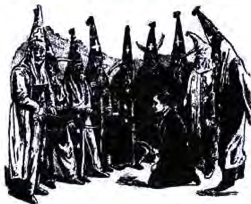
Куклуқеклонҳои сафедпӯст ҳомии зангиҳоро ваҳшиёна ҷазо додананд

Системаи бисёрҳизбӣ ба интихобкуяндагони ИМА имконият медод, ки номзади сазоворро президенти мамлақат интихоб кунанд, ба Конгресс ва мақомоти қонунгузори дигари марказию нелот низ ашхоси сазоворро интихоб намоянд. Ҳамин ҳел ҳам мешуд, ки номзади ба мансаби президентӣ соҳибшуда ба