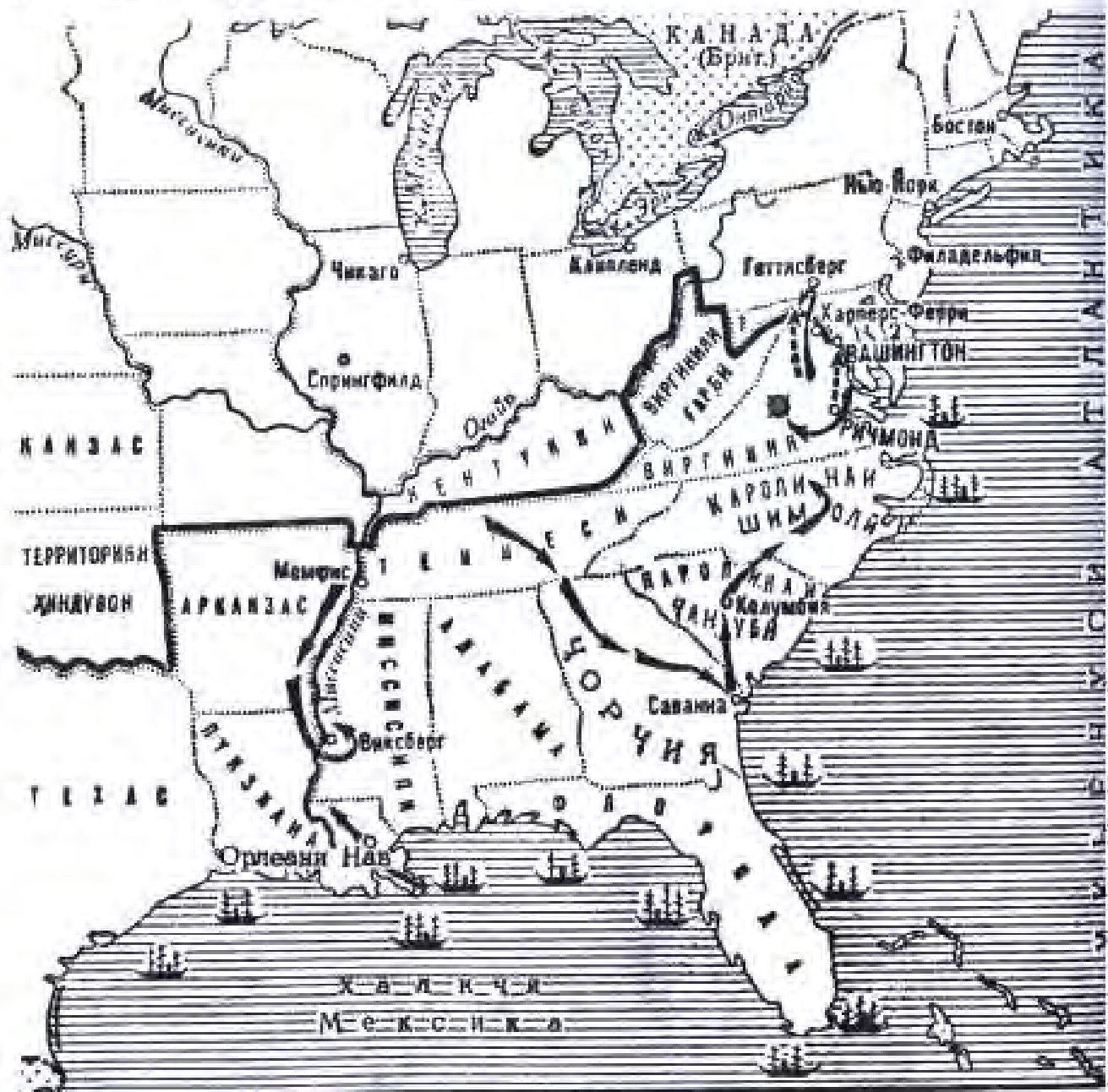
Ҷанги мулкӣ дар ИМА дар солҳои 1861 – 1865

Иёлотҳои Муттаҳидони Америкаи ҳамонвақтаро мамлақати трестҳо меномиданд, зеро шакли маъмултарини инхисорҳои сармоядорони ин мамлақат трестҳо буданд. Асосгузори трести аввалини ИМА Давид Рокфеллер мебошад. Ӯ дар солҳои ҷанги шаҳрвандӣ аз ҳисоби фурӯши аслиҳа бой шуда, аз болои корхонаҳои нафтистехсолкунӣ ва тиҷорат ҳам назорат ҷорӣ намуд. То саршавии Ҷанги якуми ҷаҳонӣ трести Рокфеллер “Стандарт ойл” ба яке аз корхонаҳои калонтарини нафтистехсолкунии ҷаҳон табдил ёфт. Он то 90 фоизи маҳсулоти нафтии мамлақатро истеҳсол мекард. Рокфеллерро “Ҷаноби миллиардер” меномиданд. Ин ном ба сарватмандии ӯ мувофиқ буд. Аз ин лақаб Рокфеллер ҳатто намеранҷид. Дар нибтидои асри XX аз ҷор се ҳиссаи истеҳсолоти саноатии ИМА-ро трестҳо назорат мекарданд.