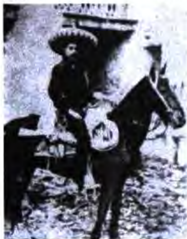
Эмилиано Сапата (1880 – 1919) – фарзанди деҳқони камбағал, аз синни наврасӣ ба муқобили бедодгарӣҳои заминдорон мубориза мебард

Инқилоби буржуазӣ-демократӣ дар Мексика (солҳои 1910 – 1917). Аз соли 1876 то соли 1911 дар Мексика ҳокимияти диктаторӣ дар дасти президент генерал Порфирио Диас буд. Вай мамлакатро ба давлати ҳарбию политсиягӣ ва ниммустамликаи империализми Америка табдил дод. Сиёсати доир ба замин, ки Диас ба амал мебаровард, барои халқ ниҳоят ҳалокатовар буд. Ҷӯран деҳқонони хиндуро аз замин маҳрум карда, заминҳои ҷамоавиро қашада мегирифт. Миллионҳо кишоварзони хиндуи хонавайроншуда маҷбур буданд, ки дар қонҳо, қорхонаҳои нафт-қорқунӣ, заминҳои ширкатҳои инҳисории хориҷӣ ва дар заминҳои заминдорони маҳаллӣ қор кунанд. Замин, ҷангал ва дорони дигари кишоварзонро ширкатҳои инҳисории хориҷӣ ва рӯҳониёни Мексика қашада гирифта, аз худ мекарданд.