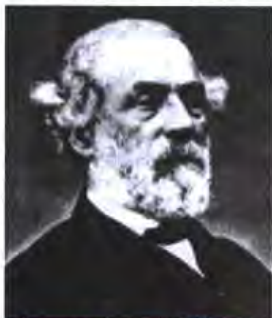
Генерали шимолиҳо Грант

Аҳамияти ғалабаи Шимол бар Чануб. Дар натиҷаи ғалабаи Шимол ягонагии миллии ИМА нигоҳ дошта шуд. Ҳокимият ба дасти буржуазия даромад. Акнун мансабҳои президентӣ, Сенат ва