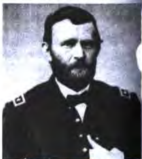
Генерали чанубиҳо (Конфедератсия) Ли