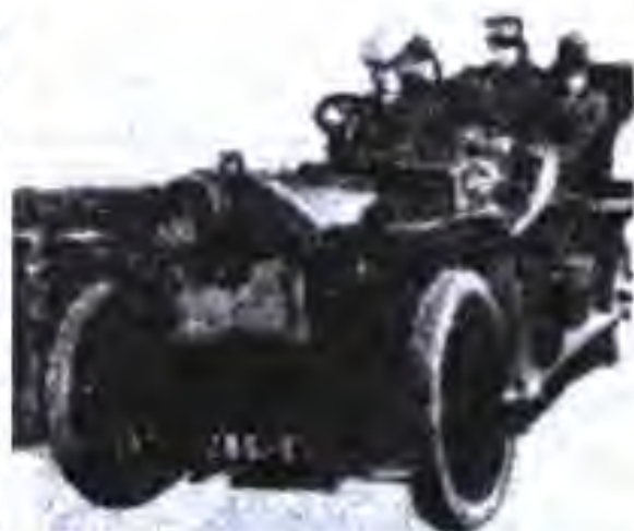
Автомобили "Форд" дар ибтидои асри XX. Соли 1913

Фаъолияти тресту банкҳо. Дар охири асри XIX бойгарии ИМА торафт бештар ба дасти трестҳо мебаромад. Инҳисор гардидаи нақлиёти роҳи оҳани мамлакат нисбат ба дигар соҳаҳо барвақтар доир гардид. Дар ин соҳа "Иттифокҳои роҳи оҳан"-и Вандербилт, Гулда, Хатигтон ба вучуд омаданд. Дар солҳои 80-ум истеҳсоли пахта, рағани зағир, шароб, сурб, найшакар, гӯгирд ва тамоку инҳисорӣ карда шуданд. Дар истеҳсоли мис яке аз аввалин ширкатҳои инҳисорӣ Гутенхейм дар кӯҳҳои Бют ва Монтанаи Аризона ташкил карда шуд. Ин трест дар зарфи 30 сол аз он ҷойҳо ба маблағи 2 млрд доллар мис истеҳсол кардааст.