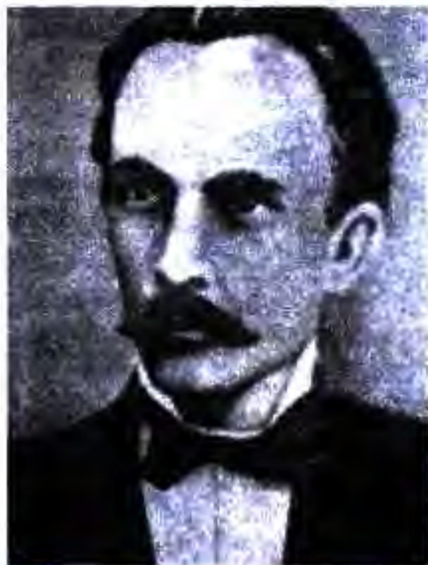
Хосе Марти (1853 – 1895) – шоир, публицист ва педагог, сарвари барҷастаи муборизаи озодихонаи халқи Куба. Дар ҷанги зидди мустамликадорони Испания ҳалок гардидааст

банан ва қаҳва. Ҳамин тариқ, мамлакатҳои Америкаи Лотинӣ ба манбаи ашёи хоми мамлакатҳои Европа ва ИМА табдил меёфтанд.