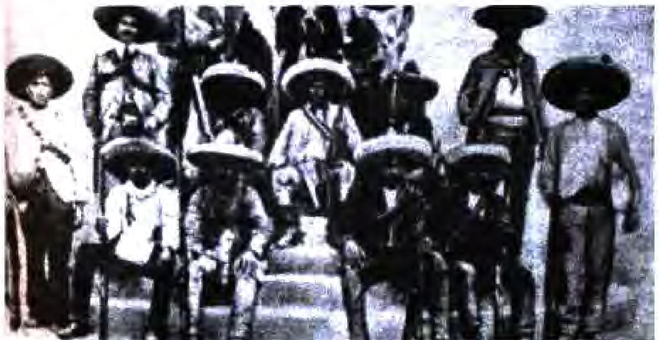
Франсеско Вилла (1877 – 1923) дар миёни ҳамсафояш. Диловарии ӯ афсонавӣ буд. Ӯро “қапони лашқари озод” ном мебарданд

Дар аксари мамлакатҳои Америкаи Лотинӣ тез-тез шӯришҳои кишоварзон ба амал меомаданд. Дар солҳои 80-ум ин шӯришҳо махсусан дар Бразилия аз ҳама шадидтар буданд. Дар ин ҷо шӯришҳои кишоварзон бо шӯришҳои зангиён пайваستا нерӯи бузургеро ташкил менамуданд.