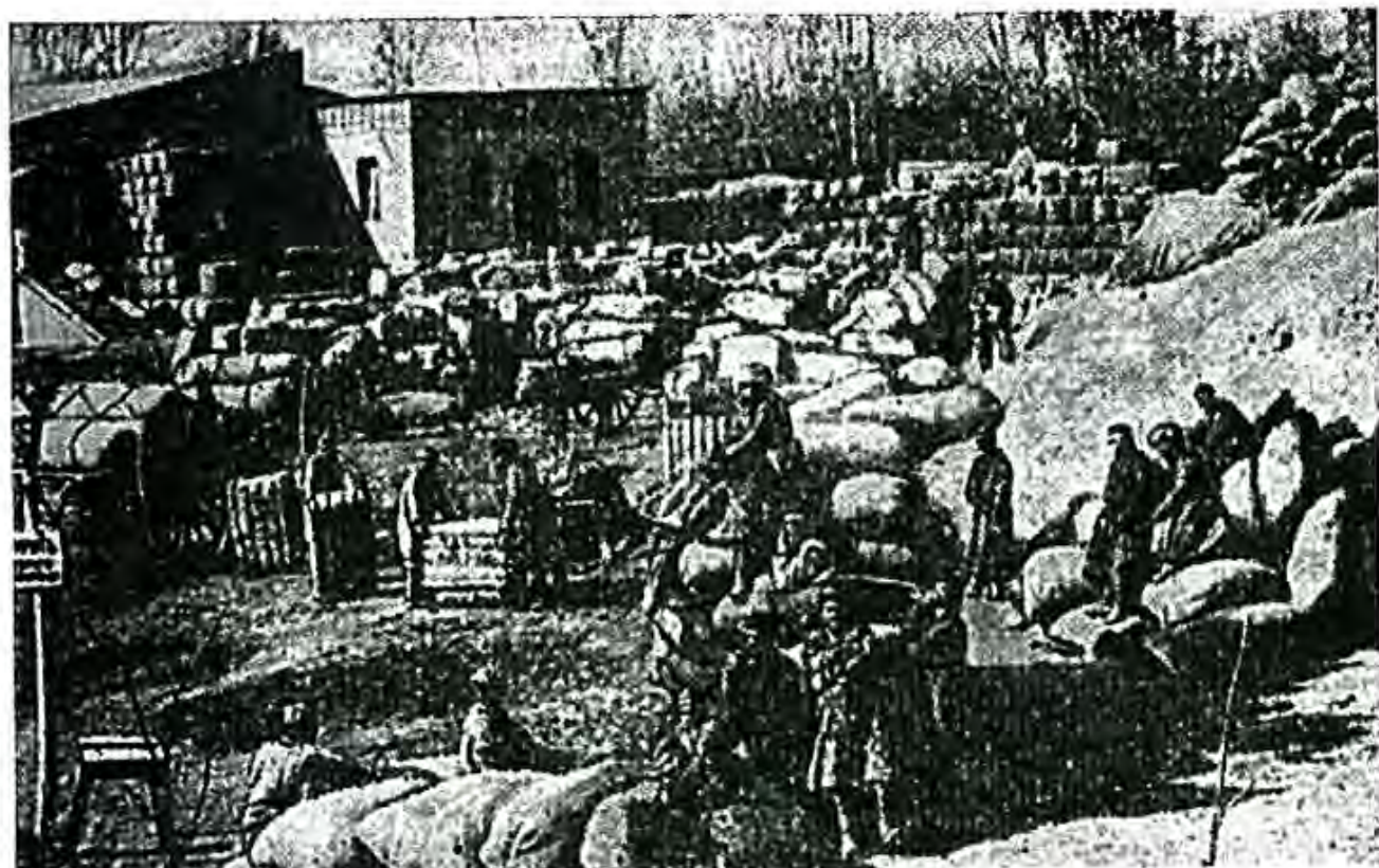
Лаҳзаи хариду фурӯши пахта дар майдони яке аз заводҳои пахтазоакунӣ

Чӣ хеле ки дар боло ишора шуд барои мутобиқ гардонидани фаъолияти бонкҳо дар шароити Осиеи Марказӣ, махсусан барои амалӣ гардидани амалиёти қарздиҳии онҳо, рафокатҳо ва ширкатҳо нақши махсусро бозидаанд. Ширкатҳо ва рафокатҳо, ки солҳои 70-90-и асри XIX дар Осиеи Марказӣ амал мекарданд, аксарият рафокат ва ширкатҳои москвагӣ ва ё худ дигар шаҳрҳои марказии Русия буданд. Вале онҳо ҳам