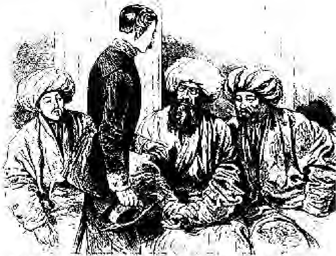
Ахмади Дониш (1826-1897, ў дар мабайн) - асосгузори ҳаракати маорифпарварӣ дар Осийи Марказӣ. (Сурати соли 1874, ҳангоми бо аъзоёни сафарати Бухоро дар Санкт-Петербург будан гирифта шудааст)

бештар мустақилона, дар меоси асарҳои олимони Шарқ, ғанҳои табиёт, риёзиёт, нучум, ҳайат, таърих, фалсафаи табиӣ ва адабиётро меомӯзад.