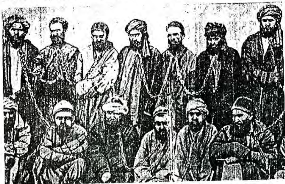
Иштирокчиёни шӯриши соли 1898 дар Андиҷон, ки занҷирбанд гардиданд