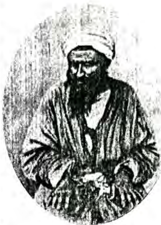
Муҳаммад Алӣ (Мадалӣ-эшон, Эшони дукчӣ, Дукчӣ-эшон). Сарвари шӯришгарони Андиҷон дар соли 1898

Дар аввал дар атрофи Мадалӣ-эшон тақрибан 200 нафар саворагон аз деҳаи Тоҷики уезди Мингтеппа чамъ шуданд. Баъд ба онҳо мардуми худи Мингтеппа, ки деҳаи сераҳоли ба ҳисоб ме-рафт, ҳамроҳ гардиданд. 17