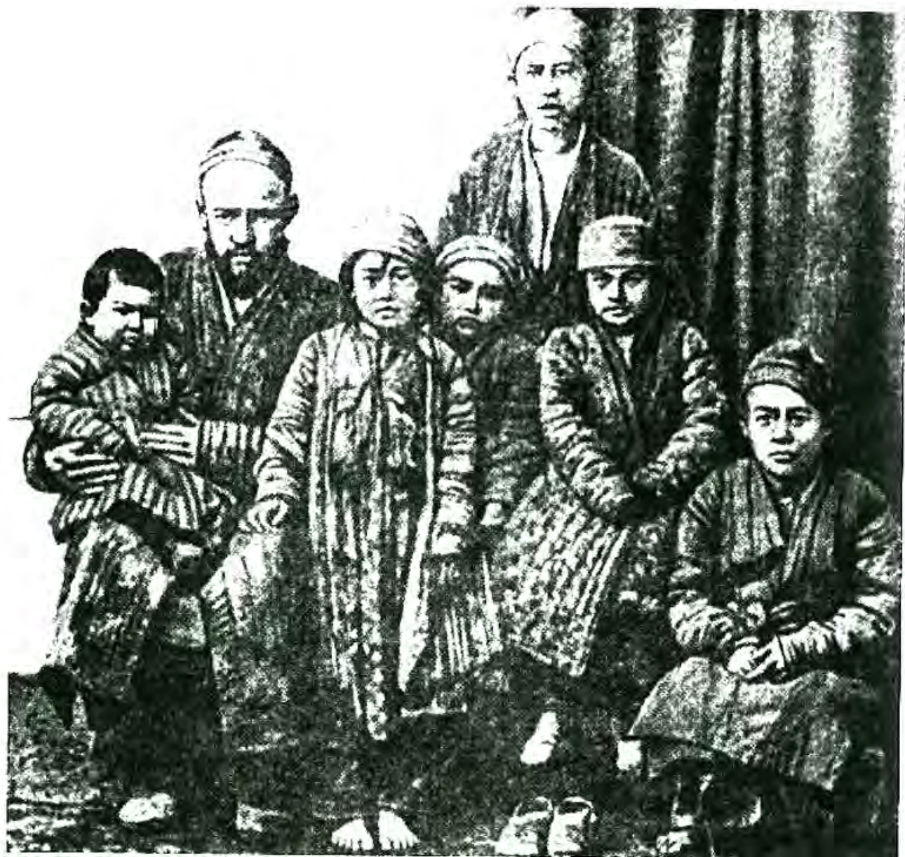
Ҳаёати оилаи марғуми камбизоати водии Фарғона (охирӣ асри XIX ва аввали асри XX)

шароити вазнини кор норозӣ шуда, аз хӯчаини кон зиёд на- мудани маоши худро талаб карданд. Вале рохбарияти кон аз ичрои талаби коргарон саркашӣ намуд. Коргарони ба қаҳр омада мудирӣ кон ва ду нафар назоратчиёни конро маҷруҳ намуда, барои шикоят ба Панҷакент рафтанд. Аммо ҳуку- матдорони маҳаллии волостӣ ба муқобили онҳо қувваро исти- фода бурда, се нафар фаъолонро ҳабс ва як қисми дигарро аз кор озод намудаанд. Ягон талаби коргарон қонё нагардид. Баромадҳои коргарӣ бошад дар шароити Осиёи Марказӣ, махсусан кишвари Туркистон, чун дар Русия, амри воқеӣ гар- дида, зуд-зуд дар нуқтаҳои гуногун ба амал меомаданд.