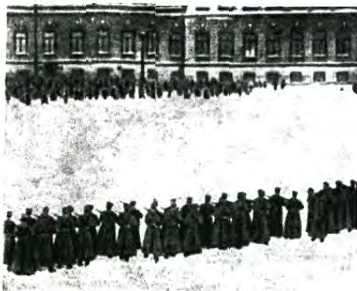
9 январи соли 1905. Лаҳзаи дар шаҳри Петербург, дар майдони Қасри Зимистена аз тарафи аскарони ҳукумати подшоҳии Русия тирборон кардани намоиши осоиштаи коргарон

нори империяи Русия, аз он ҷумла дар кишвари Туркистон ҳам амал мекарданд.