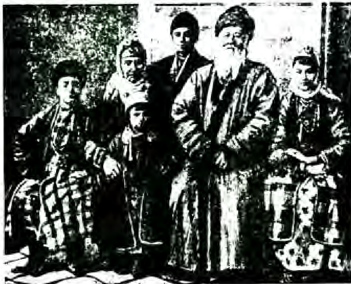
Ҳайати оилаи тоҷири бадавлати аҳуди бухорӣ

Дар сарзамини имрӯзаи Тоҷикистон аввалин намоёндагони синфи коргар дар гурӯҳи ноҳияҳои шимолӣ чумхурӣ,