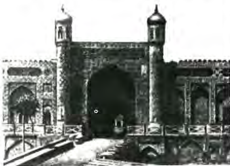
Қасри хонҳои охири Қўқанд

амир Насрулло дар муддати 20 сол ба Шаҳрисабз 32 маротиба ҳуҷум карда, ниҳоят соли 1856 онро ба зерӣ дастӣ худ даровард ва тамоми ашхоси намоёни қабилҳои кенагаси ўзбекро, ки он ҷо ҳукмронӣ мекарданд аз дами