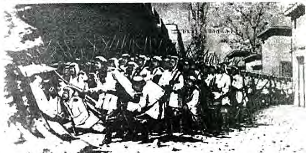
Лаҳзаи ба шаҳри Самарқанд дохил гардидани аскарони рус дар соли 1868 (аз рӯи расми расом В.В. Верешагин)

Дар чунин вазъият гуфтушуниди намояндагии Русия ва Бухоро оид ба масъалаи тиҷорат давом дошт ва он 11 майи