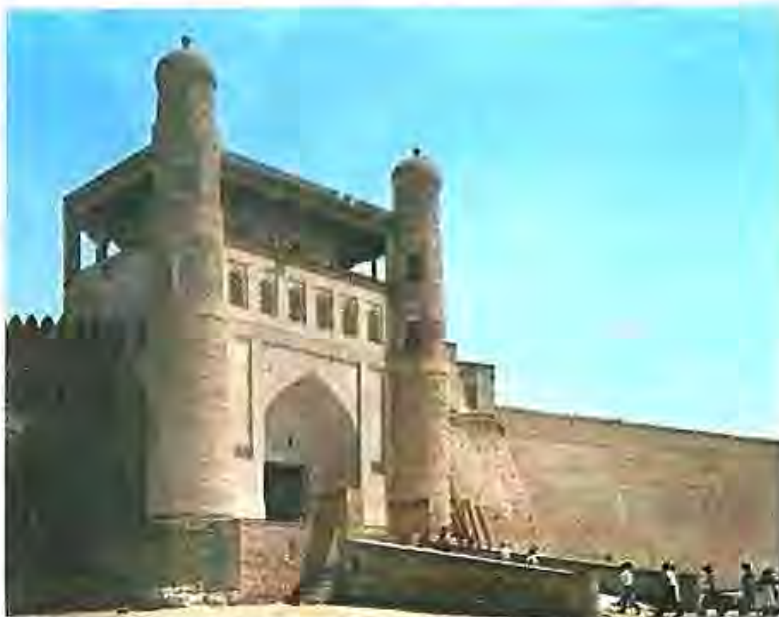
Арки Бухоро - қасри хонҳо ва амирон ба ҳисоб мерафт

Дар Осиёи Марказӣ, дар арафаи ҳучуми кӯшунҳои Русияи подшоҳӣ дар қатори