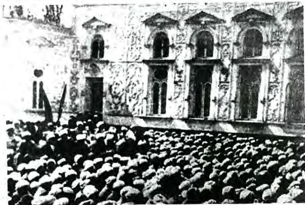
Гирдиҳамое, ки дар Ситораи Моҳи Хоса бахшида ба эълони таъсиси Ҷумҳурии Халқии Шӯравии Бухоро ташкил гардидааст

6-8 октябри соли 1920 дар Ситораи Моҳи Хоса анҷумани (курултойи) якуми муассисони Умумибухороии намояндагони халқ баргузор гардид. Дар он 1950 нафар намояндагон иштирок доштанд, ки онҳоро дар митингҳо, майдони бозорҳо бо нишондоди ҳизби коммунистии Бухоро «интиҳоб» намуда-