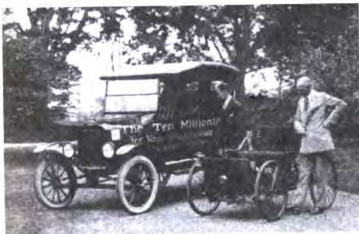
Ҳенри Форд ва ҷисариаш бо яке аз аввалин автомобилҳои ва автомобилҳои 10-миллионии ташкили "Форд-Модел-Т"

Супоришҳои бузурги ҳарбии давлатҳои Антанта ба ширкатҳои Америка қарзи Иёлоти Муттаҳидаи Америкаро кам карданд. То соли 1919 маблағгузори дарозмуддати давлатҳои Европа дар ИМА то 3 млрд. доллар паст фаромад. Дар баробари ин ИМА содироти сармояро ба хориҷа густариш дод. Шакли асосии ин содирот вомбаргҳо буданд. Маблағи умумии содироти вомбаргҳо то аввали соли 1921 11 млрд. долларро ташкил намуд. Ба давлатҳои хориҷӣ маблағгузори хусусии сармоядорони Америка низ афзуд. Соли 1919 ин гуна маблағгузори ба 6,5 млрд. доллар расид. Аз ин бармеояд, ки ИМА дар солҳои ҷанг аз мамлақати қарздор ба мамлақати бузурги қарздиҳанда табдил ёфта будааст.