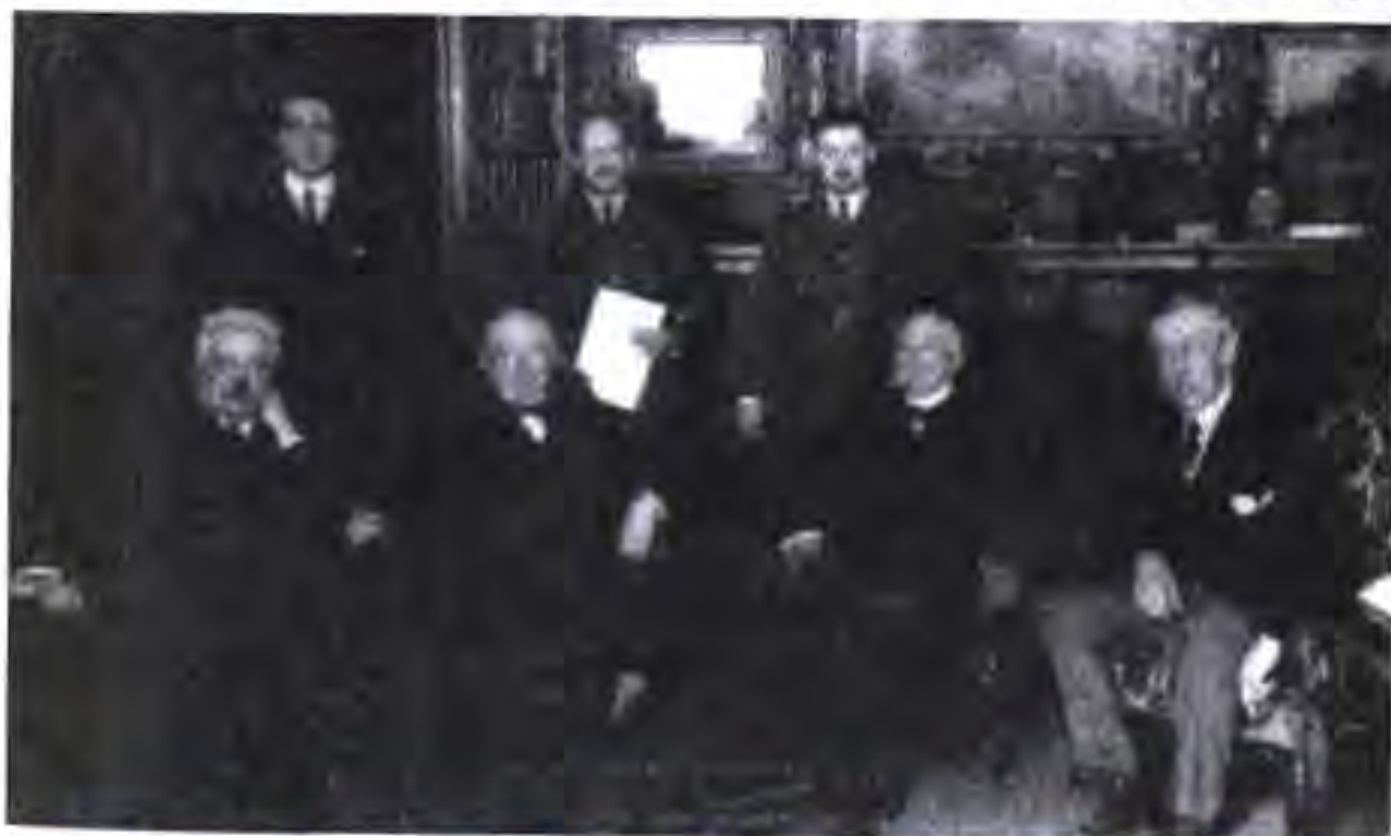
Намояндагони чор кишвар дар Конференсияи сулҳи Париж, соли 1919, баъди ба охир расидани Ҷанги якуми ҷаҳонӣ. Аз чап ба рост: сарвазир Италия Викторно Орландо, сарвазир Британия Кабир Девид Ллойд Ҷорҷ, сарвазир Фаронса Ҷорҷ Клемансо, президент Иёлати Муттаҳидан Америка Вудро Вилсон.

Лигаи Миллатҳо. Қисмати аввали Созишномаи сулҳи Версал таъсис намудани Лигаи Миллатҳо дар назар дошт. Дар ин қисмати созишнома Ойинномаи Лигаи Миллатҳо ҳам инъикос гардида буд.