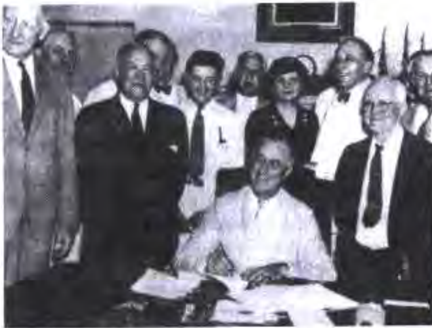
Президент Франклини Делано Рузвелт ба яке аз Қонунҳои барномаи "Нью-Девел" - "Рохи Нав" имло мегузорад.

Дар қисмати аввали ҚМБС қорӣ намудани танзими давлатии саноат дар назар дошта шуда буд. Ба ҳамаи иттиҳодияҳои саноатӣ пешниҳод карда шуд, ки барои худ "Қонуни виҷдони соҳибкор"-ро кор карда бароянд. Баъди аз тарафи президенти ИМА тасдиқ карда шудан "Қонуни виҷдони соҳибкор" ҳукми қонунро мегирифт. Дар ин қонунҳо шароити корхона, ҳаҷми истеҳсол, бозори молфурӯшӣ ва андозаи нархи молҳо, ки аз он паст фурӯхташ мумкин набуд, инъикос ёфтанд.